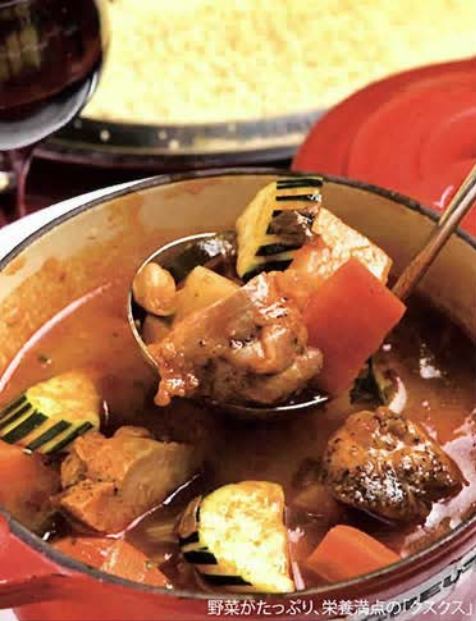
野菜がたっぷり、栄養満点の「クスクス」

神戸市中央区北野町4-9-2 営業時間／ランチ11:00～15:00、ディナー17:00～22:00 定休日／月曜 P／無 http://www.terrasse-de-paris.jp ☎078-252-1113