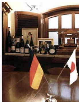
国内有数のドイツワイン専門店

神戸でドイツ料理といえばここ「ローテ・ローゼ」。ドイツの伝統料理、家庭料理、地方の料理など、本格欧風料理と、ドイツワイン輸入元の直営店ならではの、常時350種を超えるドイツワインが楽しめる。お料理に合うワインは、予算を言った上でスタッフに相談してみてもいい。