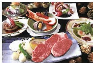
鉄板焼「六甲」クリスマスディナー