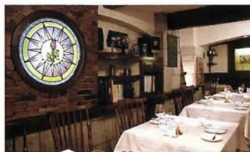
そぼくなレンガ造りの店内は温かみがある