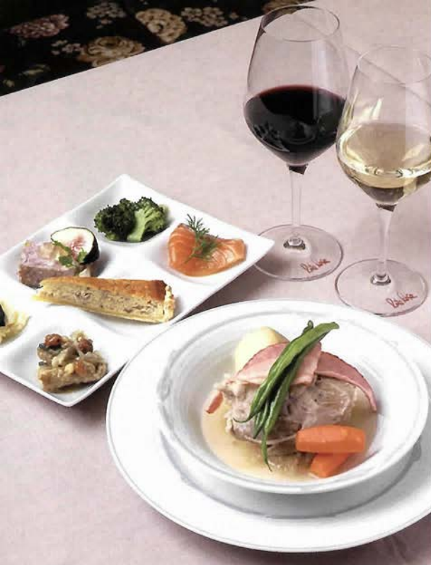
アイスバイン(手前)、オードブル盛り合わせ(奥)

神戸市中央区北野町4-9-14 営業時間／17:00～23:00(L.O.22:30) 定休日／火曜、水曜、12/31～1/4休 ☎078-222-3202