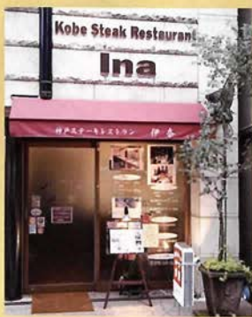
神戸ステーキレストラン