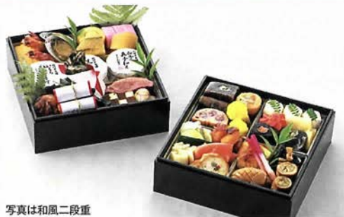
写真は和風二段重

お申し込み受付 各レストランにて12月20日(土)まで。 (10:00a.m.～8:30p.m.)