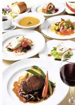
クリスマス限定コース「Menu Noel」(8,400円) ぜひご予約を