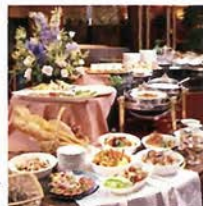
クリスマスバイキング (写真はイメージ)