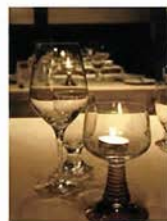
クリスマスにはドイツ料理を...