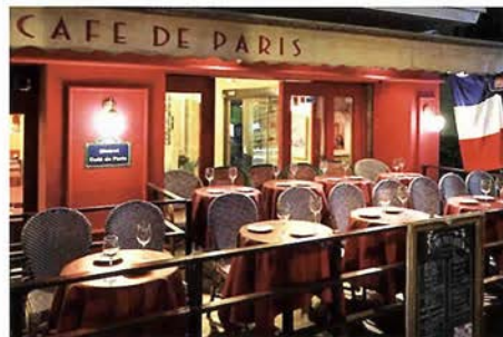
姉妹店「ビストロ・カフェ・ド・パリ」