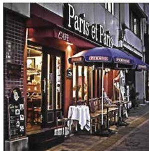
「カフェテラス・ド・パリ元町店」

バースデーや記念日などの記念日には、特別フルコース(2名様～)がお一人様10,500円。二次会、忘年会、同窓会などのパーティも、お気軽にお問い合わせを。