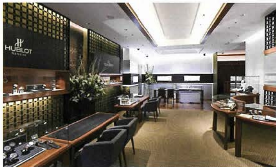
あたたかく出迎えてくれるアットホームな雰囲気