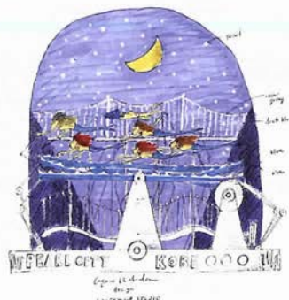
明石海峡大橋開通10周年を記念して作製される 「パールブリッジと月の雫」