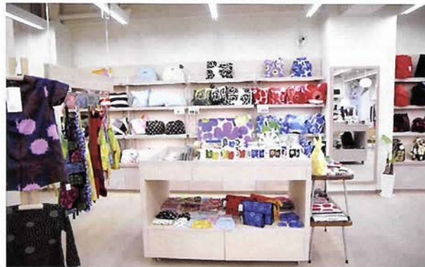
デザイン性の高い北欧雑貨が並ぶ2階「デンマークショップ」