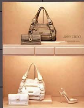
世界のセレブリティの定番バッグはやはり人気