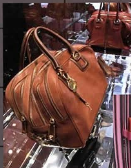
新作バッグもいち早く登場