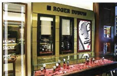
広々とした店内の中 お気に入りの一品を