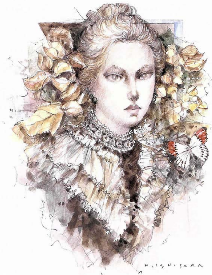
石阪春生 「赤い蝶(女のいる風景)」 2008年