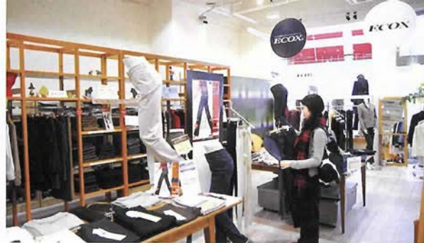
履き心地抜群のワークパンツ、セレクトブランドを扱う1階ショップ

ウオーキングを楽しんでみては。 2階ショップは、北欧の雑貨、本、 食器などを扱う。かわいらしい雑貨 たち、使い勝手がよく、デザインにす ぐれた北欧出身のアイテムは、あな たの生活にほんのり灯りをともして くれるはず。