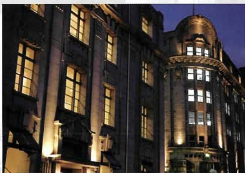
旧居留地海岸道には、格調の高い建築物が建ち並ぶ

旧居留地は、ユネスコ「デザイン都市・神戸」(※1)の二つの核になり得ると思います。古いだけでは凍結保存、新しいだけならどこへ行っても同じ街。私共も「旧居留地連絡協議会」の活動に参加さ