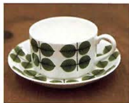
「Bersa」洗練された北欧デザイン