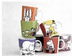
やっぱりかわいいムーミンシリーズ