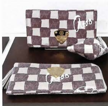
豚革に手描きで市松を施した新コレクション 「doodle」シリーズ

れ、使うごとに手になじみ、愛情 すらわいてくる。この冬も、3周年 を記念した新しい市松ラインシリ ーズ、オリジナルのロングダウンコー トなど数多くの新商品が登場し た。