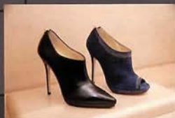
今年の秋冬新作・ブーツシリーズ