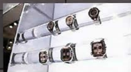
豊富なウォッチコレクション