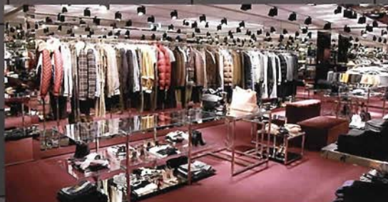
チェック柄でもD&Gならではの大胆なアイテムが多数