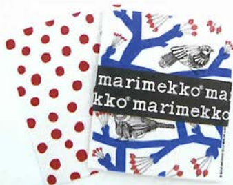
スポンジクロス (2枚組) ¥1,575

『PALLOSET (パッロセット)』は、マリメッコ人気デザイナー“Maija Louekari マイヤ・ロウエカリ”の最新デザイン。「小球体」という意味のパッロセット。深く、落ち着いた色合いのドットが冬のコーディネートアクセントになりそうですね。