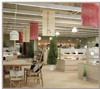
北欧の家具・雑貨・衣料売場の他に キッズルームやカフェスペースも。