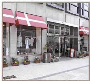
神戸大丸の北斜前、三宮神社東隣。赤と白 のデンマーク国旗の屋根が目印！