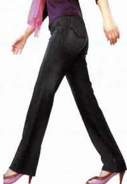
最高のストレッチ素材が脚長・細身を実現 「スーパーストレッチスキニーパンツ」