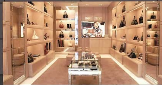
ページトゥーンに甘美なライティングが落ちる洗練された空間