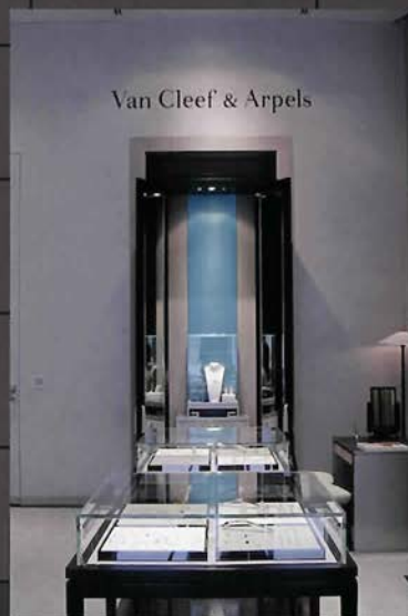
Van Cleef & Arpels