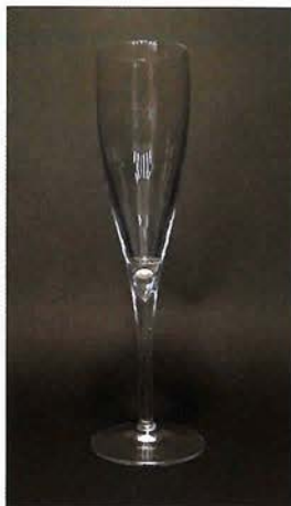
シャンパングラスや焼き物と真珠のコ ラボレーション。アコヤ真珠を新しいア イデアで、カジュアルに楽しむ