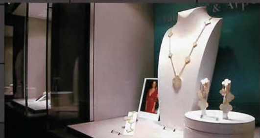
繊細だけれど存在感のある魅惑のライン