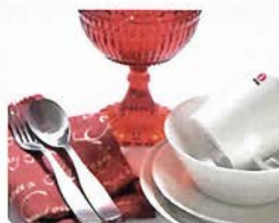
フィンランド生まれの高品質の ガラス器「iittala」