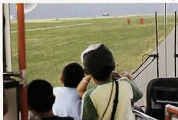
滑走路周遊道路をバスに乗って