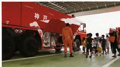
空港内消防署の見学