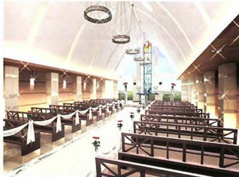
リニューアルイメージ(内装)