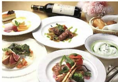
Menu-Patrie ¥5,775 (全9品)

(アミューズ・オードブル・スープ・魚料理・肉料理・パン・デザート・コーヒー又は紅茶・プティフル)