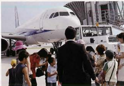
飛行機を間近で見学、 興味津々の子どもたち