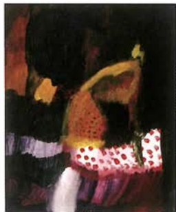
「サーカス-Circus-」 アクリル F20 2007年