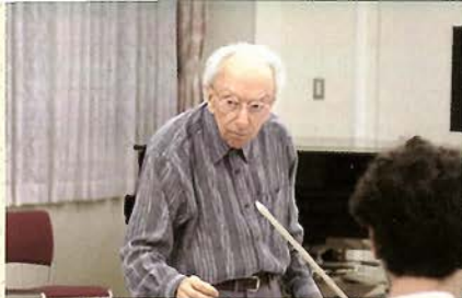
神戸市室内楽合奏団のリハーサル中

ちよつとお話が落ち着いたところで、初来日のことを聞くと「1961年の演奏旅行が最初でした。当時の日本は今と違い肥満の人が少なかったのと、髪は皆さん黒でした(笑)。着物の人も多かったですね。驚いたのは礼儀の正しき。京都