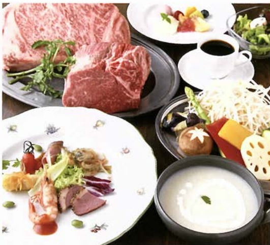
お肉を堪能できるコース料理

自慢に思うのだ。 青山ステーキコース (6500円)、青山特選摩耶コース (8900円)、ほかアラカルトやお肉のオーダーカットも可。