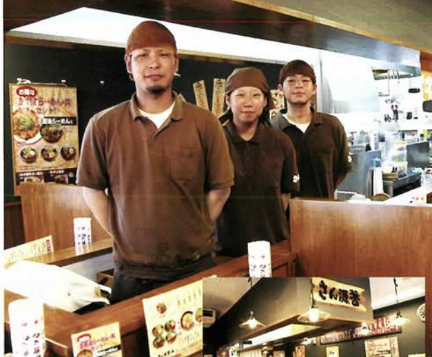
スタッフの皆さんの元気さも清々しい

まず「生醤油らーめん」（630円）は、とにかくシンプルであっさり。でもしっかりだしがきいていて、しょう油の旨味が味わえる。そして背脂こってり好きにはたまらない「コク醤油らーめん」（680円）。常連さんは底からしっかり混ぜて食べるのだとか…深〜いコクのスープと、脂ののった厚切りチャーシューを堪能。「だし醤油らーめん」（680円）は、白菜がたっぷりのって、香ばしい味わいのだが、やみつきになりそう。とにかく各々がおいしく、ハズレなしなのが驚く。さすがオーナーが長年考えて作りだしたしょう油味である。ほかにも牛すじ醤油らーめん、生醤油らーめん具沢山、餃子や手づくり豚まん、仙台直生牛タン丼なども。店内はカウンターとテーブル席、ごちんまりとしたお店。