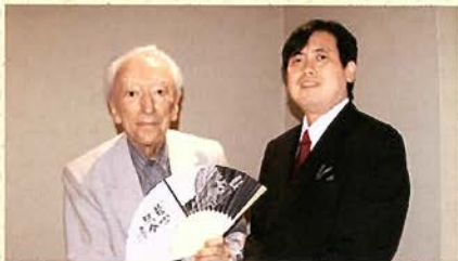
ゲルハルト・ポッセさんと筆者

うに来日し、霧島国際音楽祭を創立し音楽監督として指導。新日本フィルハーモニー交響楽団など多くのオーケストラの客演指揮としても活動を続け、2000年に「神戸市室内楽合奏団」の音楽監督に就任しました。神戸の印象を聞くと、