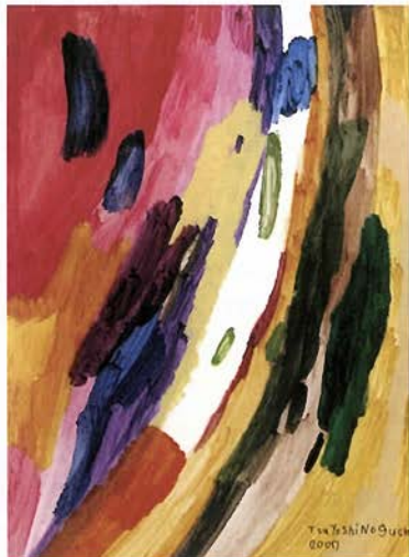
「エイサーの風 -Winds from EISAR-」 アクリル P20 2007年