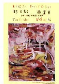
制作(有)アートエクスプレス