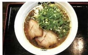
コク醤油らーめん