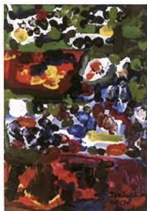
「神戸の夜-Night in Kobe-」 アクリル油彩 SM 2007年