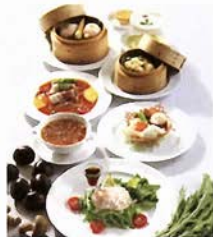
「季節のヌーベルシノワコース」

オープンデッキでは、とれたての野菜や黒豆を使ったみそやしょう油などの販売や、日替わりで、猪鍋のふるまいや、とれたての黒枝豆などをご賞味頂けます。