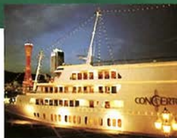
サンデッキで「丹波篠山物産展」を開催

ミュージック・グルメ船「コンチェルト」では、9月～11月「丹波篠山フェア」を開催。ランチクルーズ、ディナークルーズにおいて、丹波篠山産の秋の味覚を使用した広東料理「季節のヌーベルシノワ」、鉄板焼「旬の素材コース」が味わえるほか、