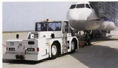
飛行機を誘導するマーシャラー業務