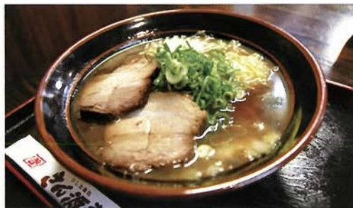
白菜たっぷりでコクだしのきいた「だし醤油らーめん」