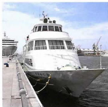
停泊する「おおわだ2」