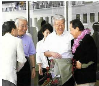
出航セレモニーにて