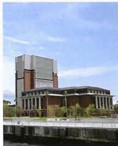
ポートアイランドの大学群を望む