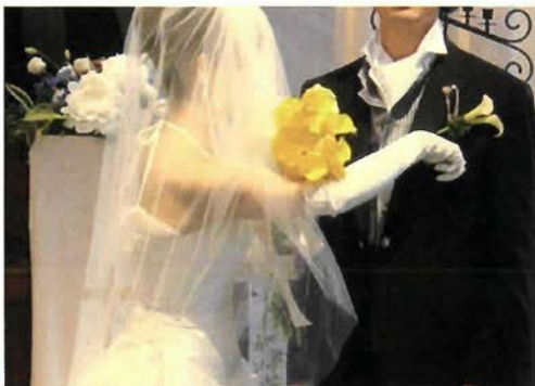
ラ・ヴィータ・ローザの人前結婚式で胸元の称号が、花嫁の手により披露される