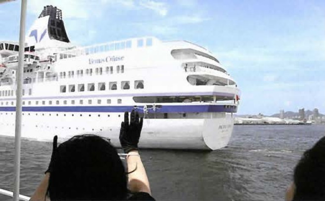
「ばしふいっくびいなす」を見送る

見送った後は神戸港を船上で見学。和田岬の三菱重工業神戸造船所で潜水艇の姿も見えた。ポートアイランドの大学も海から眺め、神戸大橋をくぐり摩耶埠頭あたりまで船は行き、普段見ることのできない景色に参加者は興味深く見入っていた。一方で、爽やかな海風に誘われてか、デッキでは子どもたちがゴキゲンにお歌を歌い、ちよつとした「船旅」を楽しんでいたようだ。