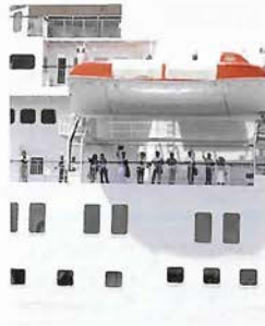
「ばしふいっくびいなす」からも見送りに答えてくれた