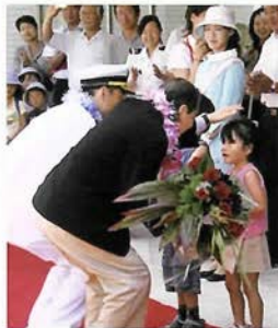
港島幼稚園の園児から 船長と乗客代表に花束