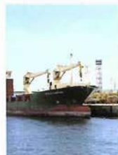
造船所を見ながら