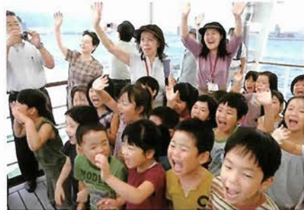
子どもたちの元気な声も