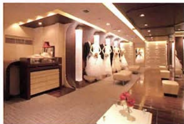
Inoue ウェディングサロンイノウエ 神戸市中央区元町通1-8-4 Tel.078-392-2030