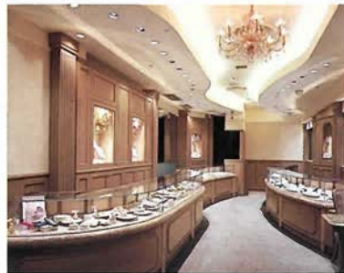
三宮センター街東店 (10:30am~7:30pm) 神戸市中央区三宮町1-8-1-154 サンプラザ1F ☎078-334-0281

そのようなお客様のニーズに 대응べく、タサキでは年に一度のペースで、お客様からのご意見に基づき新作を発表しており、最近では繊細なタイプのデザインが増えてきています。そして、こちらからの提案として、普段はマリッジだけ