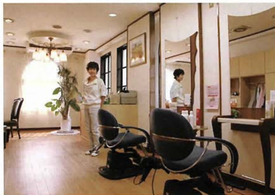
自然光がさしこみ 明るいサロン