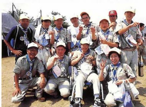
7月には、しあわせの村で 国際障害スカウトキャンプ大会 「日本アグーナリー」が 開催される

日本ボーイスカウト兵庫連盟 神戸市中央区下山手通4-16-3 兵庫県民会館8F TEL.078-333-1781