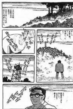
「グリーンゴ」(未完) ビッグコミック ©手塚プロダクション

9:30～17:00 (入館は16:30まで) 水曜休館 一般500円 中高生300円 小学生100円