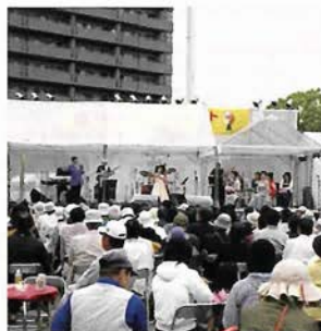
さまざまなジャンルの音楽が集あ

5月10日(土)11日(日) 湊川公園・新開地商店街一帯 (神鉄「湊川」駅、 地下鉄「湊川公園」駅、神戸高速「新開地」駅) 両日とも12:00〜 雨天決行(予定) 入場無料 ■新開地まちづくりNPO ☎078-576-1218