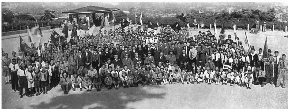
ボーイスカウト兵庫連盟結成式 神戸市諏訪山金星台 1950年4月29日