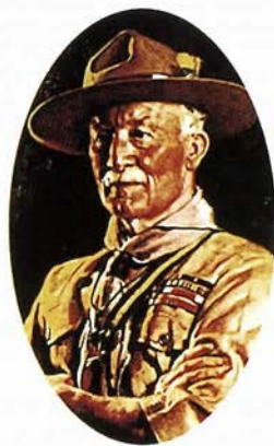
創始者 ベーデン・パウエル (1857年～1941年)