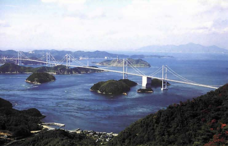
瀬戸田町(芸予諸島・生口島)生まれの平山郁夫画伯が好んで描かれた亀老山(大島)から見た来島海峡