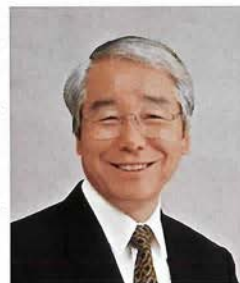
日本ボーイスカウト兵庫連盟長 (兵庫県知事)