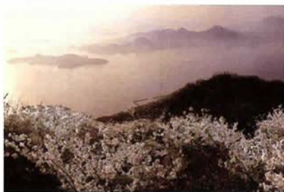
瀬戸の底図(三原から芸予諸島を望む)