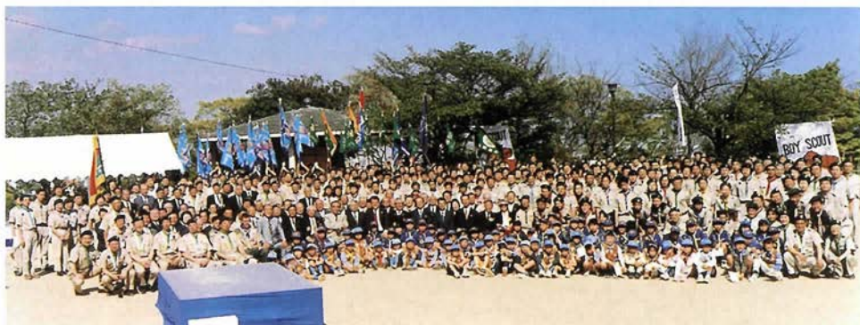
ボーイスカウト兵庫連盟結成50周年記念式典 神戸市諏訪山金星台 2000年4月29日

「平成20年度財団法人ボーイスカウト日本連盟全国大会」のご開催、おめでとうございます。また、7月には「第10回日本アグーナリ」が開催されますが、2つの大きな大会が、ここ神戸で開催されることを、大変喜ばしく思います。 これからの時代、地球規模で考えて行動することのできる人材が必要とされます。そのためには、子どもの頃から、他者や自然とのふれあいを通して、豊かな人間性や社会性を身につけておくことが必要であり、ボーイスカウト活動の果たす役割はますます重要になってくるものと考えております。 未来を担う、自立心や創造力にあふれた心豊かな子どもたちを育てていくため、今後とも、皆さま方のご協力をお願いいたします。