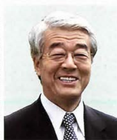
日本ボーイスカウト兵庫連盟顧問 (神戸市長)