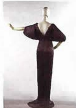
マリア・フォルチュニ 「デルフォス」ドレス 1920年代 共立女子大学蔵

デザイナーのポール・ボワレ(パリ)、マリア・フォルチュニ(ヴェネチア)の仕事に焦点を当て、それまで着用されていたコルセットを放棄した20世紀の衣裳の革新性を探る。ほか、西洋のコルセットや三宅一生ら現代のデザイナーたちの衣裳も。