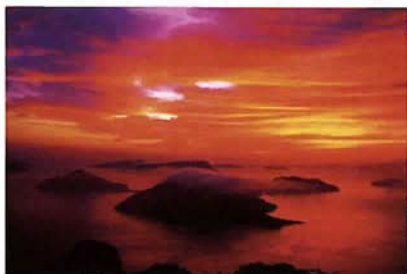
朝焼けの海(荏内半島・紫雲山/しうでやま)