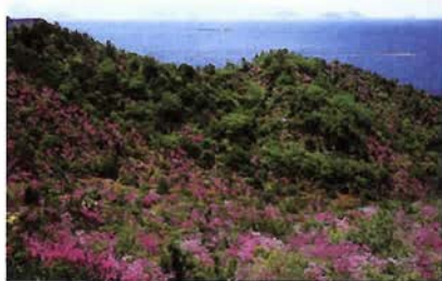
つつじの楽園(直島)