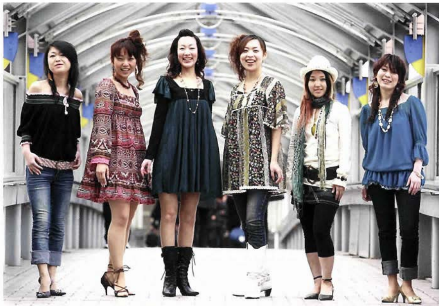
QTHoney (Queen's Tears Honey)