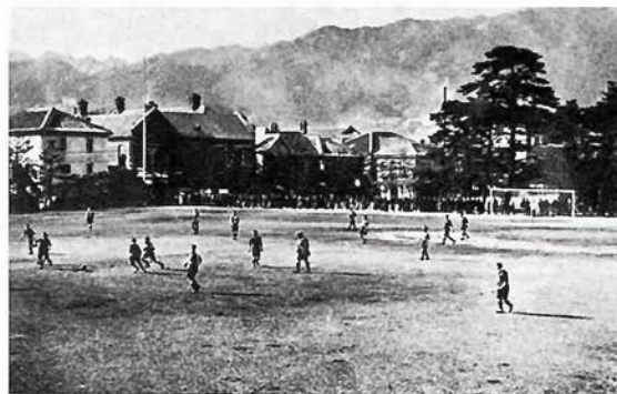
明治41年、在日外人チームで作られた「インターポート・サッカー」の試合の様子