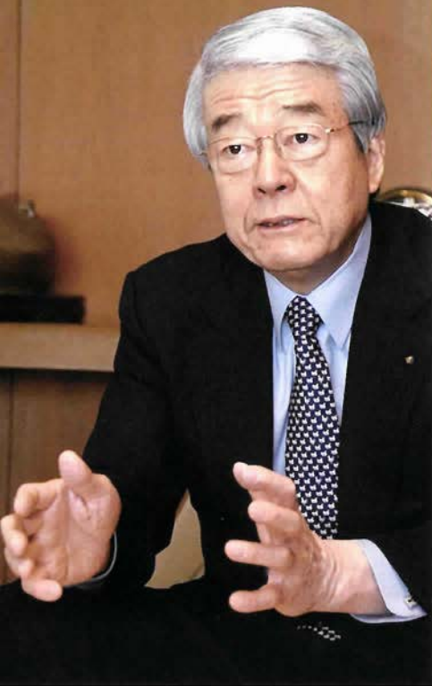
矢田立郎神戸市長