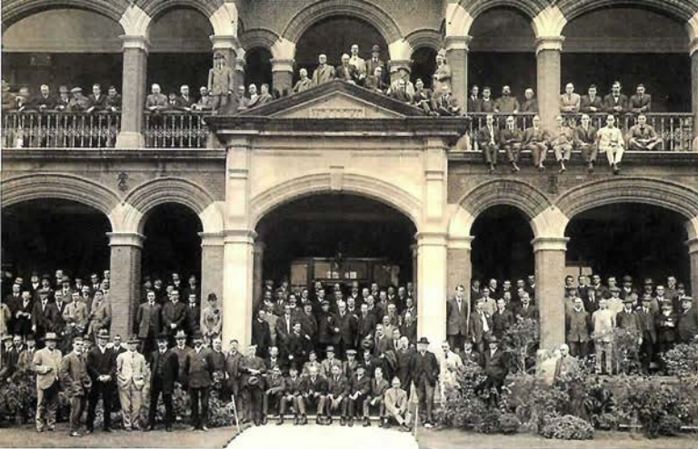
明治45年ごろの「神戸クラブ」。外国人たちに欠かせない社交場となつた

川高校とよく対戦しました。こちらにはヤンキースのマイナーでプレーしていた船会社社員もいて、強かったですよ。ホームベースが北東側、ライト線は少し短かったかな。それでも十分な広さがありました。 十二三歳の頃、オリエンタルホテルにジョー・デイマジオとマリリン・モンローがやつて来たので、友達と見に行きました。朝鮮戦争の時代ですから、たぶん彼らは慰問で韓国に行った行き帰りのついでなのでしょう。オリエンタルホテルは神戸では最高峰の一流ホテル、憧れの場所