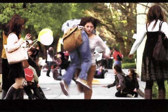
神戸、開学などのキャンパスでも撮影!