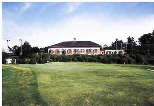
日本最古のゴルフ倶楽部「神戸ゴルフ倶楽部」の理事を務める

私も外資系に勤めていましたが、勤めはじめた頃、ビジネスなんかほっといてもうまくいくし、給料は良いし…貿易ですごく儲かっていたのです。私の勤めていた会社の