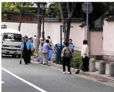
北野町の清掃活動(北野・山本地区を守りそだてる会)