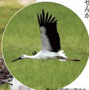
豊かな環境に育まれ、コウノトリが住む