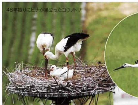
46年振りにヒナが巣立ったコウノトリ

環境大臣会合については環境省が運営しますが、私たちはそれを側面、いいえ、支える、つまり地面から応援をしていくことになりました。県民みんな歓迎し、われわれが地元で協力できる事業は積極的に協力して、「環境立県ひょうご」をPRしていくではありませんか。