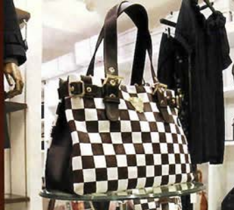
ATAOの ブランドアイデンティティ。 定番市松ライン。 レディ ¥30,450