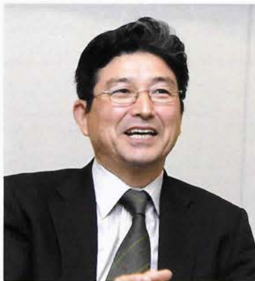
「美緑花部会」部会長