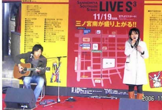
2か月に1回開催される「City Live」

くなかったことで挫折の局面に立たされています。現在は、自主ルールの設定という方針転換を検討中です。