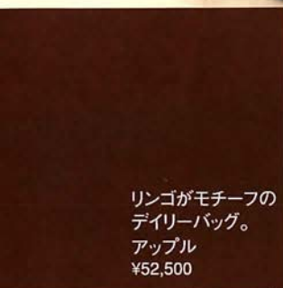
リンゴがモチーフの デイリーバッグ。 アップル ¥52,500