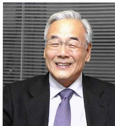
「まちなみ部会」部会長