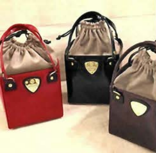
起毛スエード(エスセーズ)と エナメル革のコンビ。 キューブ ¥29,400