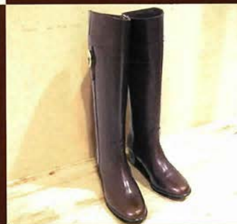
上質なカーフを使用。履き 心地と美しいシルエットが◎ ジョッキーブーツ ¥49,900