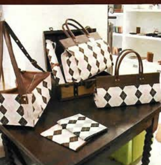
男性もモテるシュガーレスなピンク ARGYLE LINE APOLLO (左)ミルク ¥39,900 (中上)トート ¥34,650 (右)ダックス ¥29,400 (中下)ノートカバー ¥3,990