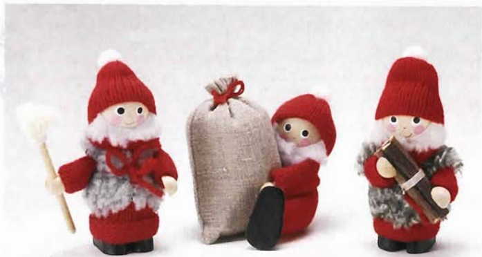
ノルディカ 木製サンタ人形 ほうきとサンタ ¥1,733(左) プレゼントとサンタ ¥1,785(中) 薪とサンタ ¥1,837(右)

11月23日(金・祝)にデンマークショップ 2Fヒュッゲスペースにてタレントの岡 田美里さんをゲストに招き、北欧のクリ スマスについてのトークショーが行われ ました。当日は美味しい紅茶の入れ 方や、テーブルコーディネート、美里流 着こなしコーディネートなどお話をいた だき、来場者は真剣なまなざしでトーク ショーを楽しみました。