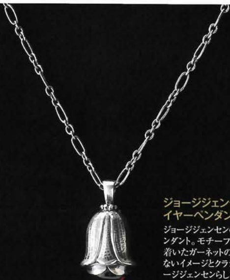
ジョージジェンセン イヤーパーンダント ¥27,300

PLSCE: 神戸市中央区三宮町2-4-1 T E L: 078-327-2645 OPEN: 11時~19時 h t t p: //www.flshop.com