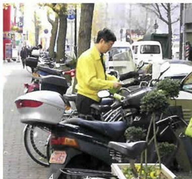
自転車の迷惑駐車をパトロール