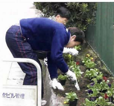
街の緑化活動にも余念がない