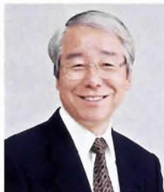
兵庫県知事 井戸 敏三

市民の皆さんとともに大会に参加する人を温かくお迎えし、中国および華僑社会と、文化、経済両面において一層絆を深めて行きたいと思っております。