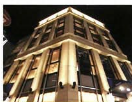
カミネアロード店 (①-3-C)

☎078-331-1695 神戸市中央区三宮町3-1-8 [営] 10:00~19:00 [休] 水曜 http://www.serizawa.co.jp