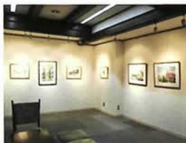
ギャラリーエ サンサカエ (②-2-A)

元町通の「芸術と文化溢れる時間と空間」。絵画、写真、手工芸等の個展、グループ展など、毎週替わりで展覧会が開催されている。元町でショッピングの合間に、ゆっくりとアートに触れられるギャラリー。