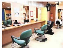
美容室エリザベス (①-3-C)

[営] 10:00~20:00 [休] 水曜 http://www.kutsunomorita.com/