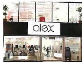
アレックス トアロード店 (①-1-C)

神戸のモダンストリート、トアロードにありアレックスの中でも最も永く神戸っ子に愛されているサロン。一階は、トータルコスメティックショップで、2階はヘアサロン。トアロード店ならではの居心地の良さが人気。