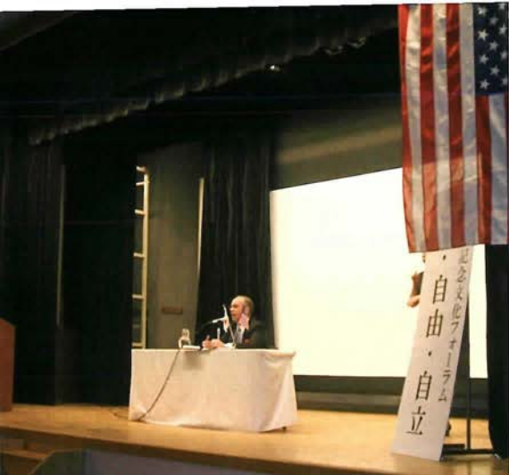
講演するダニエル・ラッセル総領事

る通訳が行なわれ、芸術振興と自然保護を目的としたチャリティーBOXが設置された。