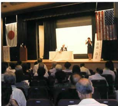
会場には多くの参加者が