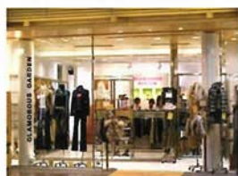
グラマラスガーデン 神戸三宮センター街店 (①-2-B)

☎078-331-5761 神戸市中央区元町通2-7-5 [営] 11:00~18:30 [休] 水曜