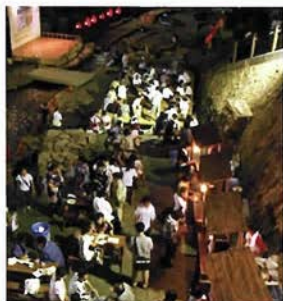
7月28日から約3週間、有馬川が屋台で賑わう

有馬温泉で入浴するだけでなく、背後にある山でハイキングなどを楽しむことによって、運動、森林浴等から総合的な健康づくりができる街づくりを目指そうと、兵庫県が中心となって、森林の整備や遊歩道などを設置した里山づくりを行なっている。その「有馬癒しの森」が完成し、6月3日に「有馬癒しの森開設記念式典」が開かれた。式典が行なわれた有馬小学校講堂では、その後、第2回有馬学講座として講師を招いた講演会が