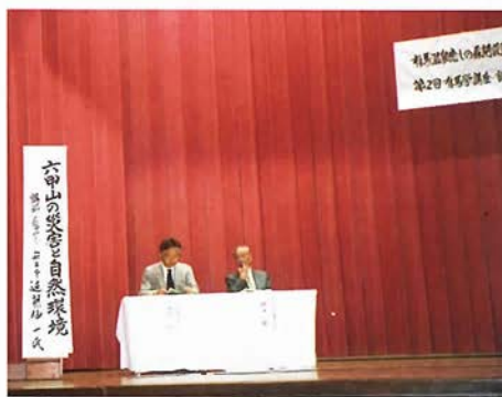
六甲山や里山ウォークについての講演が行われた

有馬癒しの森は、有馬温泉の中心地から歩いて十数十分程度の山の入り口から入り、眺めの良い展望台などを通って、ハイキングが楽しめる。この日は、参加者がハイキングとともに草木染めなどの森の体験を楽しみ、記念植樹も行なわれた。