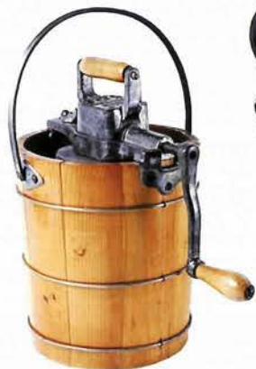
アイスクリーム製造機 ベルギー／1900年代前半 (径220×高さ550mm)

慶応3年（1867）の兵庫開港から140年になります。明治維新のあと文明開化が進み、学校、郵便、病院、鉄道などが次々と開かれ、当時としては珍しい珈琲、ビール、アイスクリームも上陸してきました。その中でもアイスクリームは最高級品で、今でも人々はアイスクリームに深い愛着があります。アイスクリームの歴史は氷果（氷雪を利用したもの）からはじまり、紀元前のローマや中国の皇帝も口にしていました。16世紀以後ヨーロッパで現