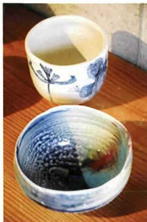
手前の器の赤は、窯変で偶然生まれた辰砂の色

抜けるようなトルコブルーの青、透明感のある織部の緑など釉は鮮やかで、女性らしいセンスが華やかさを演出。ユニークな造形や伸びやかな絵付けは、陶芸のイメージを軽やかに覆す。