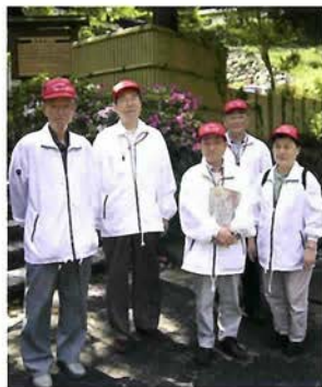
グループわのメンバーのうちの5人の皆さん。 この日は、加古川の小学生を案内

ランテア活動を行なっている。その中に、有馬を専門にガイドしているグループがある。