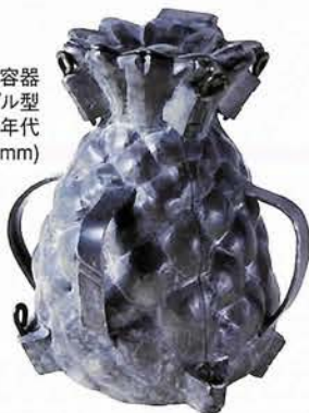
アイスクリーム容器 パイナップル型 ベルギー／1900年代 (150×160×184mm)