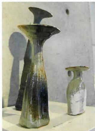
生命体を思わせる造形の花器