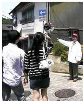
街かで気さくに案内をするメンバー

グループわ（正式名称：特定非営利法人社会還元センターグループわ）は、神戸市シルバーカレッジで学んだ仲間が、知識や経験を生かして社会に還元しようと集まり、さまざまなボ