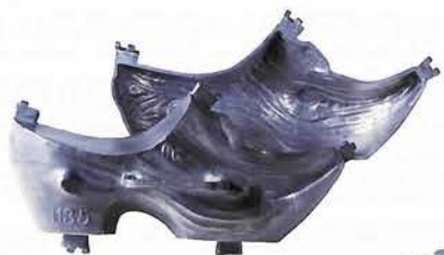
アイスクリーム容器 シンデレラ物語「靴」 ベルギー／1800年代後半 (150×310×110mm)