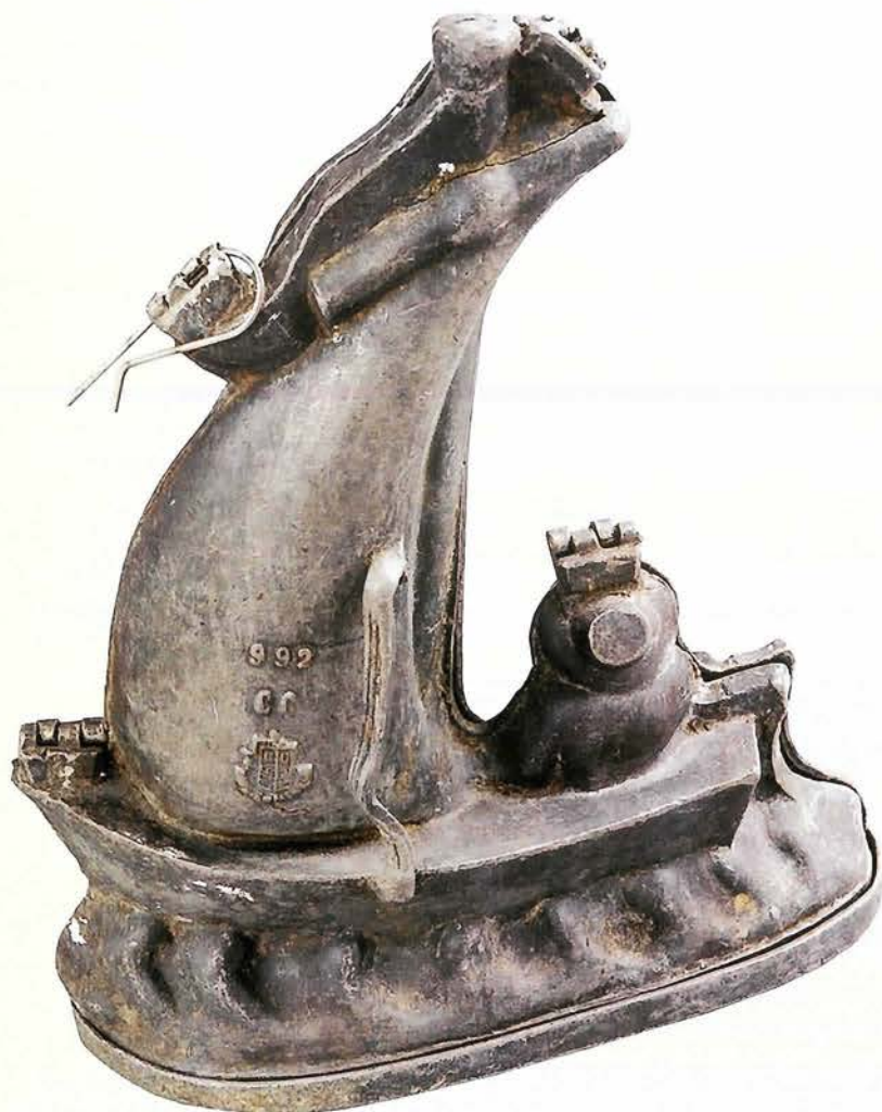
アイスクリーム容器 帆船型(左右開き、底付き) ベルギー／1800年代後半(110×260×305mm) 今回紹介する容器はいずれも宴会用に使われ、 料理の食後切り分けて食しましたが、最近では見られなくなりました。