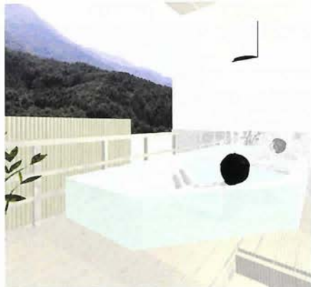
山並みに囲まれたぜいたくな露天風呂付客室(イメージ)