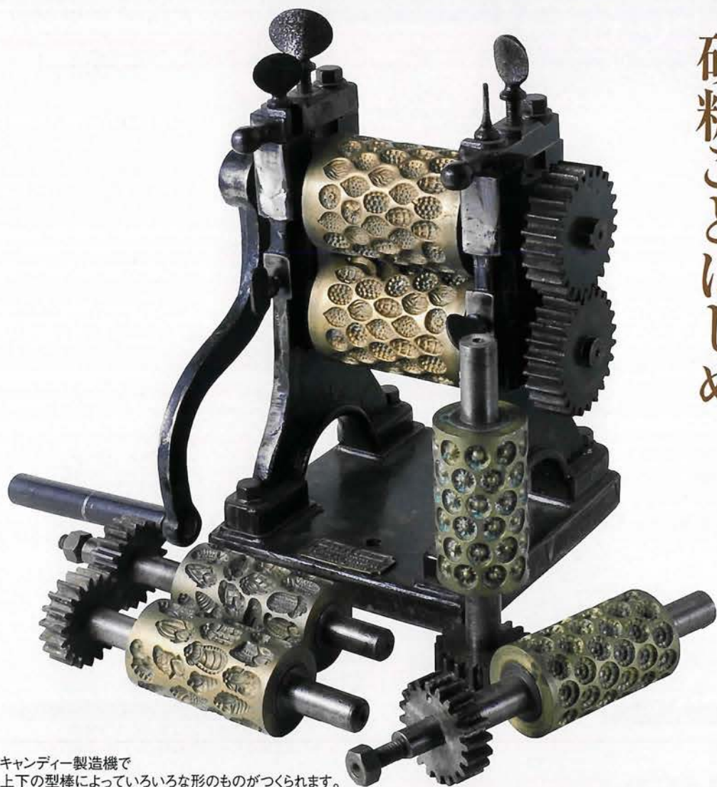
キャンディー製造機で 上下の型棒によっていろいろな形のものがつくれます。 ベルギー／1900年代前期(235×400×390mm)