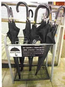
有馬温泉内専用のレンタル傘

有馬温泉内の数か所に「温泉街専用傘」があるのでチェックしよう。これは、有馬内に限りカサが無料レンタルできるもので、使い終わったら、同じ「温泉街専用傘」のマークのあるカサ立てに返却すれば良いというもの。神鉄有馬温泉駅のほか、数か所に設置されている。 有馬のおもてなしの心がこんなところにも現れている。