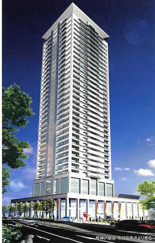
神戸駅前・布引駅交差点より見る