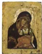
ベニツェン（12世紀～20世紀）

12世紀から20世紀初頭までのロシア皇帝の栄華を今に伝える至宝の中から、工芸品、宝飾品、イコンなど選りすぐりの230点を一堂に展示。モスクワ・クレムリンとロシア工芸の歴史の全貌を初めて日本で紹介する、大規模な展覧会。