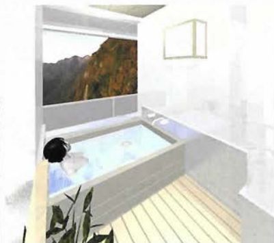
露天風呂付客室(イメージ)