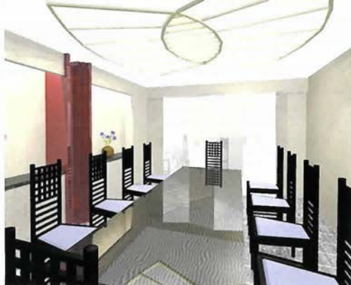
宴会場もリニューアルオープンする(イメージ)

可憐な花にふと心なごむ、まごころのこもったおもてなしが人気のお宿「御幸荘花結び」に、新しい露天風呂付客室が6月にオープンする。客室付の露天風呂なのでもちろん貸切でゆつくりくつろぐことができ、山並み、有馬の自然に包まれながらの入浴は最高。さらに、これまでもあった露天風呂付客室よりも少しお手頃な料金になって登場する。ご家族、お友だちとぜひどうぞ。また、同じくリニューアルされた宴会場は、バリアフリー対応。会議などでも利用できそうだ。