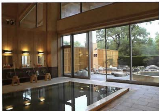
兵衛向陽閣の「三の湯」

とき 6月20日(水) 11:00~12:30 会場 兵衛向陽閣 受付 1階ロビー(10:00~) 会費 8500円(お食事・入浴付) 定員 100名様(定員になり次第締切り)