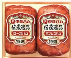
伝承逸品 特選ロースハム 伝承逸品 特選ボンレスハム