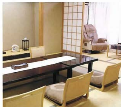
全室にマッサージ器を完備した客室

「御幸荘花結び」は、館内の段差をなくし、館内の移動にはおしゃれな木製車椅子を用意するなどの細やかな心配りで、高齢者にやさしい「シルバースター」認定旅館となっている。花の名前がついた客室は、全客室にマッサージ機が完備されているの