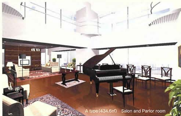
A type (434.6㎡) Salon and Parlor room