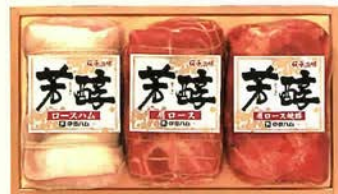
伝承の味 芳醇ロースハム 伝承の味 芳醇肩ロース 伝承の味 芳醇肩ロース焼豚