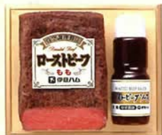
ローストビーフ(もも) ローストビーフソース