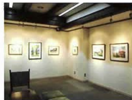
ギャラリエ サンサカエ (②-2-A)

元町通の「芸術と文化溢れる時間と空間」。絵画、写真、手工芸等の個展、グループ展など、毎週替わりで展覧会が開催されている。元町でショッピングの合間に、ゆっくりとアートに触れられるギャラリー。