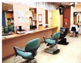
美容室エリザベス (①-3-C)

昭和23年の創業以来、神戸のトップデイトちに愛されてきた。カットから着付まで、ファインなイメージからシックなテストまで幅広いオーダーに確かな技術と安心感で応える、女王の名に相応しい総合美容室。