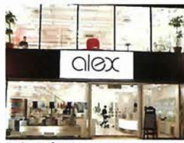
アレックス トアロード店 (①-1-C)

神戸のモダンストリート、トアロードにありアレックスの中でも最も永く神戸っ子に愛されているサロン。一階はトータルコスメティックショップで、2階はヘアサロン。トアロード店ならではの居心地の良さが人気。