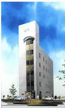
生田筋で親しまれているみどり美粧院本店

■みどり美粧院本店 神戸市中央区北長狭通1-10-5 078-334-1071 10:00~19:00 月曜休 http://www.midori-kobe.com