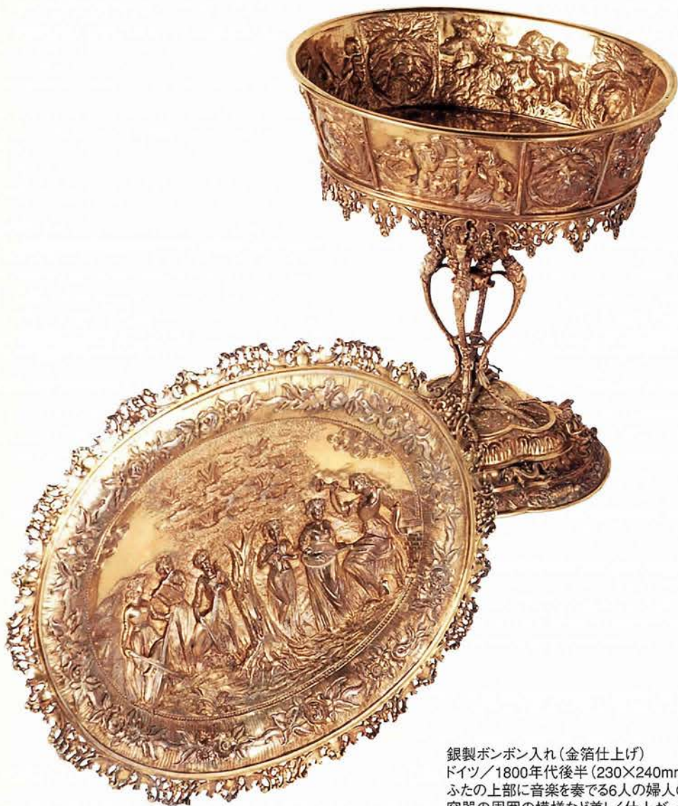
銀製ボンボン入れ(金箔仕上げ) ドイツ/1800年代後半(230×240mm)

ふたの上部に音楽を奏でる6人の婦人の精巧な浮彫りがあり、 容器の周囲の模様など美しく仕上がっています。