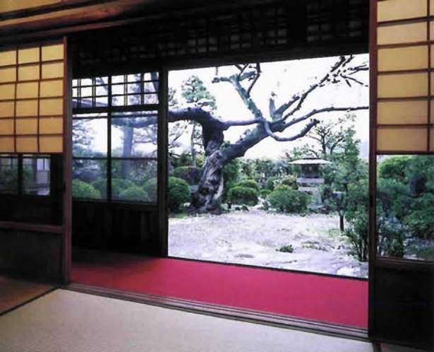
神戸ハンター迎賓館の美しい庭園