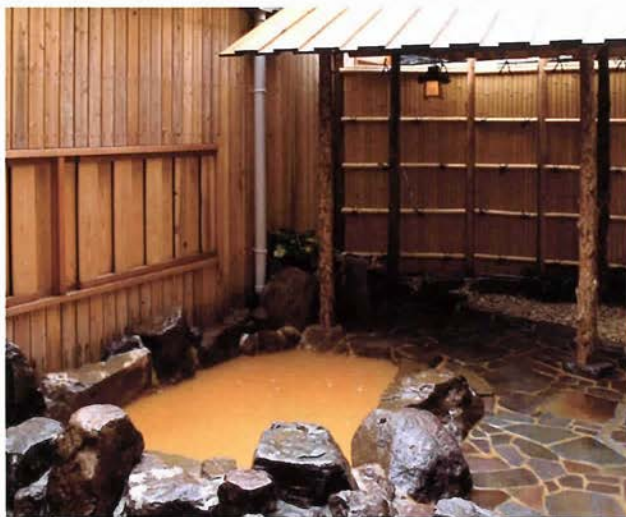
水を一滴も足していない角の坊自慢の金泉

角の坊の自慢のひとつが温泉。有馬ならではの金泉（赤湯）は、一滴も水を足さず、沸かしてもいい。そんな、湧き出たままの濃厚な金泉に浸かると、身体が温まり、疲れがすつととれていく。自慢の金泉の湯を、ぜひ味わってほしい。