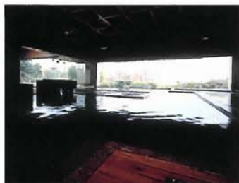
広々とした浴槽の純和風「一の湯」