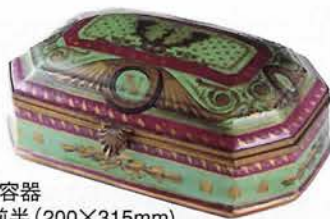
ナポレオン家紋章入り容器 フランス/1800年代前半(200×315mm) 磁器で有名なフランス製ボンボンやチョコレート入れて、 華やかな時代を伺い知ることができます。

ボンボンの種類はプラリネボン、キャラメルなど飴型のもの、砂糖の衣をつけたフォンダンもの、洋酒入りのリキュールボンボンなど洋菓子の中でなくてはならないものばかりです。ボンボニールというのはボンボンを入れるために特別に作られた銀製・陶製の小箱。日本の宮中では今でも金平糖を入れたものが慶事の際の贈物に使われていますが、ヨーロッパの影響ではないかと思われます。