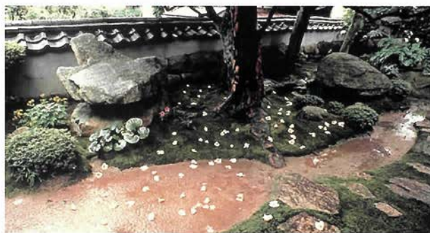
刹那的に散る花も美しい沙羅双樹