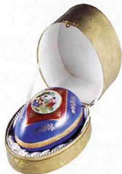
磁器製玉子型のドラジェ入れ フランス・セーブル窯/1800年代 前半(120×145mm) 復活祭に贈物として、貴族の間で 愛用されました。