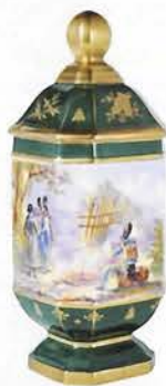
貴族が愛したボンボン入れ フランス/1800年頃(115×300mm) ナポレオンの旅の日の風景で、帽子や鉄 砲などその時代がよく描かれています。