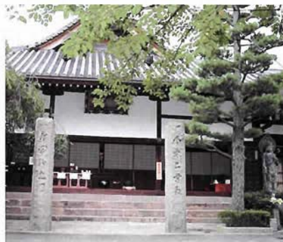
会場となる念仏寺

有馬温泉の中心にある念仏寺の庭に、樹齢250年の沙羅双樹の木がある。1日で散ることから無常の花とよばれているが、その刹那ゆえの美しさは心を打つものがある。