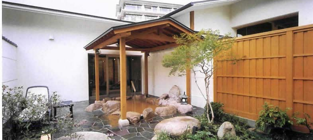
「三の湯」の庭園つき貸切露天風呂(予約制)