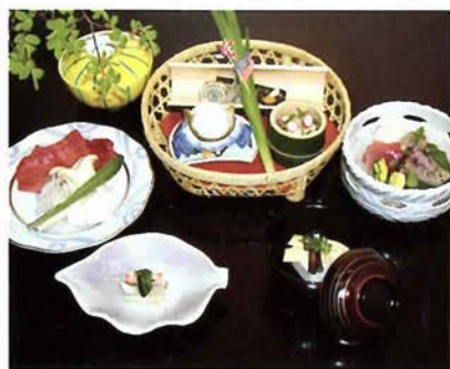
季節を感じるお料理の数々

館内の調度品に、ふとその季節を感じる。そんな情緒ある日本のおもてなしの心があふれたお宿。華美ではないが、美しい伝統の和心に、あたたかく迎えられる雰囲気。ゆっくりお料理が楽しめるようにと、お食事は