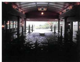
窓からの眺望と柱が調和したローマ風の「二の湯」

昨年にオープンした「三の湯」に続き、それまであった「一の湯」「二の湯」がリニューアル。4月に3つの大浴場の顔が揃った。格子天井が美しい和風の大浴場の「一の湯」は、広々とした浴槽の内湯と、有馬独特の赤湯の露天風呂、寝湯のジェットバス・サウナが。ウォッシュングスペースも広く、照明も控えめでゆつくり入浴することが出来る。「二の湯」は、神殿を思わせる柱と高級感あふれる大理石のローマ風大浴場。窓からは