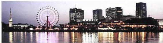
黄昏時、イルミネーションされた幻想的な光景が神戸を水面に浮かび上がる。神戸の夜の人気スポット。