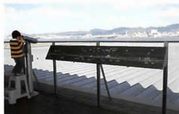
神戸の市街地を望む屋上展望デッキには、パノラマの案内板と望遠鏡を新設。案内板には建物や山などのランドマークがわかりやすいイラストで描かれており、眺望をより興味深く楽しむことができる。

神戸の空の玄関口、神戸空港はビュースポットとしても人気。海の向こうに神戸の街を眺め、万緑の六甲を仰ぐ風景は、山から街を見下ろす眺めとはまたひと味違う風情があり美しい。飛行機の飛び立つ姿もダイナミック。特に明石海峡大橋に日が落ちる夕景、静かに光が降りて夜景は絶景。そんなパノラマを眺めながら食事が楽しめるのは、神戸空港ならではの、おみやげなどのショッピングも楽しい「とっておきの場所」だ。