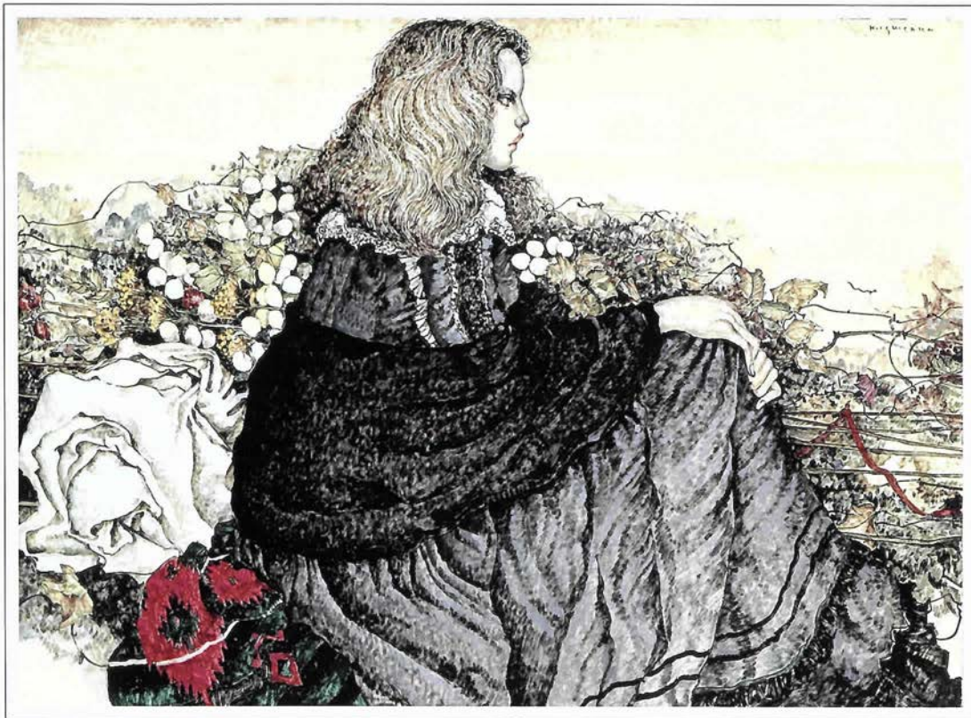
石阪春生「黒いストール〈女のいる風景〉」1991年 40P