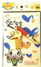
「ピーナス・ブリッジ」までの地図と鍵がセットになった「愛錠」は老祥記のオリジナル商品。(1500円)。