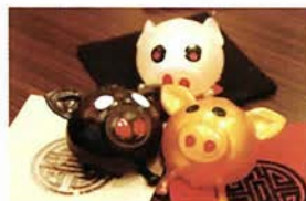
一番人気の商品はビシャブ(350円)。やわらかいゴムの中には水が入っていて、床に投げつけても形がすぐ元通りに。