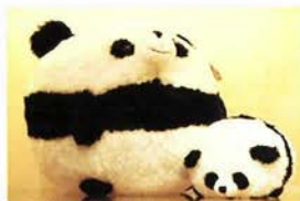
ふわふわパルーンパンダは、L3300円、M1500円、S980円、ミニ460円。