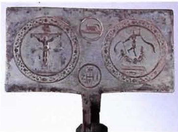
ベルギー／1850年頃 聖体（ホスチア）型／キリスト教（103×210×長さ745mm） 聖餅用のワッフル型には十字架上のキリスト、復活祭、その他教会の紋章SHIの文字入もあります。右はこの型で焼いたホスチア。