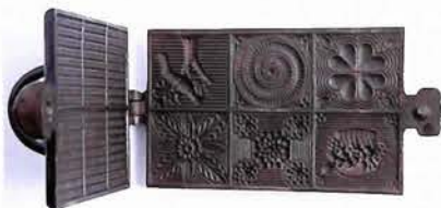
ベルギー／1850年頃 ワッフル型（115×230mm） ワッフル型も少し大きいものになりますといくつもの絵がならび、デザインとしても美しく食卓を飾ります。