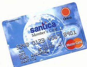
Orico Card/Master Card