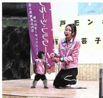
フルーツフラワーパークの人気者・コウベモンキーズのショーも

有馬川の桜並木、善福寺のしだれ桜は、4月20日頃まで毎晩ライトアップされる予定（日没〜22時）。