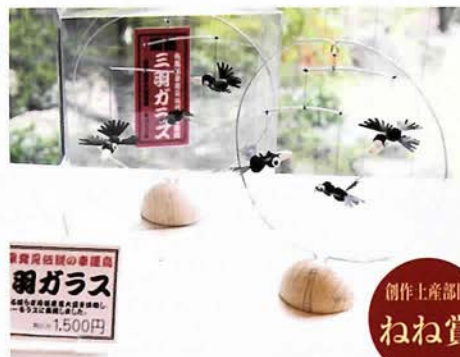
開運三羽ガラス／吉田佳展（吉高屋）

をねり込んだ味噌を巻き込むという手の込んだ一品。上質な肉が、新鮮であっさりした野菜とがうまく融合し、口の中でとろけていくような味わい深い作品となった。