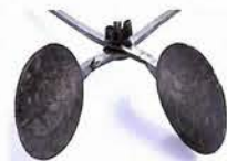
ベルギー／1850年頃 聖体（ホスチア）型（135×135×長さ650mm） 聖体用のワッフルにはさまざまな模様があります。教会によって、地方によって伝説なども図柄に残されています。

ルは、ワッフルのフランス語訳。丸く薄く焼き、クリームなどをサンドします。一般に売られている、楕円形でクリームやジャムなどをはさんだものは、明治中期に日本で販売されたものです。ワッフルの本場、ベルギーでは、丸くてカリッとした食感のリエージュワッフル、四角くてやわらかいブリュッセルワッフルなどさまざまなワッフルがあり、国民的なお菓子として人気があります。