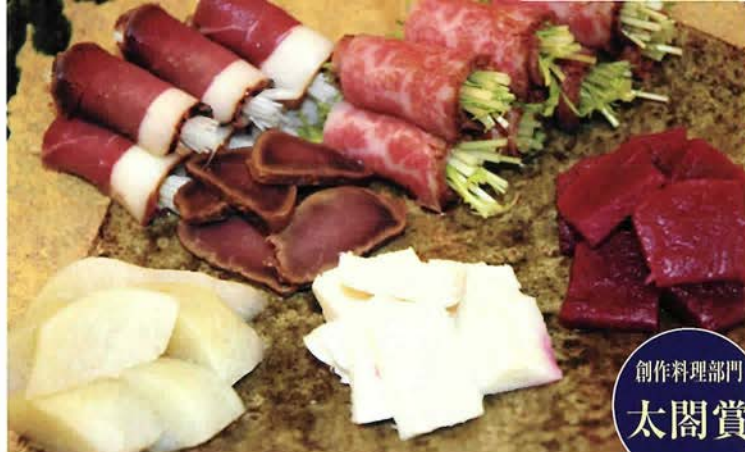
猪肉と丹波牛のロースト地の野菜添へ／大岡寛（銀水荘別館 兆楽）