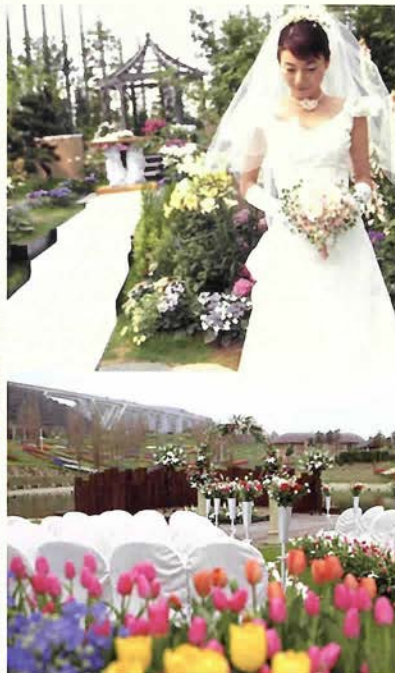
the westin perfect wedding fair ウェスティン パーフェクト ウェディング フェア 2007年3月11日(日)11:00～17:00 入場無料

ウェスティンホテル淡路 〒656-2306 兵庫県淡路市夢舞台2番地 TEL0799-74-1111 FAX0799-74-1100 http://www.westin-awaji.com