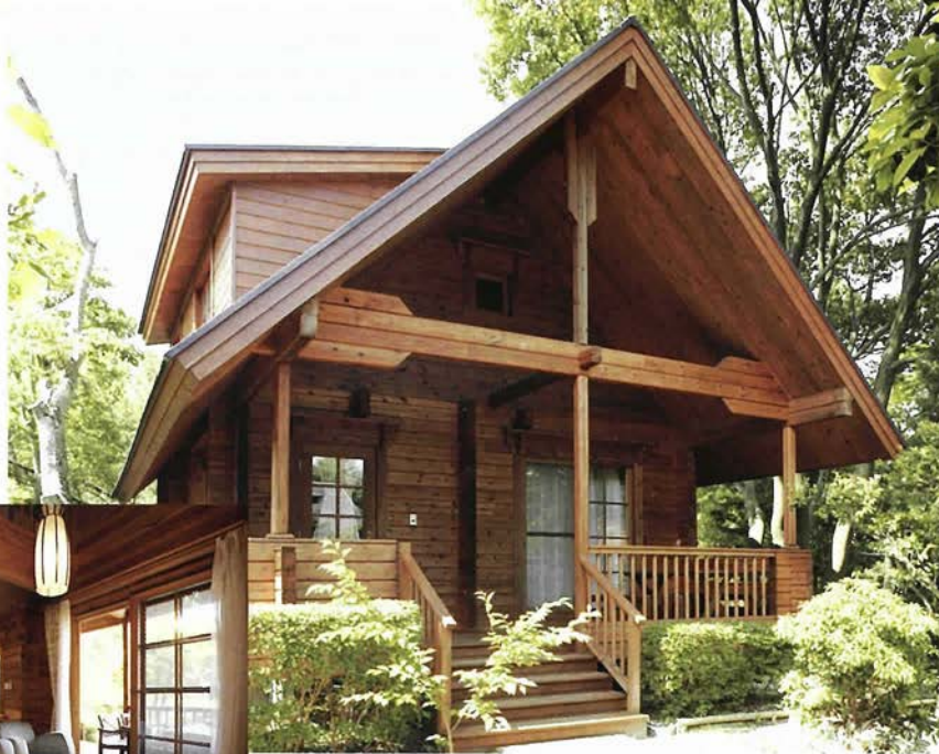
「The Lodge ARIMA RESORT」のファミリータイプロτζジ 充実のリゾートライフが過ごせるロτζジ内部