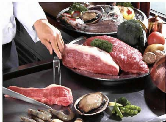
ロッジ併設のレストランでは本格フレンチが楽しめる

こともできる。古泉閣は数少ない元湯の宿で、自家源泉から湧き出すたつぷりのお湯が魅力。野趣あふれる岩風呂、庭園を眺めながらお湯に浸かる展望風呂「八角堂」の2種類のお風呂がある。