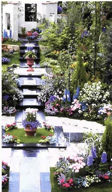
スプリングフラワースhow 2007年2月24日(土)～3月20日(火) イタリアフラワースhow もうひとつのローマの休日 2007年3月21日(水)～5月13日(日) 淡路島夢舞台温室「奇跡の星の植物館」 〒656-2306 兵庫県淡路市夢舞台4番地 TEL0799-74-1200 FAX0799-74-1201 http://www.kisekinohoshi.jp

財団法人公園緑地管理財団 明石海峡公園管理センター 〒656-2307 兵庫県淡路市南鶴崎8-10 TEL0799-72-2000 FAX0799-72-2100 http://www.kokueuakashi.jp