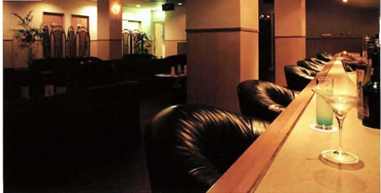
旅館のバーとは思えない本格的なバーラウンジ「Bar慶」

「KOBECOCO」を見たとご宿泊予約されますと「Bar慶」で使えるカクテル券(1,000円相当)お1人様1枚プレゼント!!