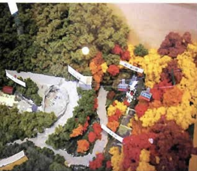
紅葉の鼓ヶ滝公園とかわいらしい六甲・有馬ロープウェー