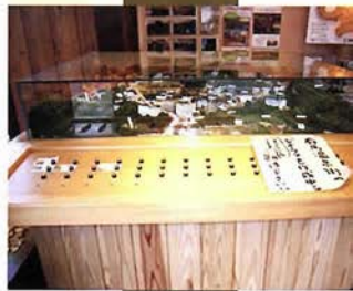
制作中から親しまれていたジオラマ