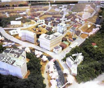
桜並木の有馬川と旅館やみやげもの店が並ぶ有馬中心地