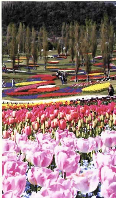
チューリップ アイランド パーティ2007 2007年4月7日(土)～22日(日)

財団法人公園緑地管理財団 明石海峡公園管理センター 〒656-2307 兵庫県淡路市南鶴崎8-10 TEL0799-72-2000 FAX0799-72-2100 http://www.kokueuakashi.jp