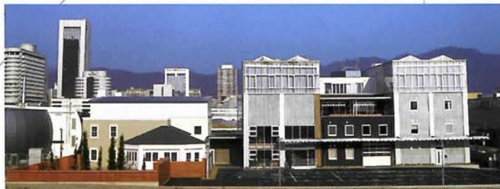
1000坪の敷地内に、9つのスタジオを設備