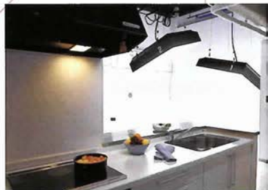
湯気たつお料理もすぐに撮影できる、IHコンロ、冷蔵庫を備えたスタジオ