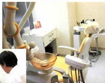
Yoshida T's-Dental Clinic

レントゲンのデジタル化、レーザーの導入、インプラントやホワイトニング等の最新のテクニックにも取り組む。すべて滅菌パックを使用し、衛生面においても細心の注意を払っている。明日の歯科医療を創る会の会員。