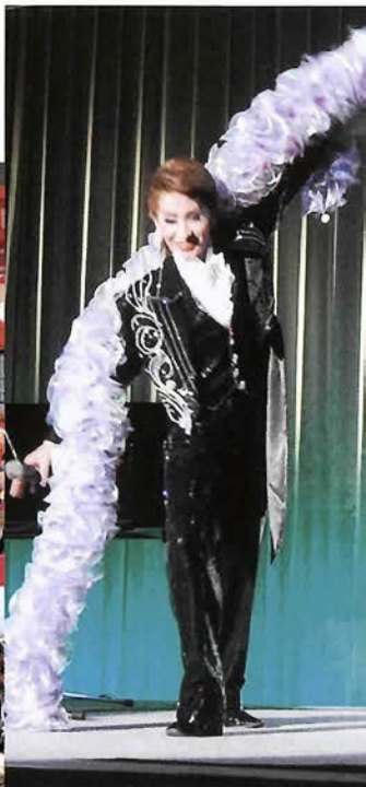
華やかなショータイム

KOBE PR SONG (財)神戸観光コンベンション協会後援 I Love ♥ KOBE/あなたと神戸 好評発売中! ▲ゆうせん放送に登場中!