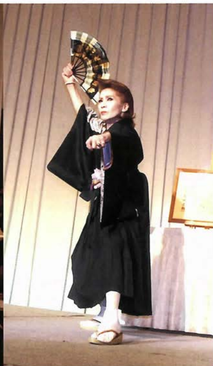
りりしい風さんの祝舞

「神戸市文化活動功労賞受賞パーティーに発起人の皆様方、御世話人の皆様方、ご推薦下さいました皆様方、そして大変お忙しい中を私のためにわざわざご臨席下さいました皆様方のお一人お一人とお出會い、そして熱き御心により、有難くも一生に一度の、大切な人生の一ページを私の心の宝石箱に輝かせて下さいました。只々感謝の気持ちでいっぱいでございます。