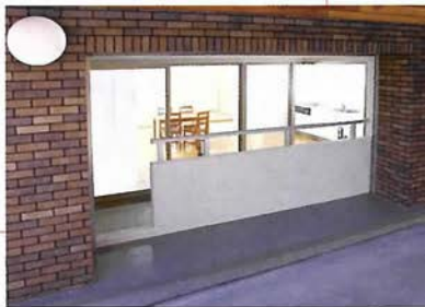
日常シーンが撮りやすいモデルハウス型スタジオには、可動式洗面台やバスルーム、トイレも。