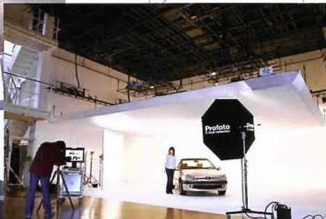
最大のスタジオ・大型白 Horizont スタジオには車両もそのまま乗り入れできる。