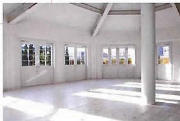
ウッドデッキ、ガーデン、室内にロフトや階段を備えたハウススタジオ。