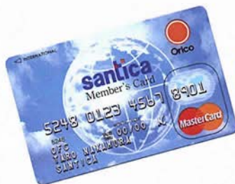
Orico Card/Master Card