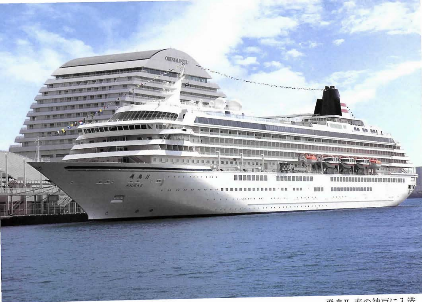
飛鳥II、春の神戸に入港