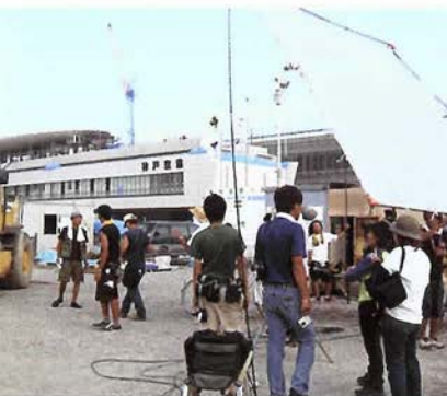
「ありがとう」神戸空港での撮影風景

登録制度」を「神戸フィルムオフィスサポーター制度(Kobe Film Office Supporters-KFOS)」と改称し、制度の充実を図ることにいたしました。 KFOSは「Kフォース」と読みますが、フォース(FORCE)とい