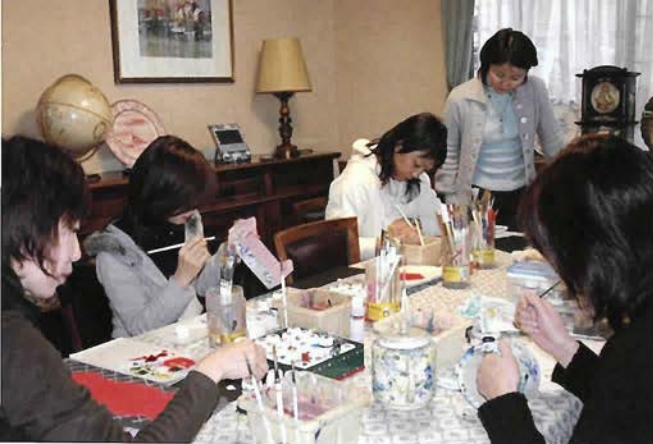
作品づくりに取り組む生徒さん