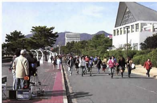
「ウルトラマンメビウス&ウルトラ兄弟」須磨海浜公園でのエキストラ撮影

ことは、神戸フィルムオフィスのホームページ( www.kobefilm.jp )をご覧ください。か、お電話にてお問い合わせください(☎078・30322021)。大勢のみなさん、ご登録をお待ちしています。