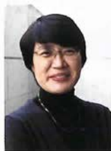
推薦者 潘やすこ GALLERY北野坂