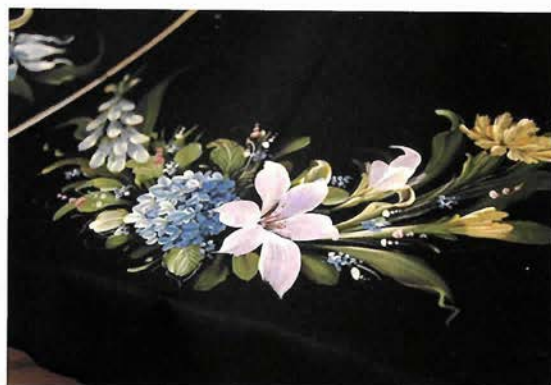
一筆で描かれた美しい花びらや葉