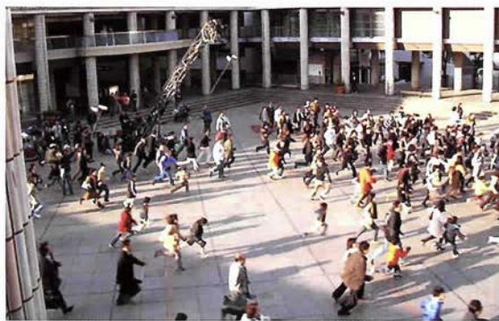
のべ600人のエキストラが参加した「ウルトラマンメビウス&ウルトラ兄弟」

登録制度」を「神戸フィルムオフィスサポーター制度(Kobe Film Office Supporters-KFOS)」と改称し、制度の充実を図ることにいたしました。 KFOSは「Kフォース」と読みますが、フォース(FORCE)とい