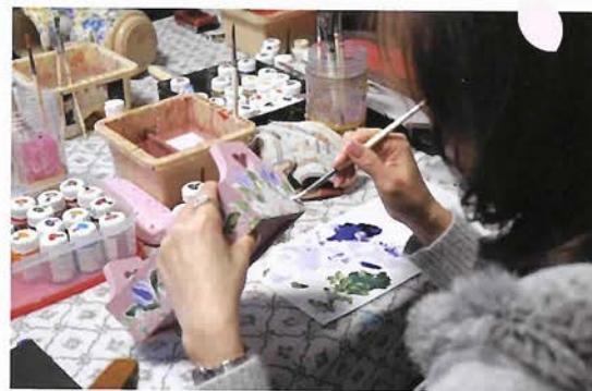
初めてでも意外と簡単なアッセンデルフトフローラルアート