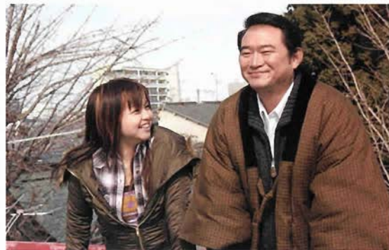
神戸でも撮影が行われた「おばちゃんチップス」(大阪・第七藝術劇場他で公開中)

二〇〇六年は四年連続で上昇を続けてきた邦画興収が史上初めて千億円を突破。さらにシェアも五三・二%ということで、なんと二年ぶりに洋画を上回りました。公開された本数も、邦画四七本、洋画四〇四本と史上最多。日本は今、まさに映画の黄金期です。