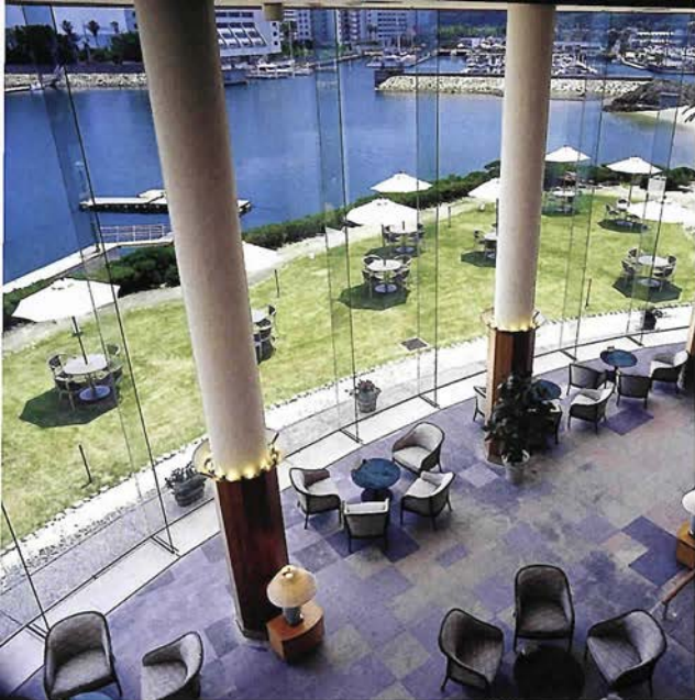
(上) 広い窓から眼前の海岸を望むロビーラウンジ