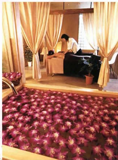
(左下) 三層の湯を二つの温泉が楽しめる「淡路 樹田の湯」