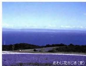
あわじ花さじき(夏)