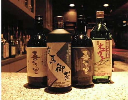
有馬御苑オリジナルラベルの焼酎と、北海道直送の珍しい焼酎