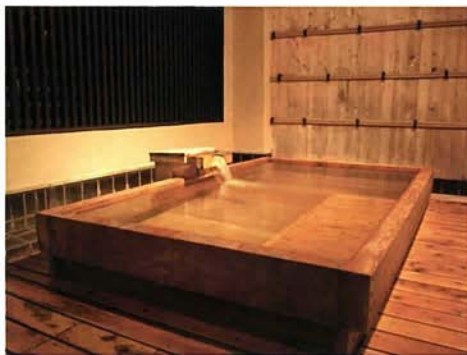
ひのき造りの露天風呂

有馬温泉の玄関口、有馬川沿いにある有馬御苑は、団体も多数収容可能なキャバを持ちながら、グループから家族、カップルまでアットホームなおもてなしが受けられるお宿。温泉は情緒ある岩風呂の金泉の湯、ひのき造りの露天風呂、展望露天風呂などさまざまな浴場で楽しむことができる。