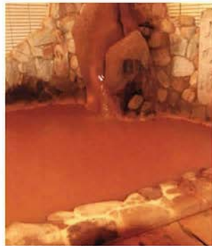
岩風呂の金泉の湯

有馬御苑の隠れた人気が、豊富にそろった焼酎メニュー。麦、芋、黒糖などの人気銘柄、貴重な銘柄がそろう。珍しいのが、北海道から取り寄せたじやがいも、こんぶ、かぼちゃの焼酎。実は有馬御苑の姉妹旅館・グリーンピア大沼が北海道にあり、支配人が研修の際、現地の焼酎に出会い、珍しいので取り寄せることになったのだとか。お客様の人気も上々。この銘柄は館内のラウンジでどうぞ。また、有馬御苑のオリジナルラベルがついた芋焼酎「新八」は、おみやげとしても人気。