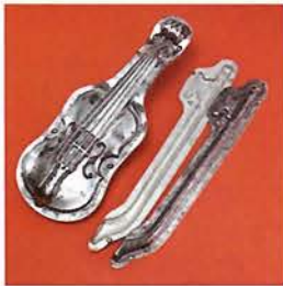
ベルギー／1920年頃 (270×110mm) ヴァイオリン型のチョコレート 型で、弦までついているのは 珍しい。

用のチョココレートボックスが恋人へのプレゼントに人気を集め、聖人バレンタインの伝説とあいまって、バレンタインにチョコレートを贈る習慣の起源になったという説があります。 今やチョココレートは幾十種のボンボンチョココレートのほかに、細工物として人形、動物など型抜きチョココレートも種類が豊富。サンタクロースやウサギの型には夢があり、バレンタインやクリスマスなどさまざまな行事を彩っています。