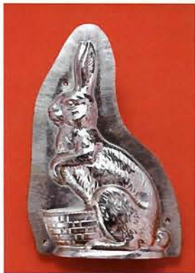
ベルギー／1950年頃 (380×250×60mm) バレンタイン時期になると、 たくさんの兎型のチョコレートが 大、小のリボンを結んで店頭 に並んでいます。

用のチョココレートボックスが恋人へのプレゼントに人気を集め、聖人バレンタインの伝説とあいまって、バレンタインにチョコレートを贈る習慣の起源になったという説があります。 今やチョココレートは幾十種のボンボンチョココレートのほかに、細工物として人形、動物など型抜きチョココレートも種類が豊富。サンタクロースやウサギの型には夢があり、バレンタインやクリスマスなどさまざまな行事を彩っています。