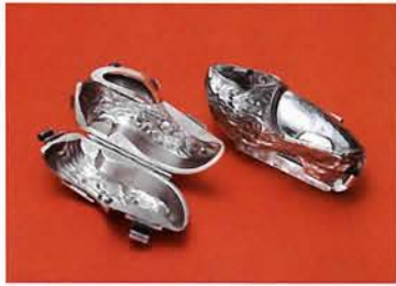
デンマーク／1950年頃 (160×80×80mm) 森の妖精の木靴型。 四つの組合わせになっており 幹の木目模様も美しく仕上がっています。