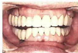
インプラントによって 美しく再生した歯 (写真下は術前)