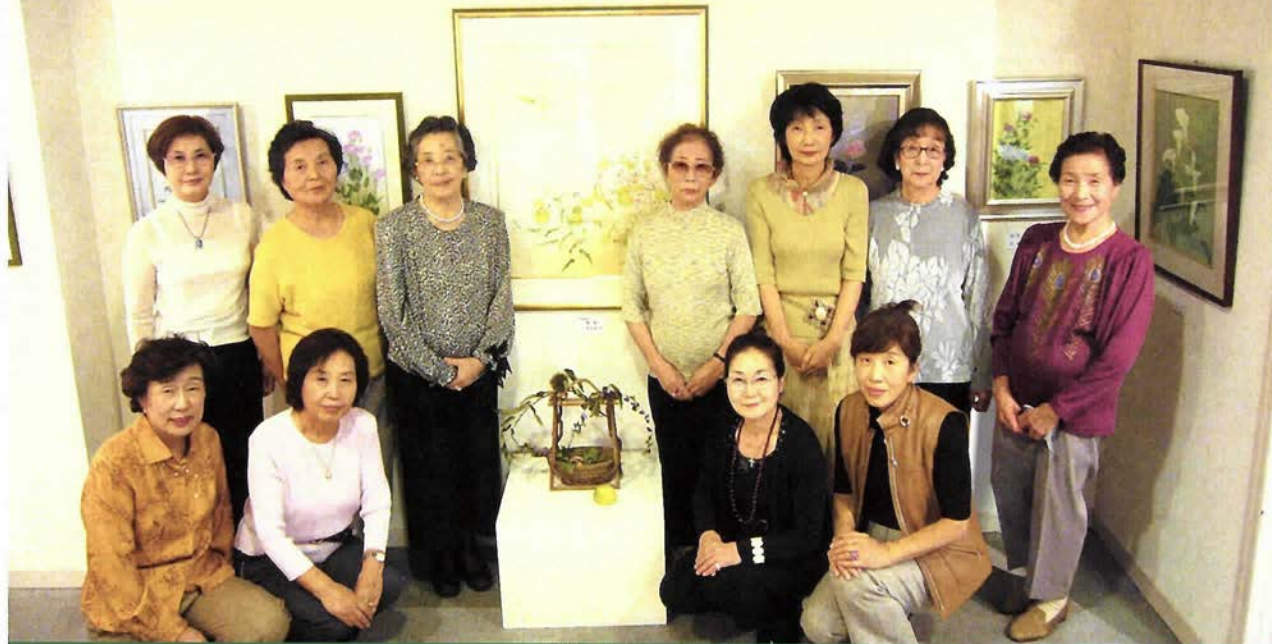
●ある集い●すみれ会