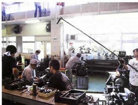
神戸市立工業専門学校での撮影風景

神戸フィルムオフィス 神戸市中央区港島中町6-9-1 神戸国際観光コンベンション協会内 ☎078-6062021 http://www.kobe-film.jp