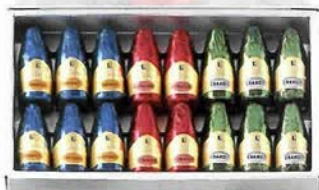
毎年ヴァレンタインデーの時期に発売される 「リカチョコレートボンボン」