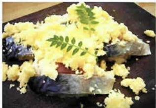
名物の卵の花寿司