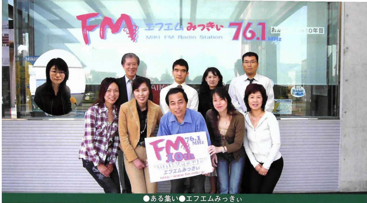
●ある集い●エフエムみつきい