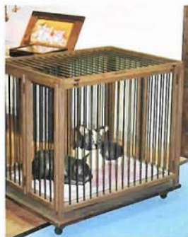
弟さん手作りの折り畳み式犬小屋、後ろにあるのはお母さんによる絵画