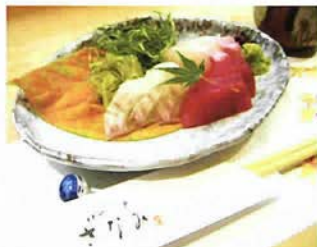
盛り付けがまず目に旨いのだ

昭和42年に今の場所（八幡神社の参道を抜け南に下り、山幹の少し手前）に店を構えている。もう40年になる。