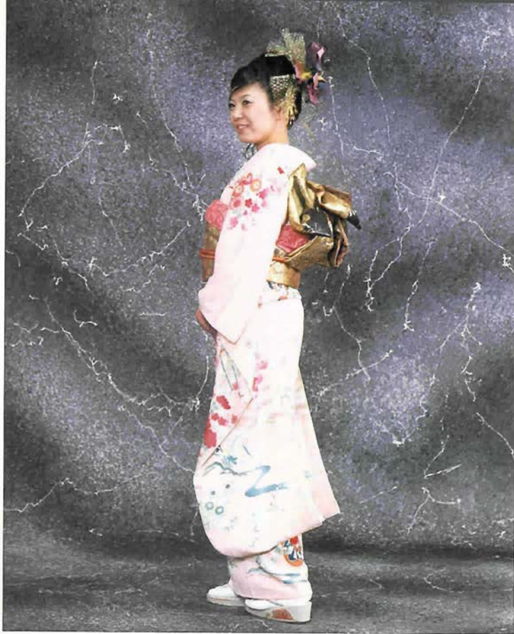
お正月成人式のヘアメイクと着付の予約受付中