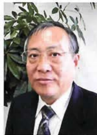
兵庫県環境担当部長 垣内秀敏氏