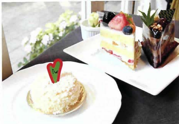
左からダブルフロマージュ(400円)、蜂蜜ビスキュイ(400円)、ショコラ・オ・マロン(450円)。 ダブルフロマージュはフローズンで発送可(5個、または8個セット)