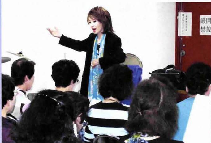
神戸生田文化会館で愛と夢カルチャークラブの歌レッスン(上)と創作舞踊のレッスン(右上・下)