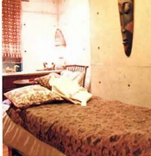
くると肌の上に指をすべらせる一般的なマッサージではなく、指はもちろん、腕のひじから手首までの側面、さらに温めたストーンも組み入れた独自の手法で