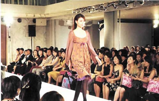
9月8日に開催された神戸コレクションプリュスの模様

にこの「発信」。神戸がファッション都市ということは神戸でしか認識されていないのではいかと。大阪の人は知っているのだろうか？東京の人はもつと知らないですよ。神戸っ子は意識していても、外には情報が届いていないように感じていました。