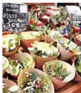
1F Aoyama Flower Market

デリーに花のあるライフスタイルを新鮮なミニアレンジブーケを多数ご用意。ご自分のために、ご家族のために、ちょっとしたプレゼントに...ふらりと立ち寄って秋色のお花を自由にご選んでください。