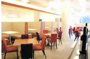
カフェマディピッツェリア 4F Cafe Madu Pizzeria

石釜で焼き上げるピッツアをメインに、ハーブなどヘルシーな素材を多用したイタリアンを提供しています。10月末よりお手頃プライスのランチが仲間入り。パーティーにもびったりな見晴らし抜群のテラス席もあり、ルミナリエ会場にもほど近いことから、ピフォーアアフターディナーの穴場的スポットとしても活用いただけます。