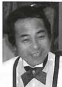
■三条杜夫（さんじょう・もりお） フリーアナウンサー、放送作家。ルポライターの経歴を経て、放送業界へ。経験にもとづく地域活性化講師としての活動も評価されている。著書に「いのち結んで」「室の道七福神めぐり」「そうゆう人たち」など。