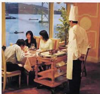
舞子ビラのレストラン「ミラマーレ」からは明石海峡 大橋が一望できる。手前シェフがウルトラ兄弟だ

開催。また、クルーズ船コンチ ェルトでは9月23日にウルト ラマンのイベントを予定。 そして今回は、関西の上映館 で特別に映画のロケ地マップを 全員にプレゼント! なたもぜ ひ「ウルトラマンメビウス&ウ ルトラ兄弟」を映画館でごらん ください。そして、映画を見た あとは、ロケ地マップを片手に 映画を思い出しながら、神戸市 内の撮影場所をめぐってみてく ださいね。