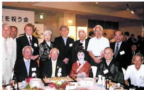
大和松蒔師を囲んで