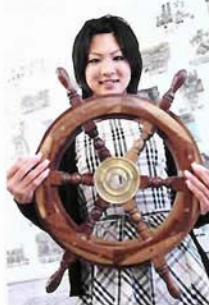
○本物の舵輪を実際に触れます