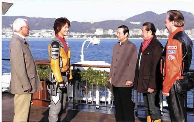
クルーズ船、コンチエルト船上では、ヒビノ・ミライ兄弟からのあたたかい動かしが

ウルトラマン、セブン、ジャック(帰ってきたウルトラマン)、そしてエースのウルトラ兄弟4