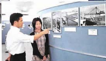
○パネル展示には神戸のルーツが

めざして」のコーナー。活気あふれる昔のメリケン波止場の様子やモダンな街の風景に、「神戸らしさ」の源流を感じます。また、未来に向けて、神戸港湾事務所でおこなっているスーパースタープロジェクトについても学べます。