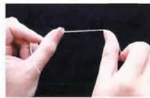
デンタルフロスの持ち方

フロスが引つかかったり、ほつ れたりする場合は、その部分に 虫歯があるかもしれないので要 注意。フロスが歯肉まで届いて も止めずに、さらに歯と歯肉の すき間にまで挿入することがポ イント。 でん太 それは歯肉を傷つけないの？