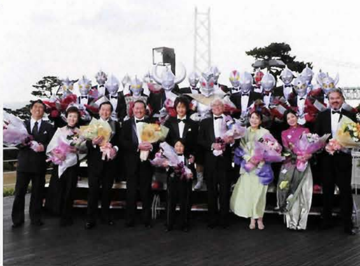
舞子ビラのガーデンテラスでは、こんなサプライズも。 映画のエンディングを見てのお楽しみ!