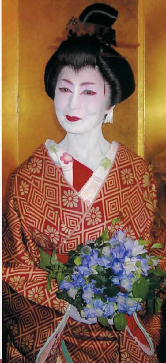
受賞の喜びに輝く大和松蒔師