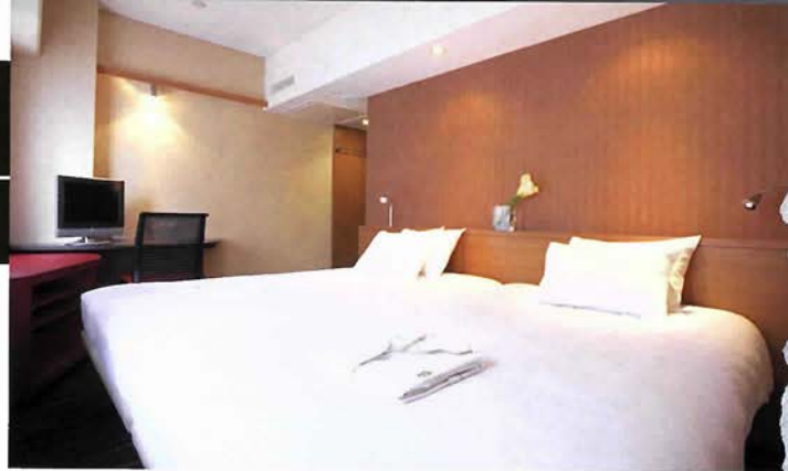
スマートで清潔なスーペリアツイン