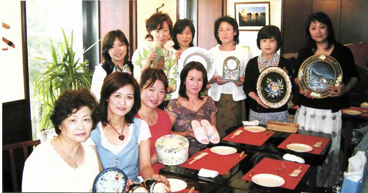
●ある集い●アトリエきつつき