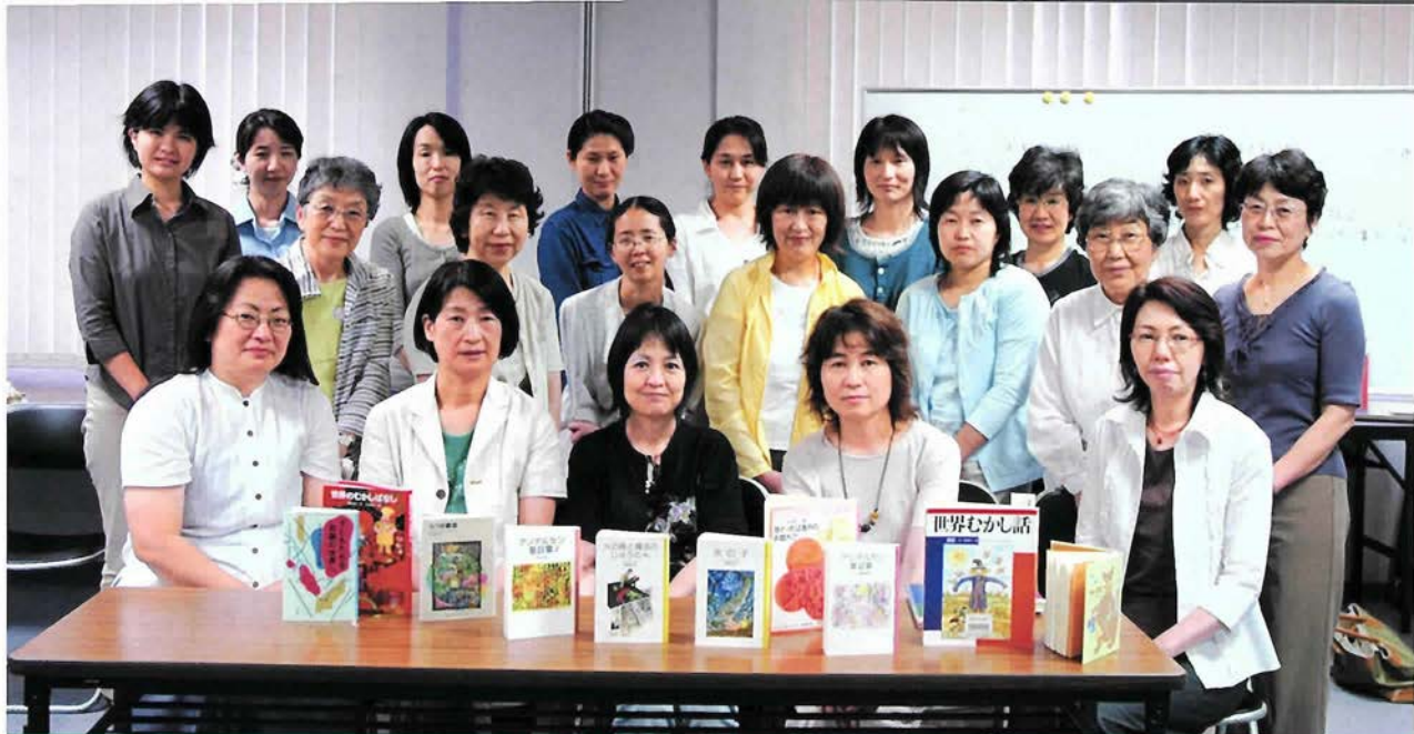
●ある集い●こうべ子ども文庫連絡会