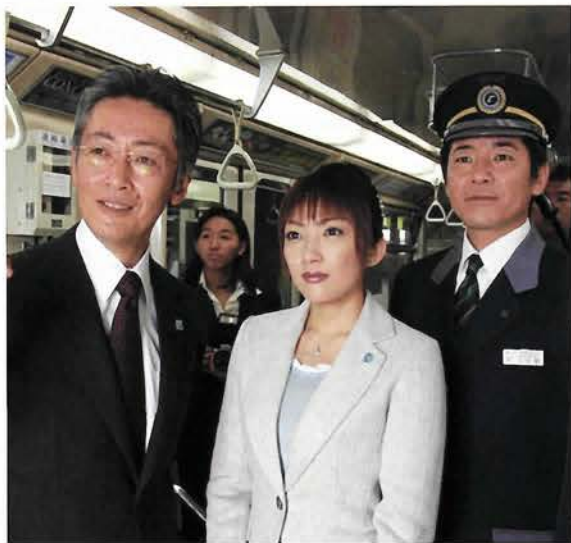
ポートライナーでの貸切撮影。この先に見えるものは何と!