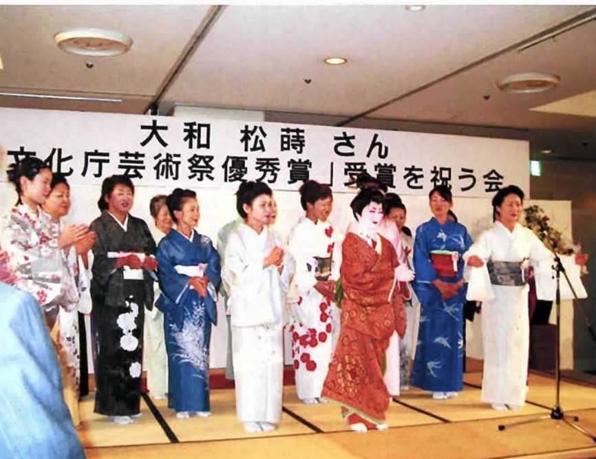
40人のお弟子さんとともに