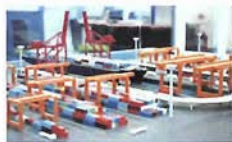
○港の未来はこんな感じ？ 未来のターミナル模型