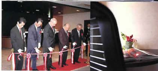
オープニングセレモニーでのテープカット