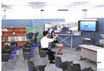
○ビデオでは、神戸港の歴史や物流の現場、震災復興のドキュメンタリーなどを観ることが