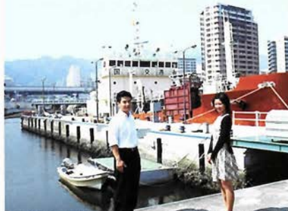
○建物裏手の棧橋へ。この日は海のお掃除屋さん、紀淡丸が停泊。ここから船に乗り港を見学するイベントなども開催するそうです