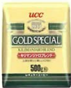
キリマンジャロブレンド

Good Coffee Smile お客様の笑顔のために、コーヒーにできることすべてを。