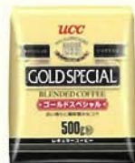
ゴールドスペシャル