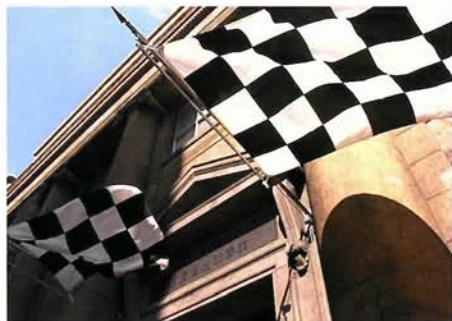
旧居留地38番館