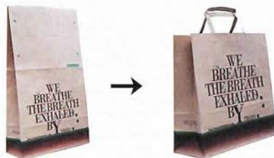
袋の中央をカットすると…手提げバッグに早変わり

配送時のお届け袋も、手持ちペーパーバッグになるタイプに。かさばらない商品を配送する際の外包装のクラフトバッグを中央の点線に沿って切り取れば、中から持ち出があらわれ手頃な大