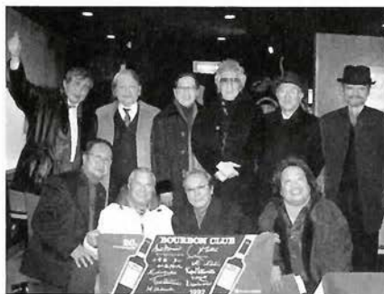
バーボンクラブの旗を囲み30年目の会合

「バーボンクラブ ソング」作詞作曲 新井満 バーボンクラブの B は Beautiful の B バーボンクラブの B は Boys の B ビューティフル ボーイズ クラブ ビューティフル ボーイズ クラブ バーボンクラブの B は Best の B バーボンクラブの B は Balls の B ベスト ベスト ボールズ クラブ ベスト ベスト ボールズ クラブ ベスト ベスト バーボン クラブ