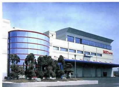
UCC六甲アイランド工場