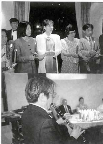
ナースによる賛美歌コーラス