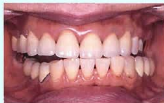
図④ 左に動いた状態