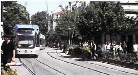
イスタンブール市街を颯爽と走るLRT