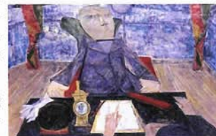
「駅長」1965年 西宮市大谷記念美術館蔵

西村は1970年初渡欧を機にパリに魅せられ、パリをモチーフとした作品を多く残している。とりわけ、メトロの駅やそこに集う人々を題材にした画を多く描き、鮮やかな色彩は、人々の旅愁をかきたてた。本展は、西村没後初めての大規模な回顧展。油彩・水彩・デッサンなど約100点を展示。