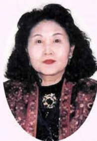
※なるべくあらかじめご予約を

鑑定歴20余年。これまでたくさんの人たちを鑑定してきた豊富な経験に基づいた確かなアドバイスが喜ばれている。リピーターも多く、子供に関する悩みから恋愛、結婚、仕事など親身になって答えてくれる。占術は数霊術、九星気学、推命学、姓名判断、深層真理学研究など。 ●鑑定スケジュール：月曜、木曜、第2・4日曜 11時～19時 ☎090-1242-5890