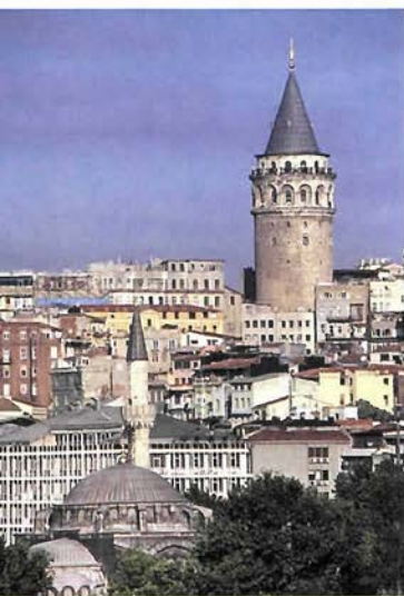
ガラタ塔は新市街のランドマーク