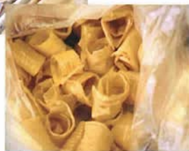
湯葉や干物など名物が多数