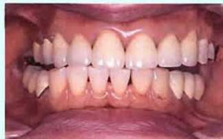
図③ 右に動いた状態