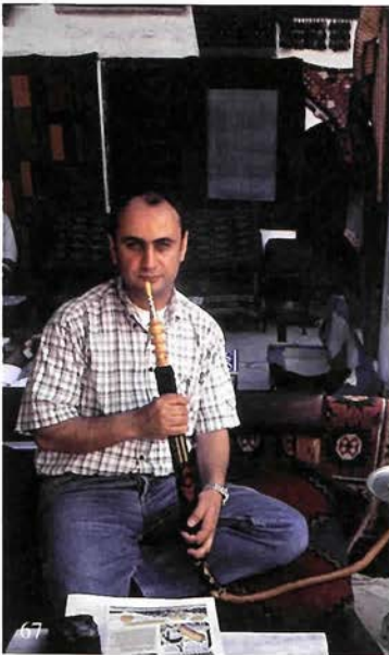
水煙草に耽るトルコ人