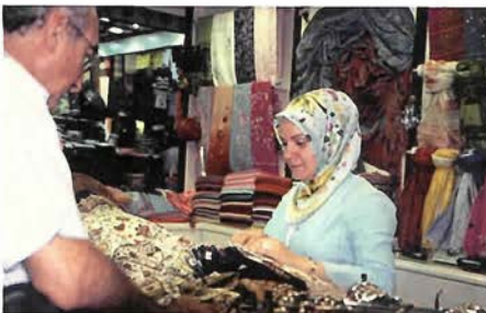
グランドバザールで生地を選ぶトルコ女性

食わぬ顔で颯爽と走っている。このLRTが今年（二〇〇五）三月にガラタ橋を越え新市街に延伸された。これからもっと延伸するのだといふ。旧市街線に乗ってみると狭い道路一杯一杯に線路を敷き詰めて走っている。一九九二年のことだといふからまだ新しい。ここでは、自動車を少々排除しても公共交通優先のヨーロッパの思想を取り入れたのだろう。ガソリン代も日本円にして二百円／リットルとかなり割高。トルコで出来ることが、何故日本に出来ないのか、やはり日本は、公共交通よりも自動車優先の国なのだろうか。政府も個人も頭を切り替える必要があるだろう。