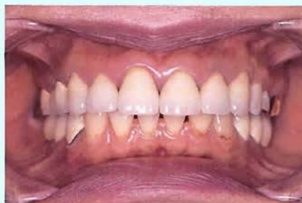
図① 普通にかみ合った状態

合わせの状態」の中の②「スムーズに動ける道案内がある」というのは、このことなんだ。