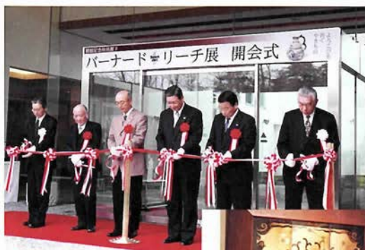
3月18日オープニングテープカットの様子

とき 3月18日～5月28日(日) 10時～19時(金・土は21時) ※入館は30分前まで 月曜休館(祝日の場合は翌日) 場所 兵庫陶芸美術館 篠山市今田町上立杭4 079559733961 JR福知山線相野駅より神姫バスで兵庫陶芸美術館下車 入館料 一般900円・大高生700円・中小生500円