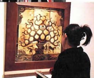
リーチによる陶芸作品など多数展示