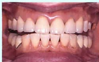
図② 下顎が前に出た状態