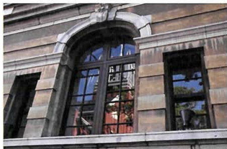
兵庫県公館

建築家・山口洋六の設計により 兵庫県庁舎として建てられた フランス・ルネサンス様式の 瀟洒で重厚な建物は、 明治35年(1902)の建築物で 国の登録有形文化財に登録されている。 戦災と震災を乗り越え 現在も迎賓館、県政資料館として 兵庫県の歩みを見つめている。