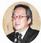
あいさつする 上根社長