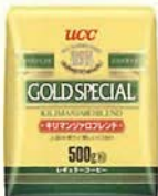
キリマンジャロブレンド