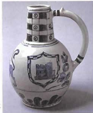
バーナード・リーチ 染付紋章文注瓶 1914年 大原美術館蔵

昨年秋にオープンした兵庫陶芸美術館の開館記念特別展のひとつ、バーナード・リーチ展。リーチもたびたび訪ねた丹波の地に、彼の魂が帰ってきます。民芸運動のリーダー、個人陶芸作家の始祖、そしてすばらしい芸術家であった彼の美の世界と足跡を、名作でたどる展覧会は必見です。