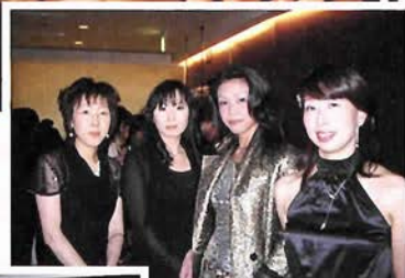
センスよくきまったパーティスタイルのオシャレ上級者がいっぱい!