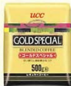
ゴールドスペシャル