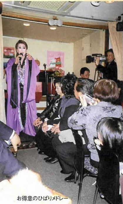
お得意のひばりドレス