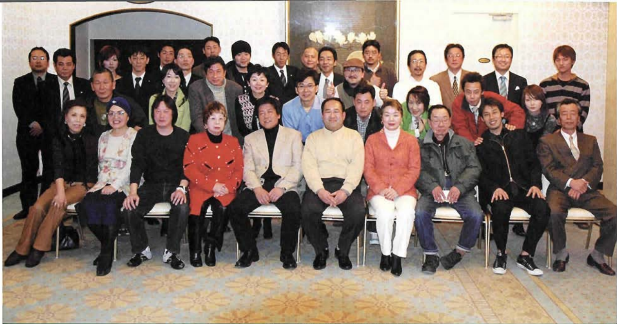
●ある集い●鯉川山手街づくり会

鯉川山手街づくり会は、鯉川筋界限の商店や企業が集い、街の活性化をめざして結成されました。平成13年9月に創設され、現在約80の会員が参加しています。