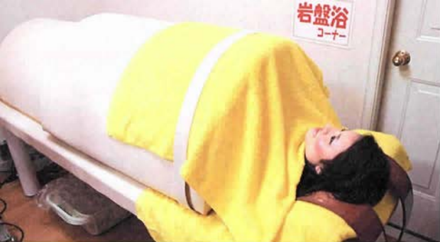
岩盤浴で、身体ボカボカ

ピンクを基調としたやさしいインテリア。カーテンで間仕切りされた6台のベッドには光線治療器が配置され、奥に岩盤浴の設備が。新しい光線治療の癒やしの空間です。