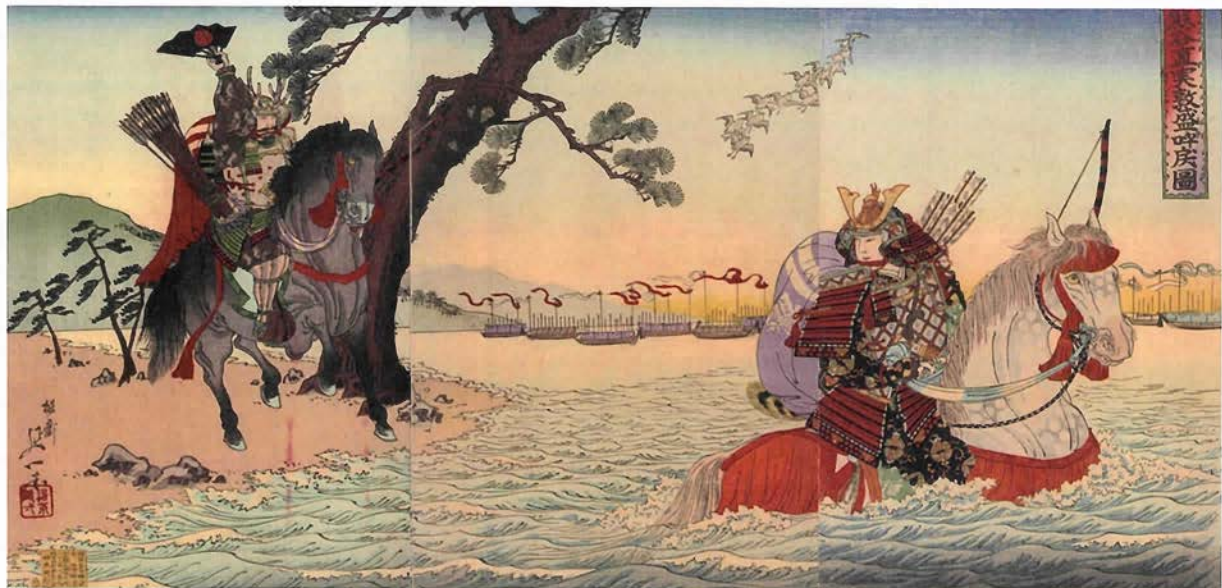
「熊谷直実敦盛ヲ呼戻図」揚斎延一画