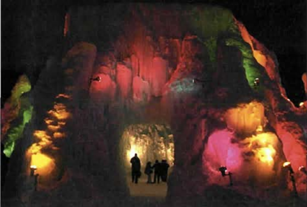
支笏湖の水濤まつり