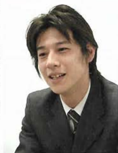
スカイマークエアラインズ 神戸営業所長