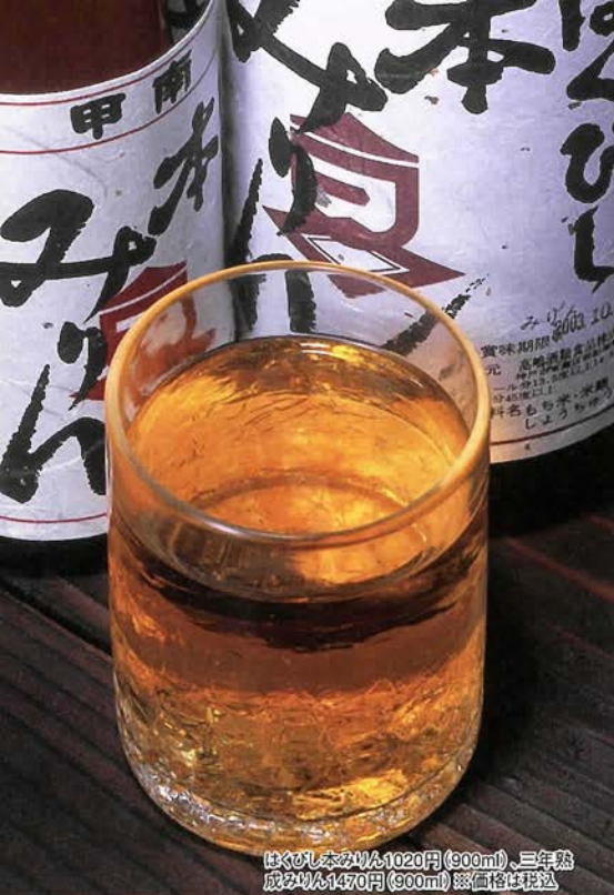
はくびしのみりん1020円(900ml)、三年熟成のみりん1470円(900ml) ※価格は税別

●高嶋酒類食品株式会社 神戸市東灘区御影塚町3-9-16 ☎078-841-0551