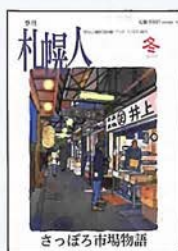
さっぽろ市場物語

時計台など観光地も良いのですが、是非路地裏も歩いてみて下さい。ガイドに載ってない楽しさがあります。そして是非リピーターになってください!