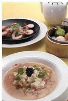
世界の食材をふんだんに使った老香港酒家