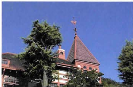
風見鶏の館

神戸のシンボル「風見鶏の館」は、ゲオルグ・デ・ラランデの設計。ドイツ人の貿易商、ゴッドフリート・トーマス氏の邸宅だった。れんがの外壁は北野に現存する異人館の中で唯一のもの。街のシンボルでもある風見鶏。雄鳥は警戒心が強いことから魔除けの意味もあるという。