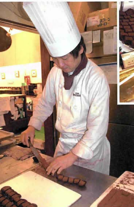
工房内で一粒ずつ作られる生チョココレット