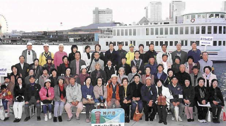
神戸港 2005・11・23 日 9

▶ 神戸港周辺を散策し、ウオッチャーフロントの新しい魅力を探る、ポートウオッチング神戸港を考える会主催が11月23日開催。黄昏ワイナリージンは大好評。