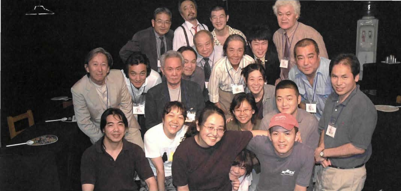
●ある集い●組・村八分