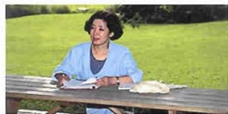
'95ウイスコンシン州クレメンズ教授の庭園にて