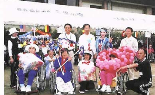
さやかとさやかスタッフで手造りのプレゼントを。