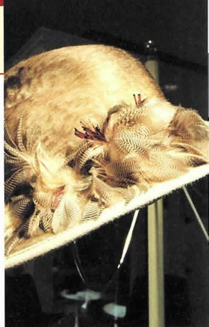
華やかな羽の飾りがアクセント ¥48,300