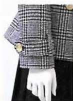
グレンチェックの コート¥36,750 半袖ニット¥10,290 プリーツスカート ¥15,540 バッグ¥14,490など