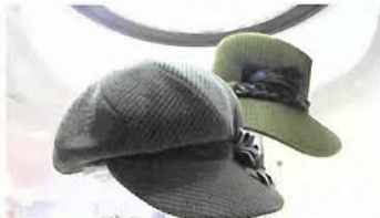
手前:今年流行のカスケット ¥81,900 奥:¥76,650