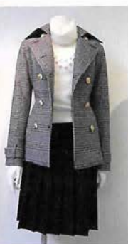
ショートコート¥45,150 マフラー&ボール型 アクセ付きニット¥13,440 リボン付きブーツ¥16,590 スカート¥13,440 バッグ¥12,390