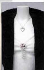
黒のロングコート¥68,250 パールのプローチ付き ニットキャミ¥8,295 スカート¥13,440 バッグ¥14,490など

■SHOP DATA 三宮センター街店 神戸市中央区三宮町1-6-17 078-391-3918