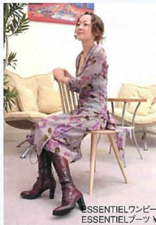
ESSENTIELワンピース ¥46,200 ESSENTIELブーツ ¥55,650

ヨーロッパ、流行最先端の街、ベルギー・アントワープのコンセプトブランド。トレンドを意識した都会的リラックス&ナチュラルスタイル。キュートで大きな花柄がポイントのワンピースは、この秋おすすめのスタイリング。カシュクールタイプのリボンを後ろで結び、足元は編上ブーツ。全体をクラシカルなイメージでまとめています。