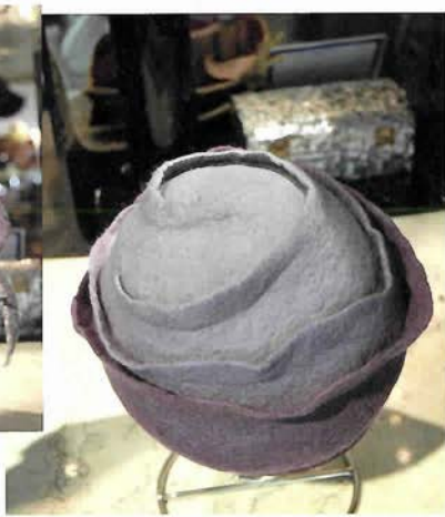
花のような可愛いデザイン ¥33,600