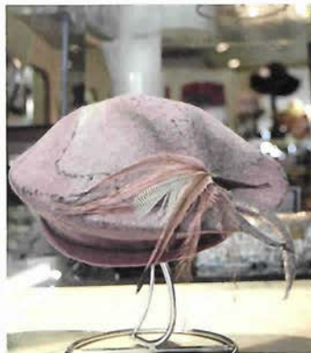
おだやかなパープルは流行色 ¥37,800