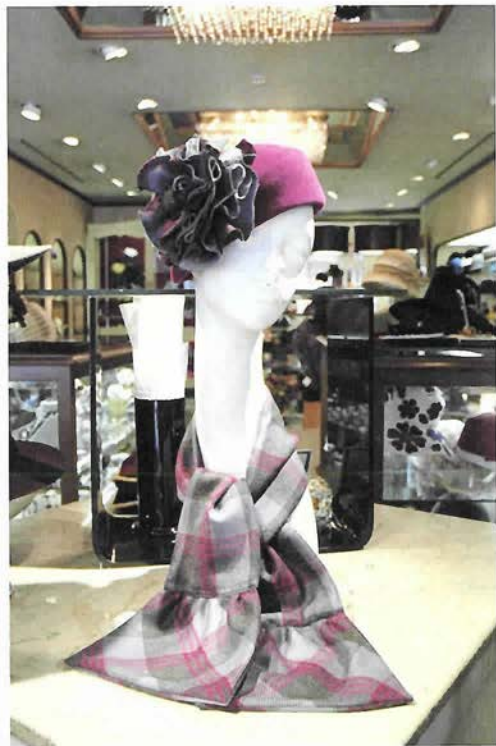
お揃いの柄のマフラーと セットで¥48,300

今年流行のファーやカスケットも、マキシならではのデザインで優美。 流行色のパープルからベーシックカラーまで、幅広いラインナップで店内は華やかな雰囲気。 マキシの帽子で、今日から貴女もおしゃれ上級者に。