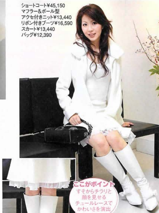
ここがポイント すそからチラリと 顔を見せる チュールレースで かわいさを演出