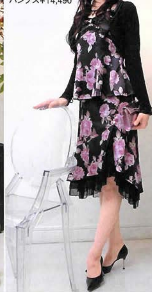
フラワープリント キャミソール¥10,290 スカート¥14,490 ショート丈 ボレロ¥11,550 ネックレス¥4,935 パンプス¥14,490