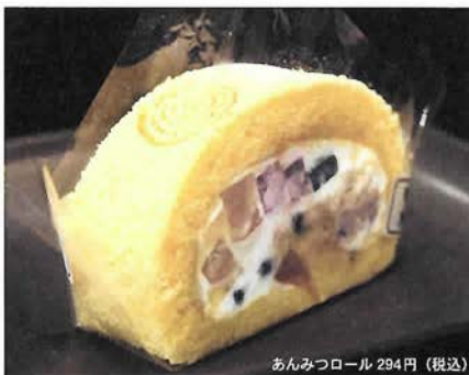
あんみつロール 294円(税込)