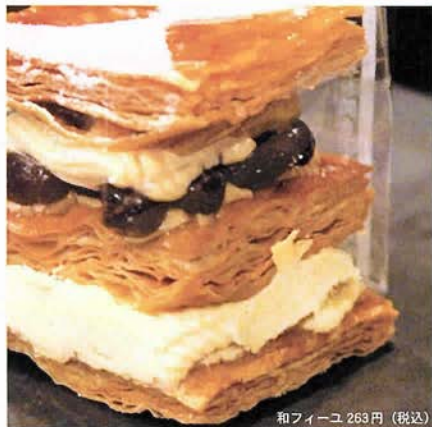
和フィーユ 263円(税込)