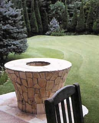
芝の庭のバーベキューコーナー。スパレタン、ブンゲンス等コニファーの向うは修道院…