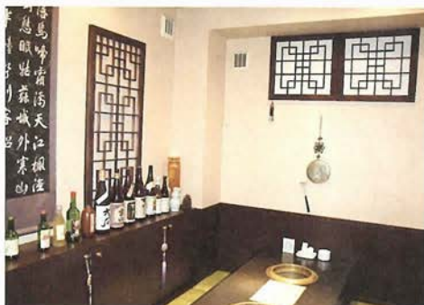
上品な韓国風インテリアの店内