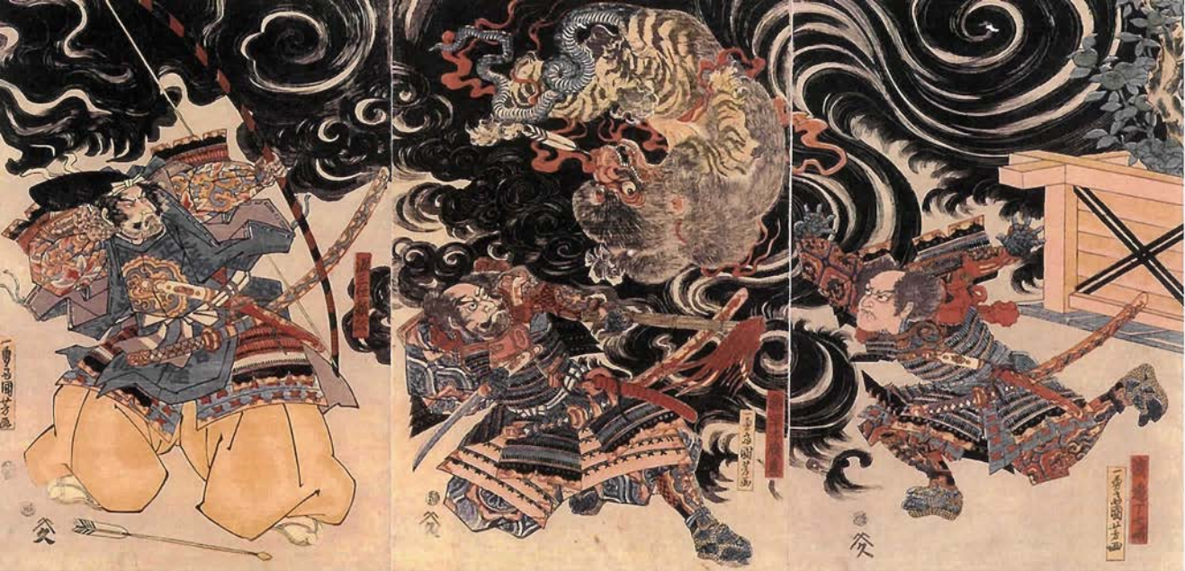
歌川国芳画「落下する鶴」

けた浮絵方式で描いている（右ページの絵）。遠景と近景を極端にして奥行きをだし、立体的に見せかけ、前面が浮いたように見えるため、浮絵と呼ばれた。