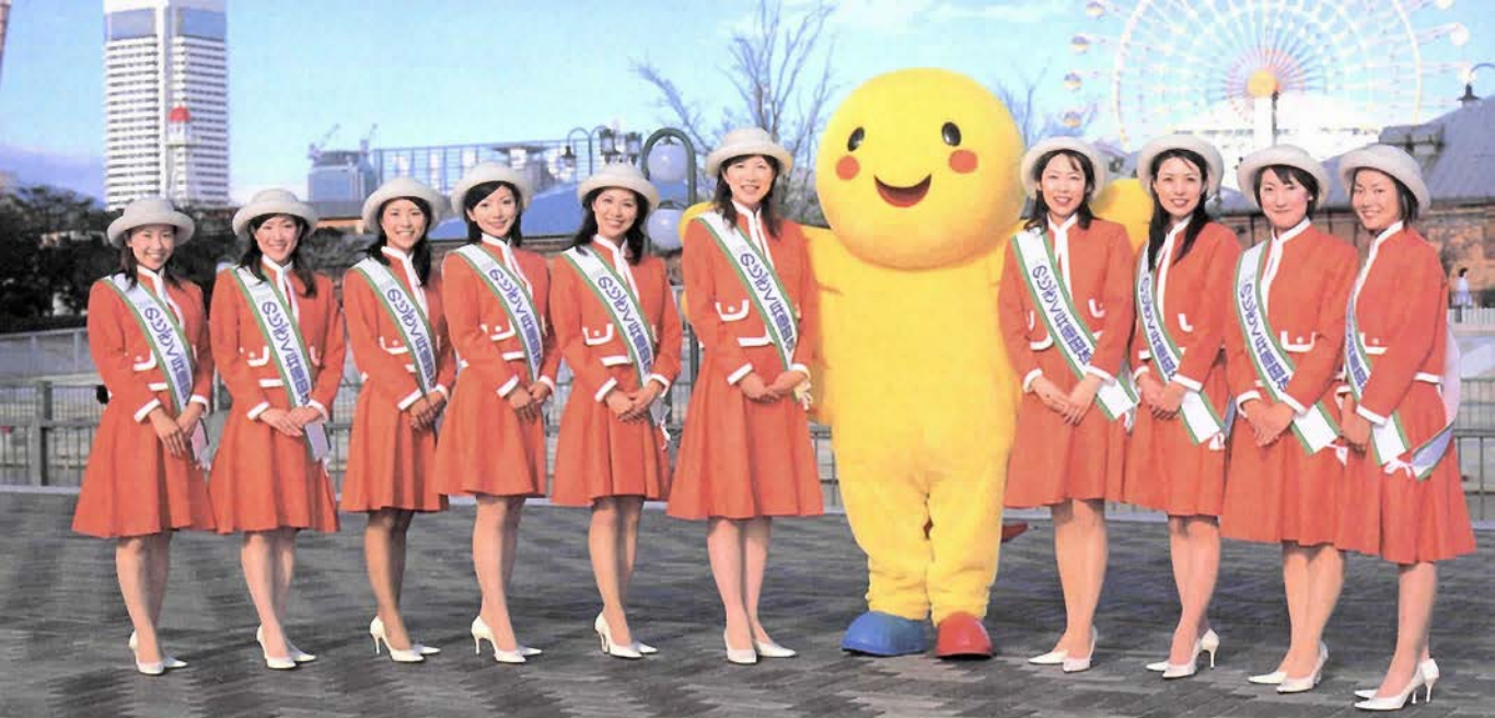
●ある集い●はばタンレディ