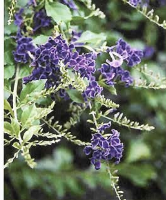
針葉樹の緑の中にむらさき色のデュランタが目をはきます