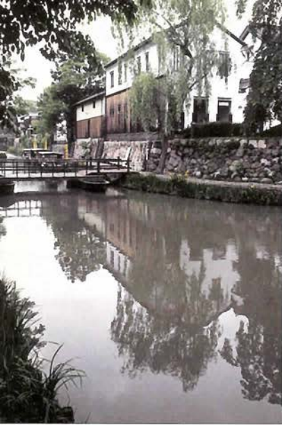
湍端に建つ白壁の土蔵

これを活かして、市では商家の本宅や白壁造りの土蔵群などを修復保全し、一部は県の重要伝統的建造物群保存地区として指定を受け、ま