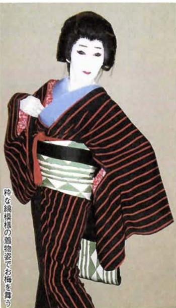
粋な縮模様の簀物姿でお梅を舞う