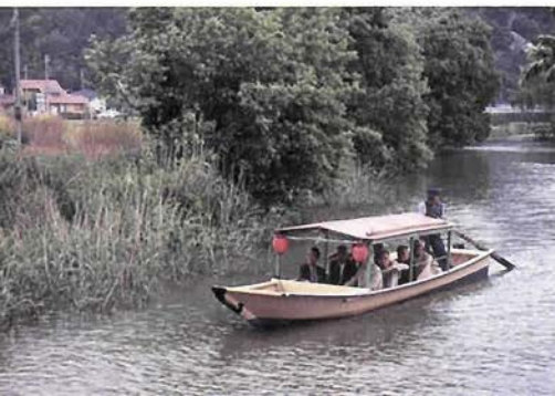
水郷めぐりの舟がゆく

今、この堀は主に小舟で行く水郷めぐりの水路として使われ、琵琶湖八景の中でも「春色・安土八幡の水郷」として取り上げられている。群生する葦原が作り出す豊かな自然の中、一日、この水郷めぐりで楽しんで後、四百年の歴