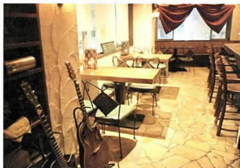
カウンター席とテーブル席、パーティも可能

個人的な状況を書くところ、このお店の取材はアポなしで伺ったのだが、エレベーターを降りてすぐの店の入り口にギターを抱えた男性がひとり座っていた。普通なら非常にう