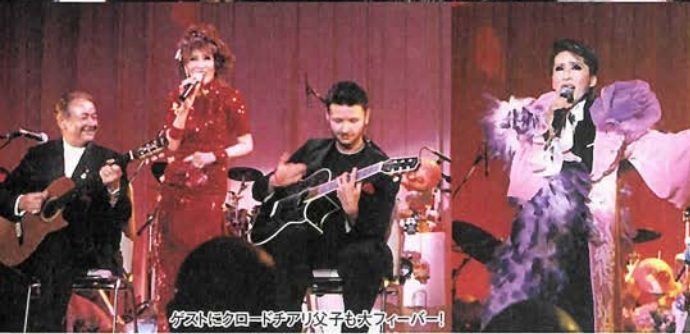
タカラブシのライブパフォーマンス

2005年の夏も、風さやかのかの“愛と夢”は、神戸、そして京都にと散りばめられた。