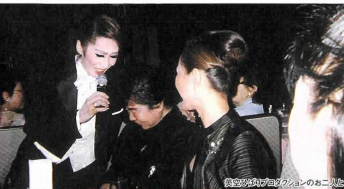
美空ひばりプロダクションのお二人と