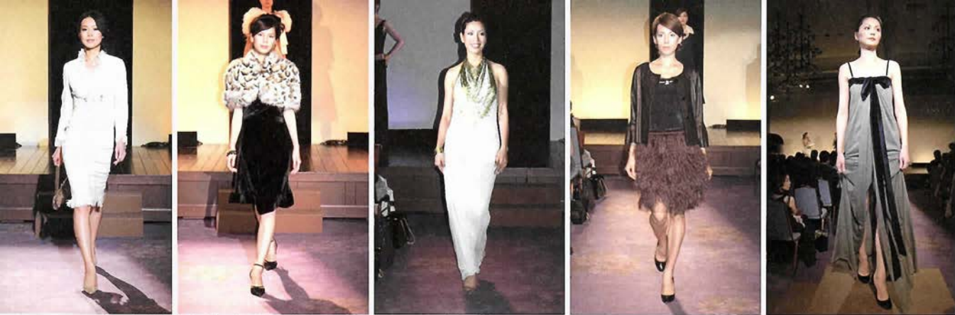
ファーやムートンを使ったゴージャスなアイテムからジャージ素材を使ったドレスまで流行の秋冬ファッションが登場