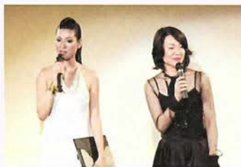
ファッショントークは神戸女性も参考に