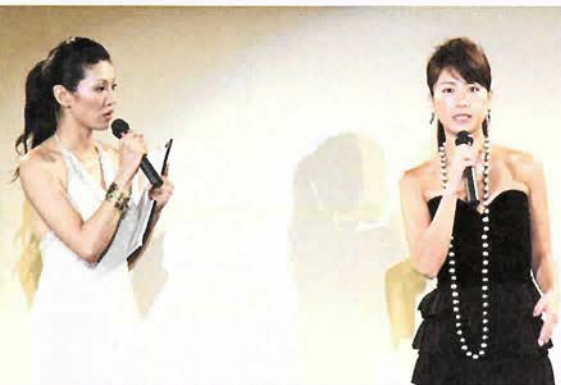
トークショーには女優の高田万由子さんもゲストで登場