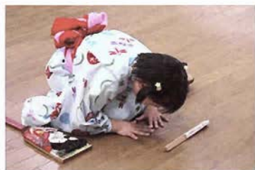
まずはお作法から…