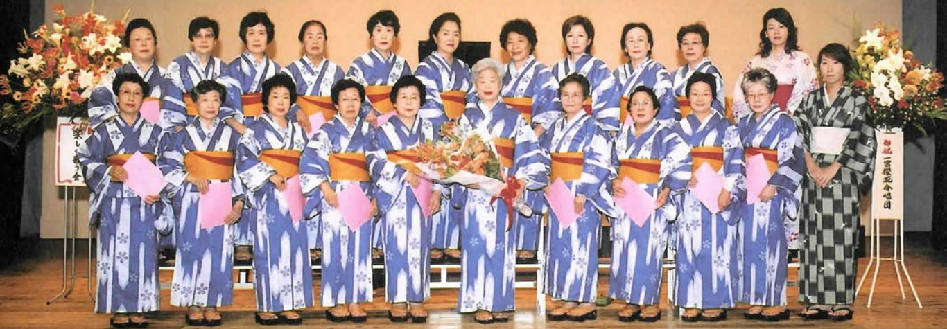
●ある集い●一宮櫻花合唱団