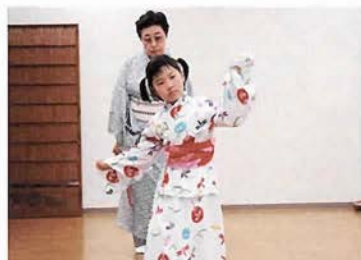
弟子を見守る師の姿が