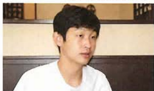
肉や食材にこだわる御主人