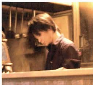
松田さんに写真を頑なに断られたためこのような激写で申し訳ございません

個人的な状況を書くところ、このお店の取材はアポなしで伺ったのだが、エレベーターを降りてすぐの店の入り口にギターを抱えた男性がひとり座っていた。普通なら非常にう