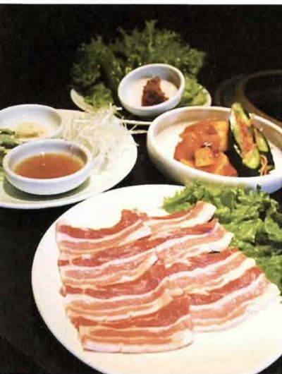
おすすめのサムギョプサル