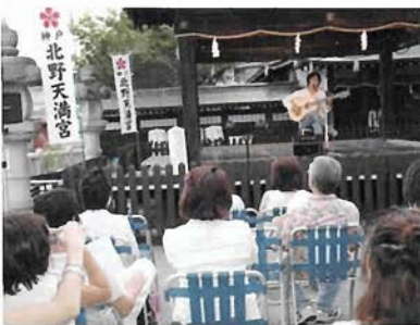
北野天満神社を舞台に、黄金井ワールドを余すところなく披露する

最後は、戦争の悲しみを綴った「白い骨」を演奏。世界中で起こっている紛争や過去の戦争へメッセージを歌い上げ、幽玄な北野天満神社の境内に響き渡った。