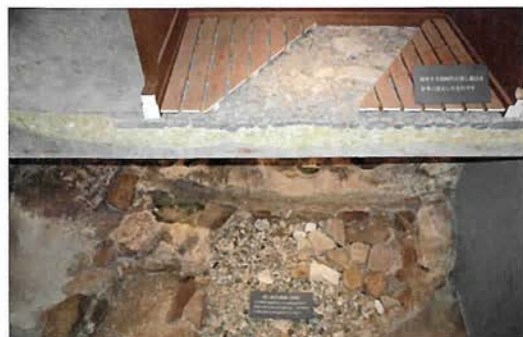
有馬を愛した豊臣秀吉が造らせたという蒸し風呂遺構（神戸市立太閤の湯敷館）