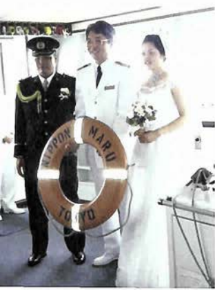
新婚さん、船長を挟んでの記念撮影

神妙な面持ちで船長の祝詞に聞き入る二人。続いて「末永く仲睦まじく…」ご両人の宣誓。船長から手渡さ