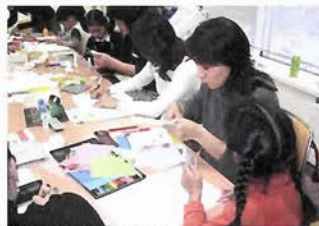
親子で夢中！絵本づくり