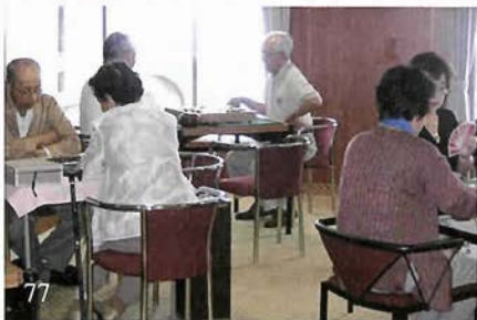
カードゲームで真剣勝負？

これで、今回のクルーズはすべての日程が狂ってしまい、清水クルーズになってしまった。久し振りの八丈島、神戸島を楽しみに勉強もしてきただけに、少々残念だが仕方がない。