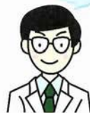
セカンドオピニオン

に素直に従う良い患者を演じることで良い治療を受けられるんじゃないかという勘違いがあったと思うよ。その結果、医療者の「お仕着せ医療」、患者の「おまかせ医療」が当たり前になってしまっていたかもしれない。それが、患者が別の先生の見解も聞いて治療方法を選べるようになったら、主治医の先生もいいかげんなことができなくなる。それによって、医療の質も向上していくことになるんだ。今、セカンドオピニオンの申し出を受ける病院も増えてきたので、ホームページや病院のポスターなどで探してみるのも良いかもしれないね。