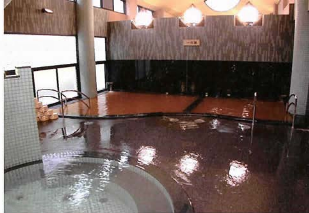
有馬温泉の館「金の湯」

り血流が増加するため、神経痛や高血圧、動脈硬化などに効果が期待されます。また、飲むと胃液の分泌を刺激し、食欲も増進する効果があります。