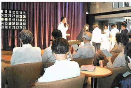
ビンゴゲームを楽しむ