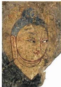
壁画「如来図」 唐時代 新疆文物考古研究所蔵 〔世界初公開〕

近年、中国新疆ウイグル自治区やシルクロード西端の基点として栄えた古都西安において、シルクロードの歴史に関わる数々の発見が相次いでいる。幻の都・楼蘭に近いロプノール砂漠から現れた小河墓地の出土品、西域のモナリザと称される華麗な仏画、西安近郊の遺跡から現れた貴族世界の遺物は、西方と東方が融合するありさまを今に伝える。中国におけるシルクロードの多様な文化の蓄積を、貴重な文物約130点によって紹介。膨大な時をさかのぼる歴史の旅を、ぜひあなたも。