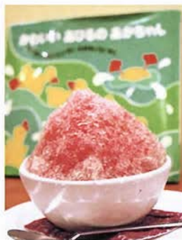
シソのかき氷も人気メニューのひとつ。 さっぱりと食べやすい

配慮が。壁にズラリと並ぶ絵 本も、親たちが幼い頃に愛読 した名作揃い。自分たちの子 供の頃を思い出しながら読み 聞かせれば、注がれる愛情も ひとしおだろう。 ケーキはすべて自家製で、 アレルギーの子供たちのために、 卵や牛乳を使用しないケーキ も用意。遠く離れて暮らす孫 にも食べさせたいと言う声に、 地方発送も開始したとか。信 州産の無農薬ハーブもおすす め。フリーズドライ製法なので、 色合いも美しい。ミント、カ モミールなど のハーブティ ーのほかに、 ラベンダーミ ルクやシソの ジュースとい うユニークな メニューも。 もちろん子供