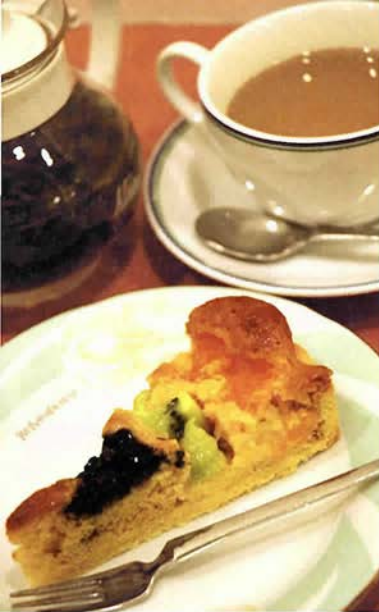
ケーキは数種類から日替わりで。ハーブティーといっしょに...

いつも活気があつて楽しい 垂水商店街の一角のマンマミ ーア・カフェは、まさに親子 のオアシスだ。ベビーカーの 入店歓迎、店内禁煙、おむつ 台完備と子育てママに嬉しい