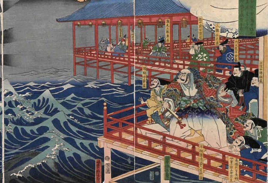
歌川 芳虎画 安芸宮島弁財天 真体ををあらわし清盛が威勢をくちく

弁財天は夢であったのだ。しかし、清盛の枕元には蛭巻きの小長刀が残されていたのである。清盛はそれを家宝として厳島神社に納め、崇め奉った。