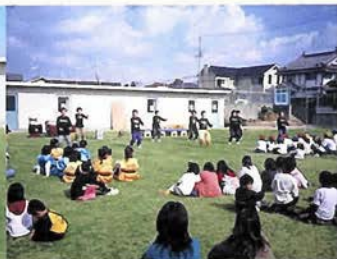
神戸市立桜の宮小学校 (神戸市北区)