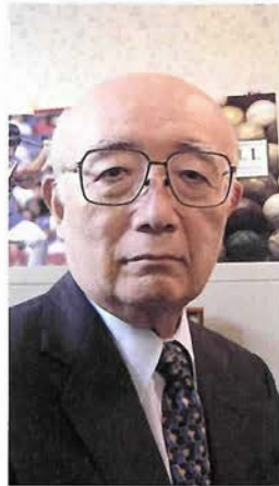
国立民族学博物館名誉教授