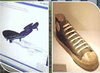
(右) 歴代のモデルが研究所内に展示されている (左) ソールの動きのシミュレーション

アシックススポーツ工学研究所 グローバルバット、ウェアやシューズなど、道具は野球をプレーするのに不可欠なもの。使い心地良いアイテムを使えば、自ずからプレーも楽しくなる。研究と開発をおこなっているアシックススポーツ工学研究所では、トップアスリートからビギナーまで、幅広いプレーヤーに対応するさまざまなスポーツ用品を開発し、スポーツ文化を支えている。