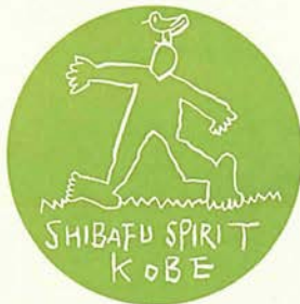
私立頌栄幼稚園 (神戸市東灘区)