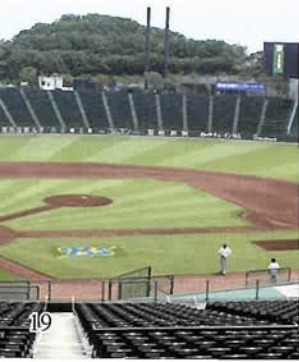
素晴らしい環境のスカイマークスタジアム。スタンドからは緑が見渡せる

野球は、長方形フィールドでゴールをめざす他の球技と違って、大扇形のフィールドでプレーし、ホームに戻って得点となる回帰のスポーツである。移民の国・アメリカ合衆国の人々が、常に安住の地、ふるさと、家(ホーム)を求め続けた「ホーム願望の所産」とみることができ。自らのホームを想い、愛すること。そして大空の下、緑の芝生でプレーしていた野球の最初の姿にみる環境との共生が、新しい時代の都市や地域の活性化に、少なからず示唆を与えてくれるだろう。