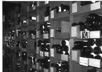
全国でも屈指のワイン数を誇る

良醸造所協会(V・D・P)のコンテストで最高得点をマークした商品など、ワインファンにとってはたまらない2日間になりそう。