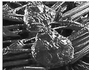
いよいよ松葉がにが解禁

11月初旬には、いよいよ冬の味覚・ずわいがに漁が解禁となる。山陰地方では「松葉がに」と呼ばれるずわいがにの雄は、特に珍重されている。