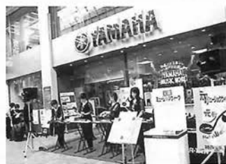
元町商店街にさわやかなメロディが響く

元町界隈の店舗、ストリート、ホール、カフェで音楽の楽しさ、感動をもっと身近な暮らしの中で体験してほしいと企画された、「神戸元町ミュージックウィーク」。1998年に、産声をあげてから今年で7回目を迎える。10月9日から17日まで開催された今回は、過去最大の規模の開催となった。ストリート・コンサートでは、公募により100グループ以上が参加。台風の影響で一部変更があったが、ショッピング客を大いに楽しませた。 また、10月15日には、神戸 松方ホールで「アントニオ・ガウディ幻想」と