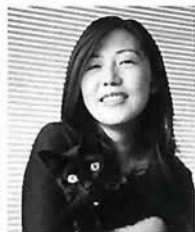
注目を集めるベトシッター

e-Learningとは、バ ソコンを利用して、Web上 で講座を受講したりする新 しい学習スタイル。DTS