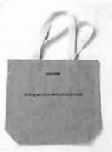
バタゴニア神戸のロゴが入った非売品キャンパスバッグ

「バタゴニア神戸」のロゴ入りで、オープン記念キャンペーンの際に限定で配られたもので、非常にレアな品だ。底の部分が広く、見かけよりもたくさん入って頑丈、男性でも女性でも使えるシックなデザインが嬉しい。