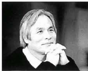
66歳、堀江謙一さんのチャレンジは続く