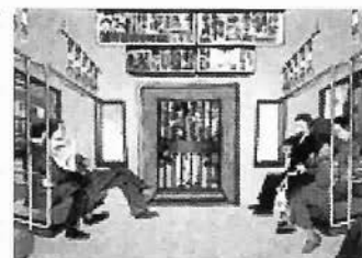
「にっぽんの通勤快速」 東茅

キリンビール(株)では、芸術文化支援活動の一環として「キリンアートプロジェクト」を開始する。このプロジェクトは公募で選ばれた新鋭アーティストとゲストアーティストが同一テーマのもとに競い合いながら