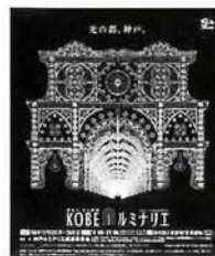
今年のテーマは「光の都、神戸。」

応募方法/規定の応募用紙(応募作品企画書)をホームページから印刷し、必要事項を記入の上、過去の作品資料(ビデオ・写真など)を同封し事務局へ送付。