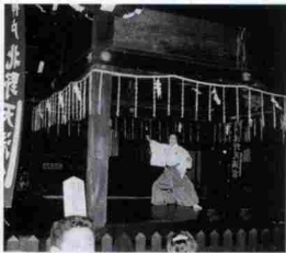
前田鯉朋さんによる「古城」