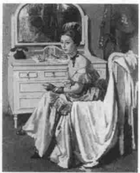
コスチューム 大阪中之島リーガロイヤルホテル蔵

■神戸市立小磯記念美術館 神戸市東灘区向洋町中5-7 ☎078・857・5880