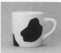
ユーモラスな牛柄マグカップ

10月16日JR尼崎、阪急園田駅近くに、ボザールカルフルニ崎店がオープンする。清潔感あふれるおしゃ