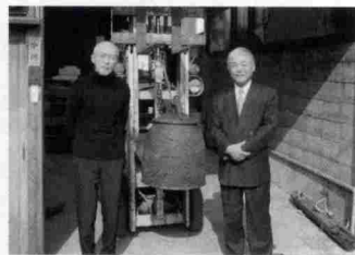
タクツァン僧院に贈呈する梵鐘 (桑名市中川梵鐘にて)