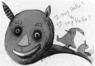
ちょっと不気味でコケティッシュなイラストたち