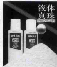
発売中の「液体真珠」

今啓パール㈱では「液体 真珠」(パールブリッジ エクストラ)を販売してい る。液体真珠は、特殊製法 により真珠のコンキオリン と真珠層(真珠カルシウム) を特殊な菌で発酵させ、イ オン化させた吸収のよい真 珠ミネラル発酵液である。 ★家庭で理想の水が作れる 浄水器と「液体真珠」が あれば、簡単に理想の水が 得られます。