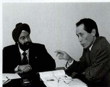
時間を忘れて様々な意見交換がおこなわれた(松酒家にて)

来て、そのビジネススタイルに対応できるようにしていなければならぬ。それは空港でも同じです。 キラン 海外から神戸のことを知らないお客さんが来て、シヨッピングしたいと言つても、どこに行けばいいのかわからないですからね。まちに英語は当然のこと、何力国語かの標識があるだけでも違いますから。まずはそこからですよ。