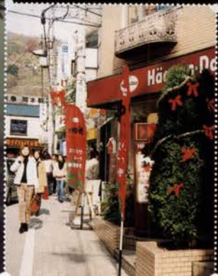
(左) 鯉川筋のクリスマスツリー (右) 阪急岡本駅前の赤いリボンのクリスマス

岡本商店街は、赤いリボンのクリスマス。それぞれのお店で、赤いリボンを使って、趣向をこらしたクリスマスディスプレイを飾っています。木々に飾られた赤いリボンは、昼間に見てもかわいらしく、ショッピングも一段と楽しくなりそう。