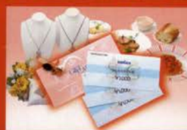
さんちかギフト券