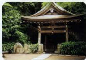
静かな空気が流れる 炭酸源泉公園

有馬温泉中心部を抜け、タンサン坂を上ると、緑が美しい「炭酸泉源公園」がある。有馬独特の赤湯の色に染まった炭酸泉源の横には、水飲み場が設置されている。昔は毒水といわれていたが、飲浴両用に適する天然の炭酸水だとわかり、以降全国に知られるようになった。舌にぴりつとくる炭酸水は、慢性消化器病に効能があるとか。