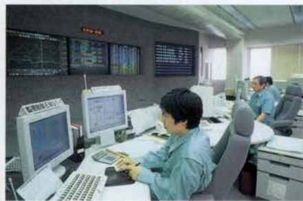
市内全域に点在する配水池などの水量をテレメータ・テレコントロールシステムで集中管理。水をむだなく適切に届けることができるよう24時間遠隔操作される。

神戸は東西に細長く、しかも水源が東部に偏っていますから、皆さんに水を供給するのに時間がかかってしまうんです。それを常に一定の水質に保たなければなりません。それから、高さ900mを越える六甲山のみもとにあって坂が多いので、水を自然流下方式でまち全体に適切な水圧で届けるために、土地の高さごとに配水池を設ける必要があります。そのため、配水池やポンプ場などの施設が他の都市よりもはるかに