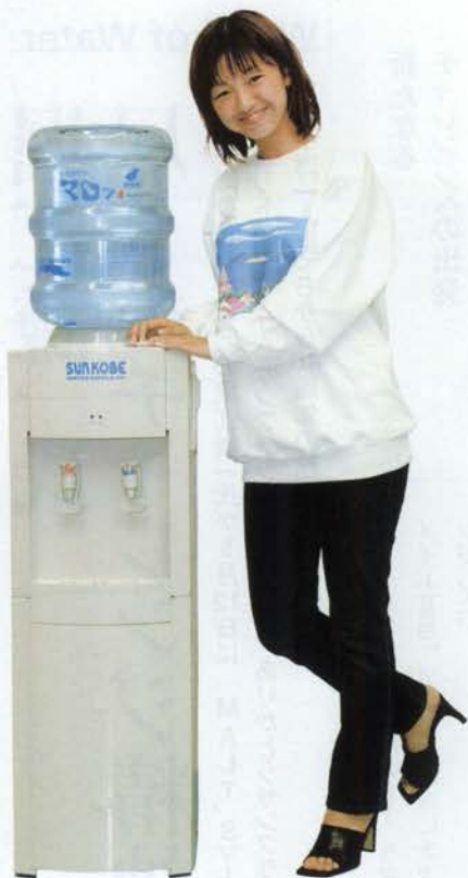
ウォーターディスペンサーの保守料は月々800円

ている他社ブランドの5〜10倍もの数値に値するほど。ミネラルの豊富な天然水は、肉によく浸透し、アクを引き出す作用もある。そのため、ある食品メーカーでは「マロツ」を使った食品を製造したいと、工場を取水地の近くに移動して来たというエピソードも。 また、熱処理をまったくおこなっていないところも特筆すべき点である。普通なら菌類を取り除くために、熱処理を行うが、「マロツ」からは、菌類の検出はまったくない。 しかも厚生省の「おいしい水」研究会での条件もクリアしており、60種類以上の微量元素をまんべんなく含んでいる。さらに飲んだ時の咽ごしに影響を与える遊離炭酸の数値も