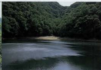
神戸水道発祥の地である布引貯水池。日本最古のコンクリートダムとして登録有形文化財に指定されている。現在はダムの耐震工事と周辺の整備を行っている(工事期間H17年3月まで)。