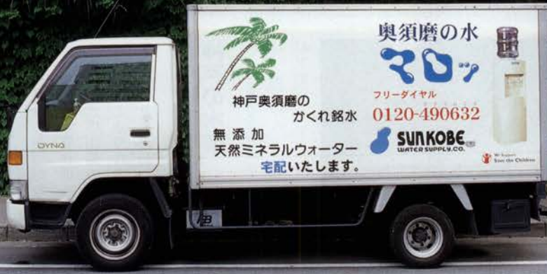
神戸市内を駆けめぐる奥須磨の水「マロツ」の宅配車

六甲山系の花崗岩盤から汲み上げる奥須磨の水「マロツ」。カルシウムの量は、通常の天然水の5〜10倍にも達するという。製造元のサン神戸ウォーターサプライ(株)では、家庭や職場への宅配を行って、新鮮な天然水の普及につとめている。