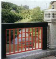
有馬川下流は地元の人おすすめのスポット

鼓ヶ滝のある上流のあたりと、有馬温泉中心部の親水公園よりも少し下流に行くと、たくさんホタルが見られる。5月下旬には多くの光が確認され、今年は6月上旬までが見ごろ。有馬小学校の児童たちがホタルの幼虫や、えさになるカワニナを放したり、清掃活動を行うなどしているため、毎年美しい乱舞を見せてくれている。