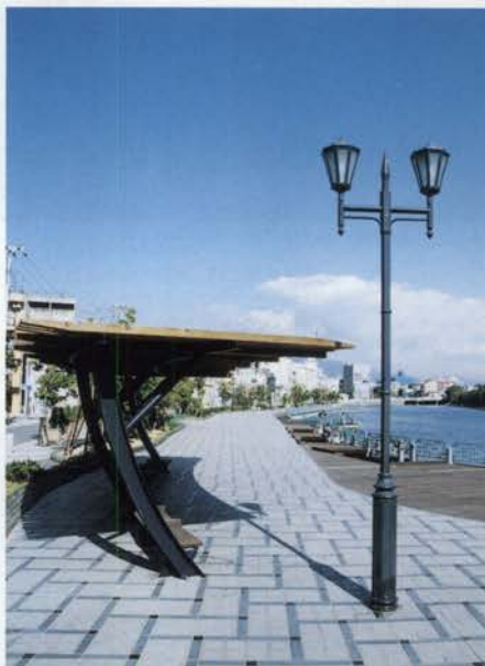
夜にはライトアップがされ、デートスポットとしても人気