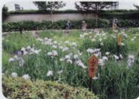
水面から華麗に顔をのぞかせる花しょうぶ

かつては皇室の別荘・武庫離宮だった須磨離宮公園。もと離宮らしく格調高い雰囲気にも包まれている。