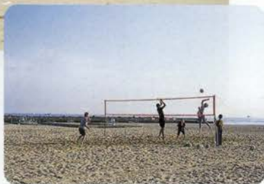
日暮れまで時間を忘れて...少年の日に帰る