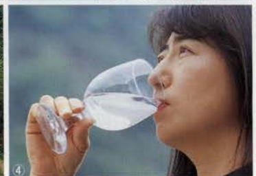
①地下200mから汲み上げている②外気にふれることなくボトリングされていく③鉄拐山の中腹に佇む「マロツ」の取水地④ミネラル豊富で咽ごしまろやか

ムとマグネシウムの合計量をいう。飲料水の硬度は1ℓ中10〜100mgが適当とされている。「マロツ」の場合、カルシウム41mg/ℓ、ナトリウム8.6mg/ℓ、カリウム1.5mg/ℓ、マグネシウム4.3mg/ℓ。硬度数値が130mg/ℓという、全国的にみても極めて高い数値で、ミネラルウォーター市場を席巻するヨーロッパのレベルにも匹敵するという。とくにカルシウムの数値が高く、市販され