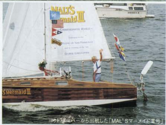
ヨットハーバーから出航した「MAL' SマーメイドⅢ号」