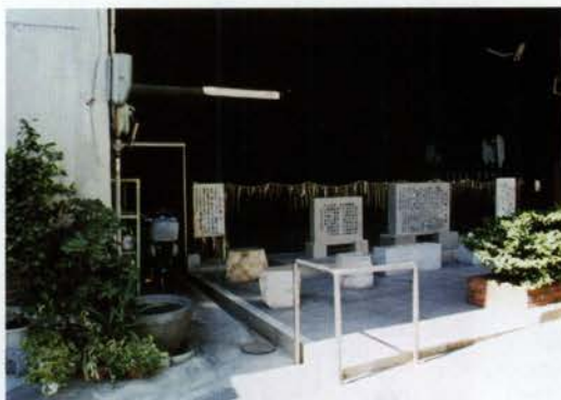
澤之井の池。水を祭る祠と碑がある

旨い水の館なんてちょっと粋。御影市場は震災で大きく姿を変えたが、前々からの商店も多く残っている。カシワ専門の鶏肉屋さん、おはぎや赤飯を売ってる和菓子屋さん、おいしい漬物売ってる店、お惣菜も豆腐もすべて御影の商品。駅と市場の間に、昭和30年代に戻ったような隠れ飲み屋が潜んでいるのも必見。