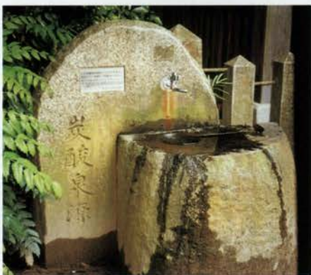
泉源のとなりにある石造りの水飲み場