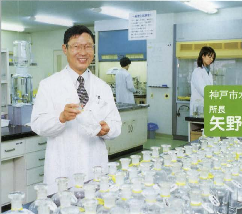
月2回市内30か所から手作業で採取された水はさまざまな検査を経て、飲料水基準をクリアしている安全な水がチェックされる。

—— かつて神戸に寄港した外国船に世界一の水と絶賛された「コウベ・ウォーター」は、赤道を越えても味に変化がなかったとか。神戸の水は有