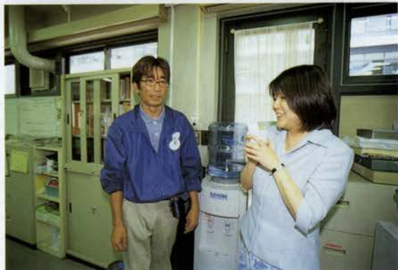
神戸市内を中心に、一般家庭や職場に配送を行う。「臭いがなく、おいしい」と言う利用者の声が多い

☎0120-490632 (受付時間9:00~18:00 月~金) FAX.078-753-5551