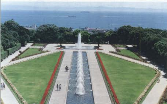
広場には水をモチーフに、滝(カスケード)と芝生や花壇を配した水路(キャナル)が流れる美しい欧風庭園が広がる