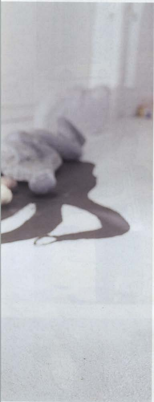
アトリエ2001「紙と石の出会い展」より (壁面作品は朝倉俊輔氏による)

高架下にある不思議な画廊で2人展を予定して、その出品作を制作する間に父が死んだ。人が死ぬという当然のことに、何を騒ぎたてることがあるのかと騒ぎの渦中で考え続けた。その騒ぎの治まった後にも心の中なかでは死の大きな手に抱き捕らえられようとする官能の騒ぎがたちおこった。