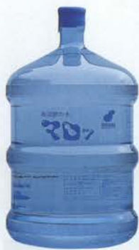
ガロンボトル(18.9ℓ)は1,800円

(5℃)と温水(85℃)の2タイプが同時に利用できること。このディスペンサーは、幅340mm×奥行350mm×高さ1020mmと比較的コンパクトなサイズで場所をとらない。現在、利用者は一般家庭が8割で、ホテル、企業、病院、飲食店などにも利用が増えている。利用者からは水自体のうまさはもちろん、ご飯がおいしく炊き上がる、コーヒーやお茶がおいしいなどの意見が多い。これまでのように、ペットボトルで持ち帰る負担もなくなるだけでなく、ミネラルをたっぷり含んだ天然水を家庭や職場で飲むことができるのだ。