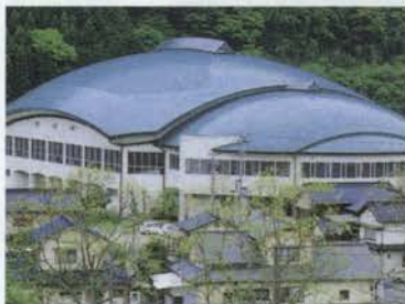
町のシンボルであるホテルの形をした「ホテルドーム」