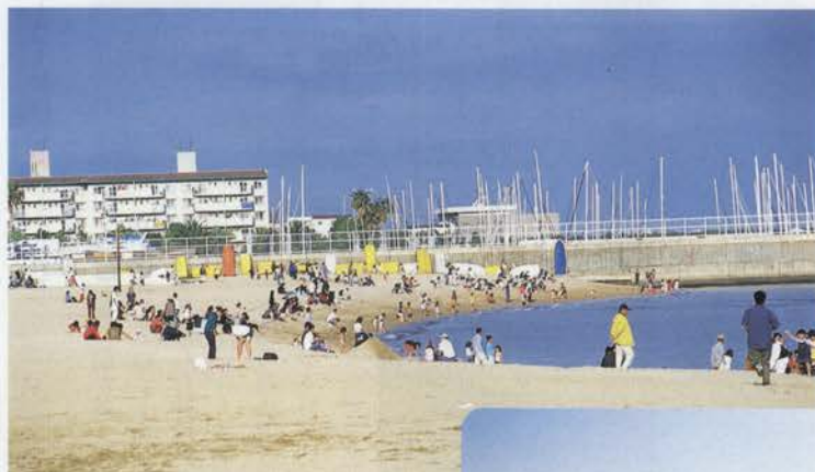
天気の良い休日にはファミリーや若者たちでいっぱい須磨海岸