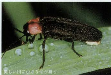
美しい川に小さな命が舞う

またまた多くの自然が残る兵庫県内の水辺。中には、地域の人々の努力でホタルが戻ってきた川もあります。