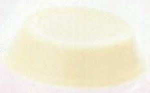
バニラ 天然のバニラビーンズで風味づけ