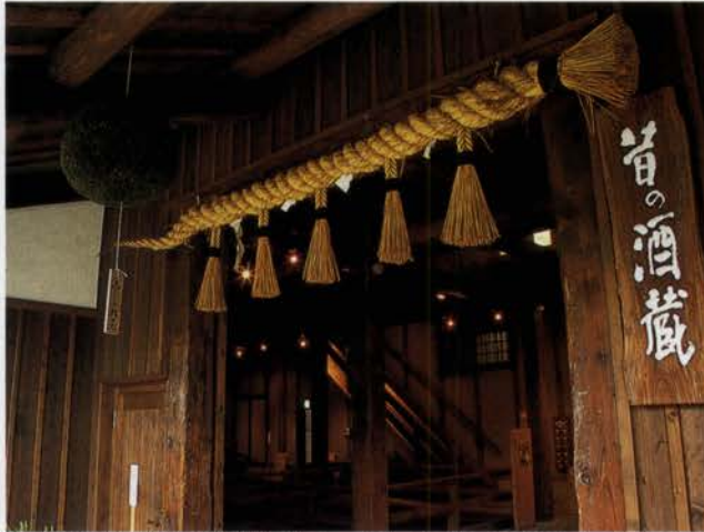
「灘五郷」とは阪神間の海岸線沿いにつらなる酒どころの総称で、東から西宮市の今津郷、西宮郷、神戸市の魚崎郷、御影郷、西郷と続く。名水・宮水と、酒米の横綱・山田錦、酒づくりのすぐれた技が出会い、日本一の酒どころといわれる。今は酒造工場や昔の酒蔵を改装した資料館などがあつまっている

現在の宮水のはほとんどは酒造元の所有で、自由に飲むことはできないが、宮水の発祥地は「宮水庭園」として保存されている。