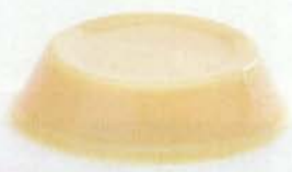
キャラメル 丹念につくったミルクキャラメル味