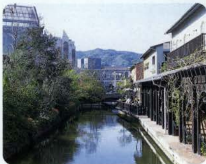
小さな木の橋を渡ってモザイクへ