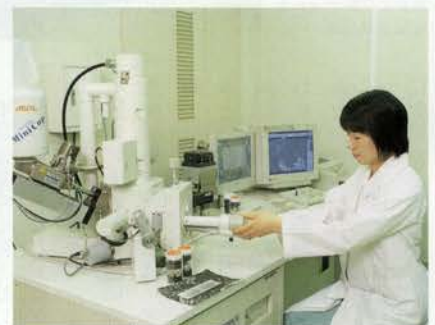
水質試験所での顕微鏡検査。 水道水の質と安全性の向上に日々努めている。