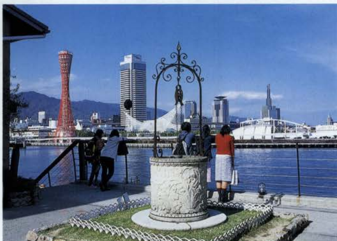
“これぞ神戸”の風景だけれど、何度見ても大好き！

真紅の鼓型が美しいポートタワーに、ウォーターフロント緑地・メリケンパーク。言わずと知れた神戸の恋人たちの御用達スポット。神戸ハーバーランド・モザイクへと続く水際の遊歩道は、ミナト神戸をぐるり観光している気分にもなっていて楽しい。