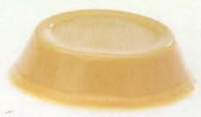
コーヒー 焙煎にこだわったキリマンジャロ、モカのオリジナルブレンドの味わい