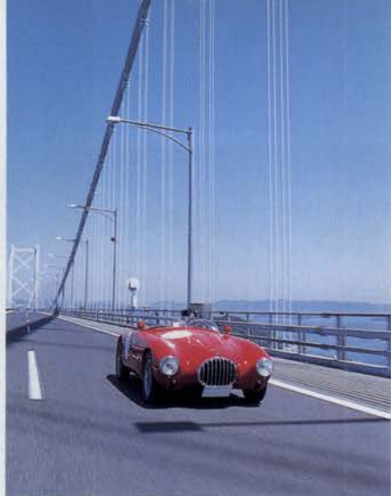
今年は鷲羽山スカイラインを通過して瀬戸大橋を渡って四国へ