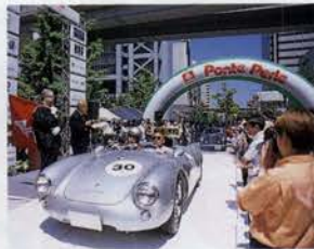
六甲アイランドをスタート、日頃お目にかかれない車ば かり。3日間で六甲大橋、瀬戸大橋、大鳴門橋、明石海 峡大橋と4つの橋を渡る楽しいレースがまっている