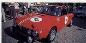
倉敷美観地区。1967 LANCIA FULVIA 1300 COUPE