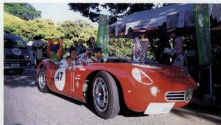
普段は車は入れない岡山の後楽園で 1960 CONRERO 1150 SPORT LE MANS