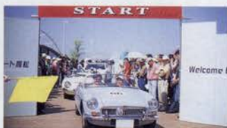
サンポート高松のオープン記念イベントにも参加したポンテ・ベルレのメンバー 1970 MGB MK2