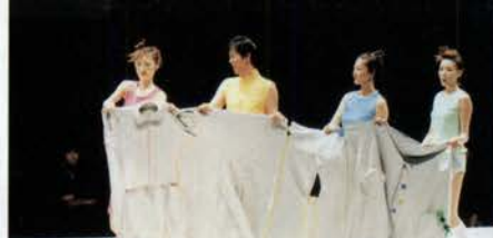
1枚につなげた4着の服を舞台上で分解し、着装するパフォーマンス