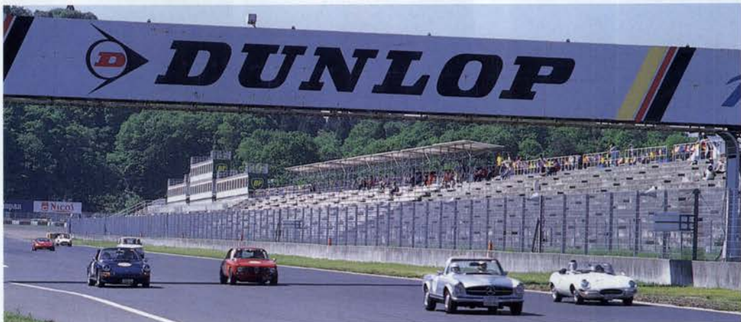
岡山のTIサーキットでF1レースのように駿足で走る? クラシックカーは見るひとより走っているひとの方が楽しい