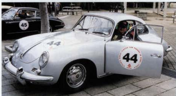
中村直正さんの愛車 1964 PORSCHE 356 SC COUPE