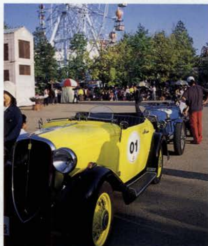
倉敷の子ボリ公園 1935 FIAT 508 BALLILA