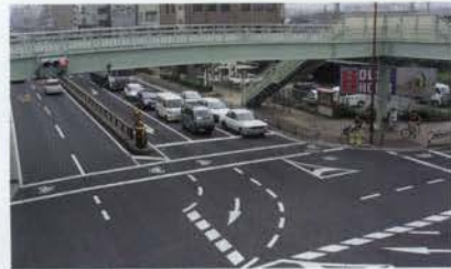
現在の札幌筋交差点。自転車道2m幅と歩道3.5m幅と比較的広くスペースがとられている

者や地域住民の意見を聞いて事業を 進めています。この度、国道2号線 札幌筋交差点においても、地権者の 協力が速やかに得られ、事業の迅速 化をはかることができました。 今後も、アンケートやホームペー ジ等の書き込みを通して、利用者の 皆さんの意見のキャッチボールを 行っていきたくと考えています。