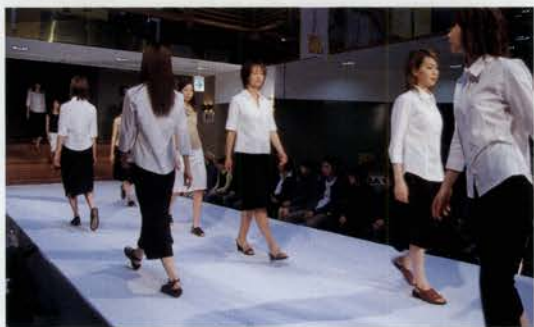
メーカーの春夏ファッションシューズコレクション