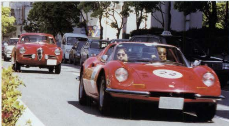
ホテルオークラ神戸の前を通過。1972 FERRARI DINO 246 GTS