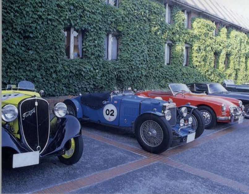
初日の宿泊は、倉敷のアイビスクエア。いつも熱烈な大歓迎を受ける