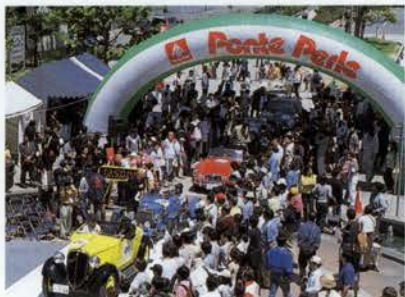
六甲アイランドリバーモール公園をスタート