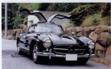
衣斐孝雄さんのメルセデス・ベンツ。 1955 MERCEDES BENZ 300 SL