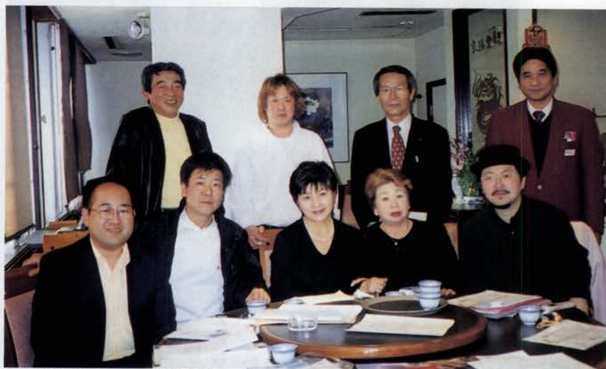
鯉川山手街づくりのメンバー(群愛飯店本店にて)

また、大道芸や、中 国舞踊、フラメンコ舞 踊、バンド・味娘の出 演が決まり、空地でフ リーマーケットもと、 初めてのイベント企画