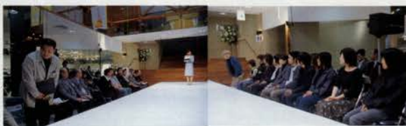
靴のデザインは初めての学生も多かった。(右) デザイン画から履ける靴にと苦心をされたメーカーの方々(左)