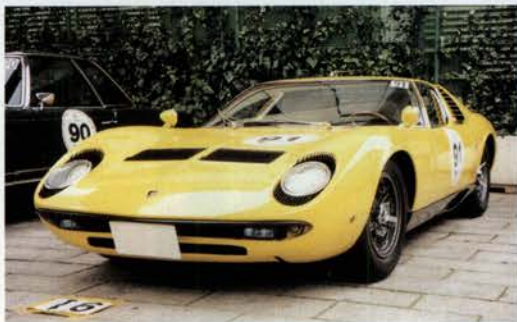
1967 LAMBORGHINI MIURA 400MS