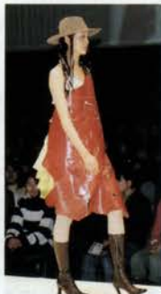
赤い皮のタブリエ

〒651-0066 神戸市中央区国香通6丁目7番 Tel. (078) 241-8611 (代) Fax. (078) 241-8614 Home page address: http://www.kfi.ac.jp/