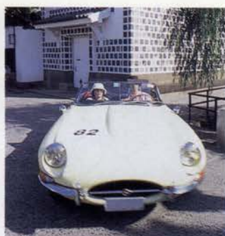
倉敷美観地区を走る。漆喰壁の蔵屋敷と柳の木がゆるる川沿いを優雅に走行。 1969 TOYOTA 2000 GT