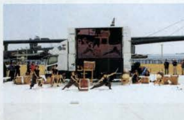
西宮市の「太鼓社中 夙川太鼓」の演奏など、阪神・淡路の郷土芸能などが披露された