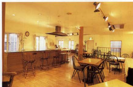
自然光が窓から差し込む明るい店内。サロンのような居心地のよさ

鮮なお菓子の素材を探し求めている意欲的なシェフの、いまいちばんのおすすめは、「黒糖プリン」(200円)。赤山のジャージー牛乳と宮古島のさとうきびからできた黒砂糖でつくる自信作をぜひ味わって。天気の良い日には花々が咲き乱れるガーデンカフェに座って春の風を感じながら素敵なティータイムが過ごせそう。