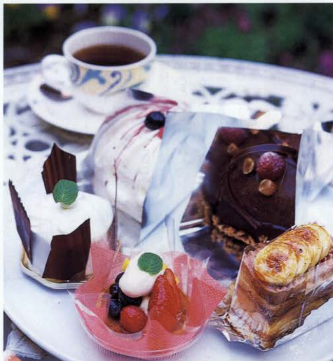
(左から)真っ白なフォルムとミントチョコのプチプチした舌触りがさわやかなムース「YaYa」330円、ベリーが満載の「タルト オ フリュイ」350円、ほんのり洋酒の香りの「ガトーバナヌ」320円、(奥左から)ふわりとしたスポンジが絶妙の「ロンド」420円、一番人気の「シエマダム」400円

「元ぶら」ショッピングに歩き疲れたら、人通りの多い商店街をそっと抜け出して。細い路地に静かにたたずんでいる白い洋館が、「サ・ソ・ボン」。フランス語で「いい香りですね」を意味する店名の通り、店のなかからはハーブクッキーを焼く香りがふんわり風に乗ってくる。