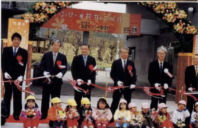
国营明石海峡公園誕生のテープカット。市内の幼稚園児たちが、花束を手に参加した