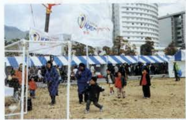
ワールドカップの記念イベント。子供たちが参加してシュートの速さを競った