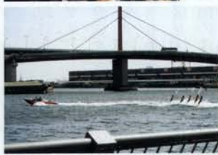
本場アメリカからやってきた豪快な水上スキーとカイトショー。何連にも連なるカイトを自在にあやつり、水上で宙返りをしたり、そのたびに歓声があがった