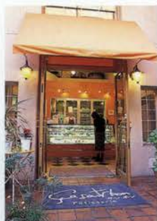
オレンジ色のファサードがかわいい

毎朝ひとつひとつのケーキを丁寧に焼くから、全23種のケーキがすべて顔をそろえるのはお昼前。旬の果実をふんだんに使った爽やかなケーキやムースなど、フレッシュユでやさしい味が人気の理由だ。これからの季節なら、路地モノのいちごやジュシーなどユニークな食材を使ったものも登場するのでお楽しみに。常に新