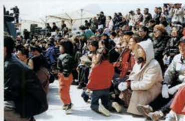
海辺の風が強く吹きつける中、たくさんの人々が訪れ、ステージは盛り上がった