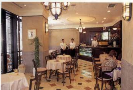
まるでミラノあたりのカフェをそのままもってきたかのよう