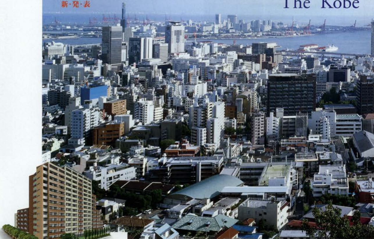
外観完成予想図 (実際とは多少異なる場合があります)