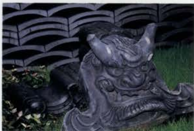
↑淡路産のかわらを使った「淡路の庭」