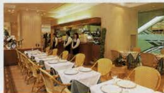
地下1階洋菓子エリアのクレモンティーヌで、同じ味を家族にも是非