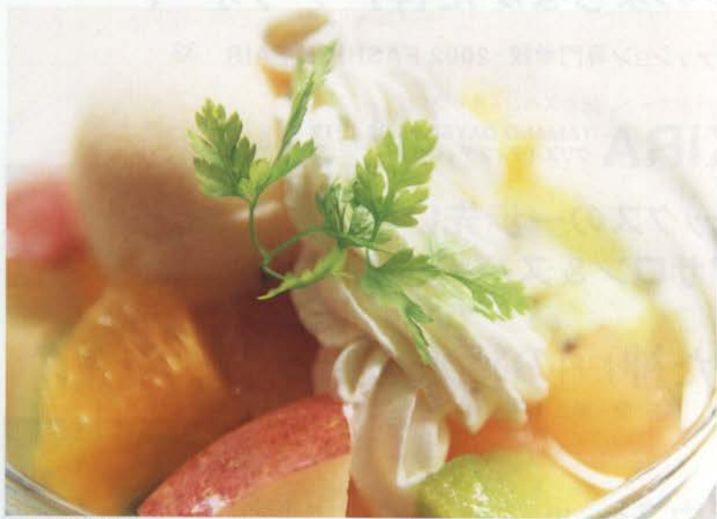
ワインに漬け込んだフルーツパンチ+バナラジェラートのカップ・マチュドニア

ぼかぼかあったか春の日は、のんびりお気に入りのカフェで過ごしたい。すごく居心地がよくって、スイーツ自慢！神戸のカフェってだから大好き！パステルカラーに咲いたあま〜くやさしいスイーツをほおばって、幸せ気分を満喫しよう！