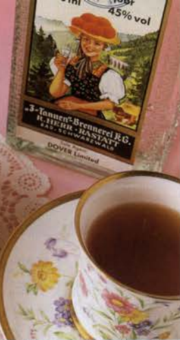
洋酒に付け込んだドライフルーツがたっぷり使われている「ガトーマリアージュ」は結婚式の引き出物として大人気。1500円

四季折々のイメージが美しい感動の味。ケーキセット(1000円)の4月限定メニューはイチゴ風味のティラミス、バドワイーズ、抹茶とバナナのムース、卵を使わないシヨートケーキなど。 地下1階洋菓子エリアのクレモンティーヌで、同じ味を家族にも是非