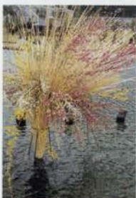
←小原流、草月流、未生流の気鋭作家による公園全体を花器に見立てた「ランドスケープ・フラワーアート」。 ↓温室ギャラリーでは「新淡路名所図絵」のガーデンが造られた