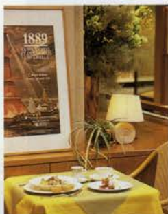
まるでフランスのカフェにいるような気分

☎078-331-8121 (外線) 神戸市中央区明石町40 大丸神戸店2F 【営】10:00~19:30 (L.O19:00) 【休】無休