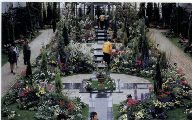
色とりどり、世界各国の花が咲く淡路夢舞台温室。訪れた多くの人々は自然の美しさを満喫

淡路花博の跡地が、ふたたび花いっぱいの公園になって「国营明石海峡公園」がオープン。誕生を記念して3/21から11日間「花舞台はっぴー*花カーニバル」が開催された。当日は雨模様の天気のため、野外で予定されていた野外オペラ「ランドスケープ・オペラ」公開リハーサルは残念ながら中止になったものの、伝統芸能のステージや花の絵てがみ教室など、たくさんの催しが。