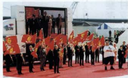
「See阪神・淡路キャンペーン」の意義・成果を託し、BIG BIRTHフラッグが各市町村の市長や代表に手渡された