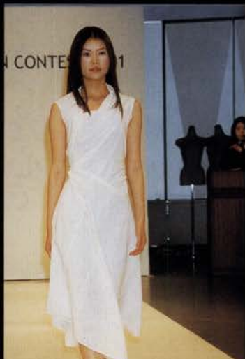
Origin 決まった形がなく自由な服。カラダ、布、重力、3つの要素が1枚の大きな布でつながる。