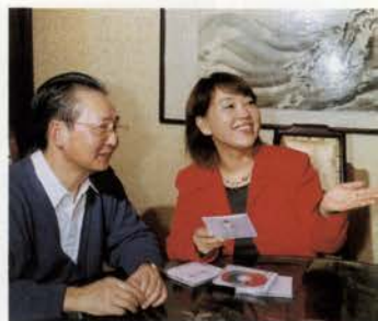
音楽談義に花を咲かせる (ヒルトン大阪にて)

胡弓は、音源が演奏者の耳からかなり離れているので、音の圧迫感がありません。しかし、バイオリンの四弦に対して、胡弓は二弦。しかも、ギターのようにフレットがついていないので、世界でも難しい楽器の一つです。しかし、優雅な音色が非常に素晴らしいですから、ぜひ、マスターしてください。当社も胡弓の教室を開く予定です。音楽も「医薬食同源」。とくにララバイ「中国の子守歌」は、楽曲形式のバランスが、とてもよくとれています。