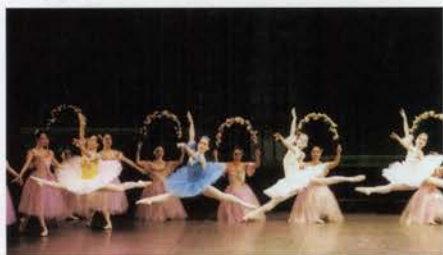
観客を夢の世界へと誘う。こんな風に踊れる日も遠くない!