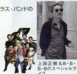
上田正樹 & B・B・Bのスペシャルライブ

上田正樹とブラック・ボトム・プラス・バンドのライブコンサート、レーザーと花火のショーなどが行われる。