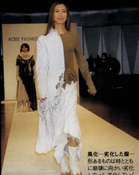
風化—劣化した服— 形あるものは時とともに崩壊に向かい劣化していく。劣化していく服にも美は存在する。