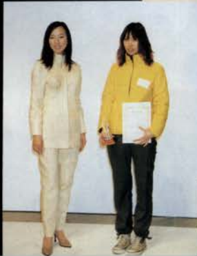
人体分割 人のカラダは完全なようで不完全。確かなようで不確か。直線と曲線、アナログとデジタルで表現。人体の壮大なバズル。