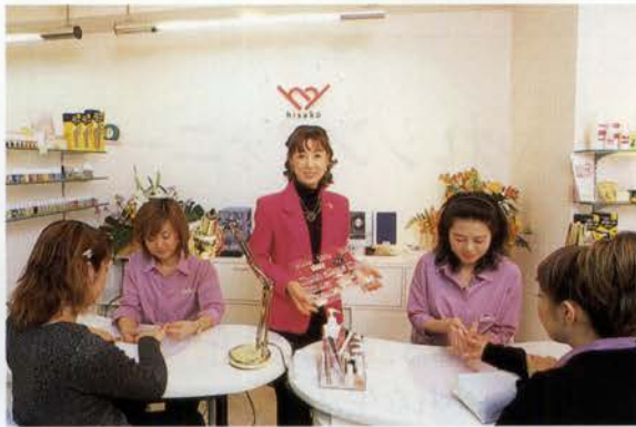
ゆったりとした空間で、ネイルのスペシャリストたちが親切に相談にのってくれる

と、お客さまに合った、楽しいデザイン制作をしています。 エステはもちろん、ネイルを中心にした美容と医療と、癒しをコンセプトに、お肌と爪に良いトータルビューティーを神戸の皆さまに思っておりますので、ぜひご相談、ご利用ください。 ネイルスクールもここでやりになるのですか？ ええ。定休日に、朝10時から夕方6時まで、6人ぐらいの少人数制で開校いたします。大阪の本校へまず資料請求してください。技術を身に付けて、それを職業や生活に活かしていくことがとても大切です。 先生は、老人ホームなども訪問されているそうですね。 学校のカリキュラムに加えています。ネイルケアを修得した生徒たちを連れて老人ホームを訪ね、爪と手のお手入れをするのですが、どんなに喜んでくださるか。さわたり、ふれあっていたりする授業だけでない、技術だけではない心の交流ができるのです。美容を越えたメンタルな要素のエネルギーをあげたり、逆に励まされたりするので、素晴らしい勉強の場なんです。 健康で理想的な美しさを内面から、これがヒサコネイルのコンセプトです。ぜひ、お試しください。