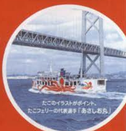
たこのイラストがポイント。 たこフェリーの代表選手「あさしる丸」