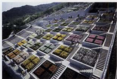
斜面にいとどりの花壇が並ぶ「百段苑」

市の中核施設として多くの人が交流し、交歓することをコンセプトとして整備されたところです。国際会議場やホテルはそのような目的に沿ったものです。花の博覧会には700万人の人がこの地を訪れてくれました。その方々に末永く何度も足を運んでもらえるように努めなければと思っています。今年は国営明石海峡公園のオープンをきっかけにして、「淡路花祭」や「はな舞台ゆめ舞台2002」