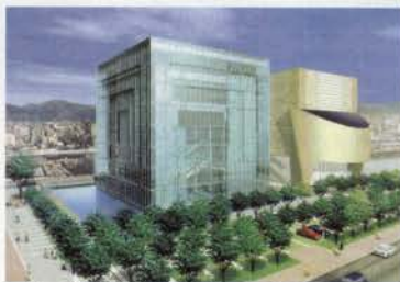
阪神・淡路大震災記念「人と防災未来センター」 イメージベース