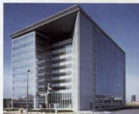
国際健康開発センタービル (WHO神戸センター等入居)

4月には、震災からの文化復興のシンボルとなる県立美術館「芸術の館」や、震災の教訓を後世