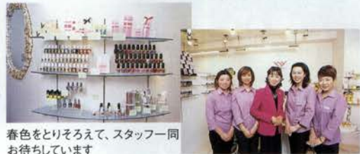
春色をとりそろえて、スタッフ一同お待ちしております