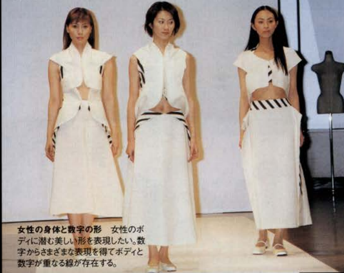
女性の身体と数字の形 女性のボディに潜む美しい形を表現したい。数字からさまざまな表現を得てボディと数字が重なる線が存在する。