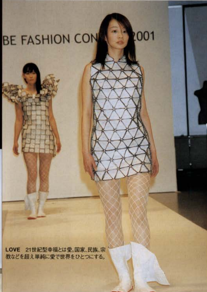
LOVE 21世紀型幸福とは愛。国家、民族、宗教などを超え単純に愛で世界をひとつにする。