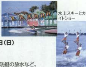
水上スキーとカイトショー

●国際文化パザール・ステージ パザールには各国の民芸品が並び、ステージでは各国の民族芸能が上演。