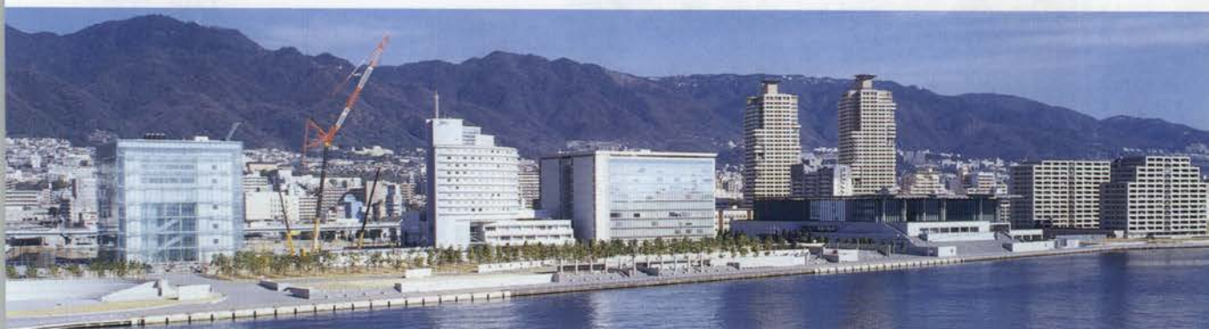
神戸市中央区東部および灘区西部のウォーターフロントに整備が進むHAT神戸