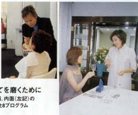
(写真上) マナーの授業 (写真左) メイクアップのレッスン

パワーズのポリシーは、外面、内面トータルに磨かれた女性を育てること。68時間をかけてすべて学びます。