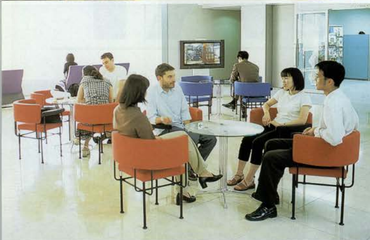
(上) 外国人研修員たちが集うJICA兵庫国際センターのレストラン。(下) イベントやセミナー、語学学習などを通じて、国際交流を実践する「ひょうご国際プラザ」