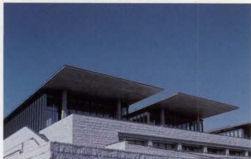
4月6日(土)にオープンする県立美術館「芸術の館」

神戸東部新都心「HAT神戸」は、震災復興のシンボルプロジェクトとして、兵庫県、神戸市などにより整備されているもので、三宮から東へ続く新しいウォーターフロント空間になる。