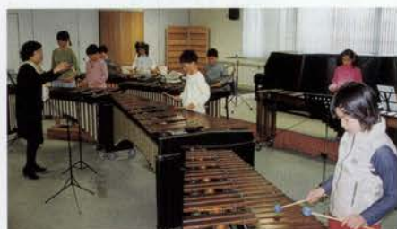
熱心にアンサンブルに挑戦する子どもたち