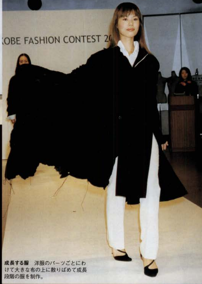
成長する服 洋服のパーツごとにわけて大きな布の上に散りばめて成長段階の服を制作。