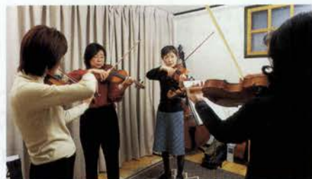
少人数レッスンで丁寧に指導してもらえます