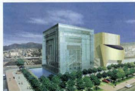
阪神・淡路大震災の経験や教訓を継承する阪神・淡路大震災記念「人と防災未来センター」がオープン

兵庫国際センターのオープニング記念式典が、4月12日（金）に開催。翌13日（土）は、公開の国際協力フォーラムを開催。