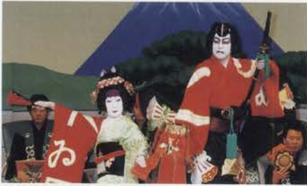
長明「正礼附」の華やかな舞台