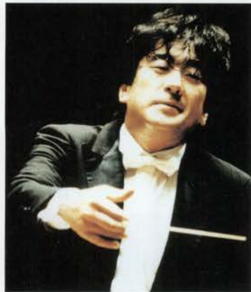
力強く、それでいて繊細な指揮には定評がある

佐渡さんはヨーロッパをはじめ国内外のオーケストラ・劇場で活躍し、実力と人気を兼ね備えた指揮者。京都出身であり、関西の音楽事情に精通。また夫人の実家が神戸市長田区にあり、演奏活動の合間を縫って休日を兵庫県で過ごすことが多く、兵庫県に親しみがある。