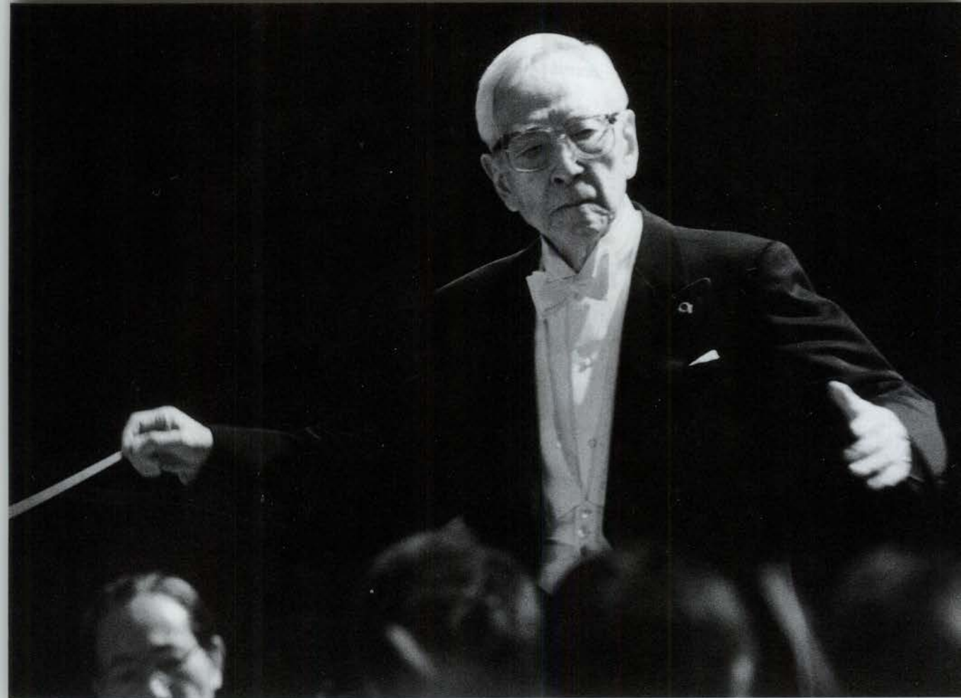
大阪フィルハーモニー交響楽団音楽総監督であり、現役最高齢の指揮者だった