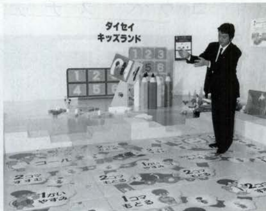
(左)キッズランド商品のSUGOROCK (下)新素材を使って新しい商品展開を