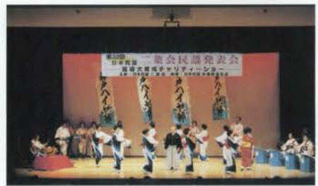
昨年10月に行われた二葉会民謡発表会(盲導犬育成チャリティショー)の華やかな舞台

日本民謡二葉会 神戸市中央区元町通2-9-1元町プラザ9F ☎078-391-5474 お問い合わせはお気軽にどうぞ