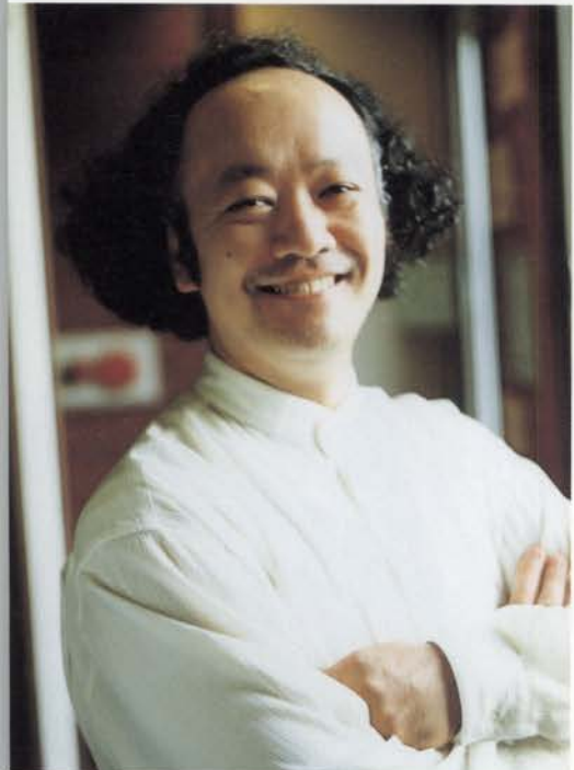
山本郁夫 神戸に生まれ、愛知県立芸術大学声楽科在学中、イタリア留学。東京芸術大学指揮科入学後、小澤征爾、P.シュトルマーレ、F.トラヴィスなどの助手を務め、現在実力派指揮者としてオペラやバレエなど、劇場及びコンサート活動を展開している