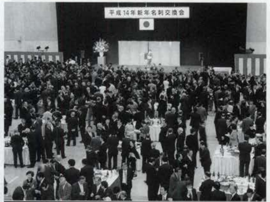
平成14年度新年名刺交換会開く。2002年の幕開けは、神戸商工会議所の恒例新年会。1月4日、国際展示場で開かれ2000人が大集合、井戸敏三知事、矢田立郎神戸市長、関西領事団のダニエル・アヴィオラ団長に、大庭商會頭が加わって鏡開き、明るくスタートした。