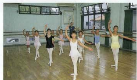
いきいきと踊るプチバレリーナたち