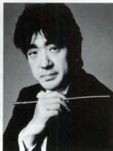
佐渡裕(さど・ゆたか)

1961年、京都市生まれ。84年、京都市立芸術大学音楽科を卒業後、故レナード・バーンスタイン、小澤征爾らに師事。フランスのコンセル・ラムルー管弦楽団、イタリアのジュゼッペ・ヴェルディ・ミラノ交響楽団、フランス国立ポルドー・アキテーヌ管弦楽団など、国内主要オーケストラはもとより世界各地で一流オーケストラとの共演を重ね、今後の更なる活躍が期待されている。現在はパリ在住。