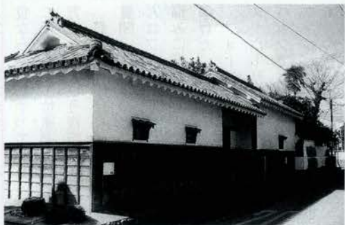
萱野三平旧邸・長屋門

有限会社 エイジー 大阪府吹田市垂水町3-24-14-218 グリーンコーポ江坂第二 TEL06-6384-1995 FAX06-6386-9566 http://www.birdseye.co.jp/ info@birdseye.co.jp 担当＝羽田定弘