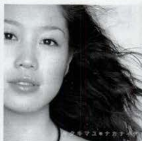
キタキ マユ [ナカナイデ] ¥1,223 So-flio Records. 透き通るようなメロディと歌声が気持ち いい1曲。Newアルバム「トリコロ ル」もYo checkです。