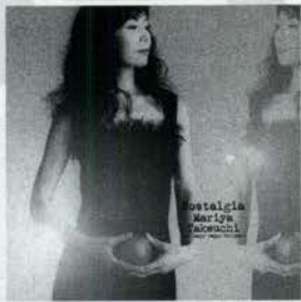
竹内まりや「Nostalgia」 ¥3,059 ワーナーミュージック・ジャパン おとなの女性の魅力とやさしさが詰め込まれたこのアルバムは、まりやさんのお人柄のよさが伝わってくる1枚です。