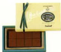
ゴンチャロフの生チョコレート (スイート) ¥500 生チョコレート8個

新鮮な生クリームをたっぷり使って仕上げた究極の生チョコレートがなめらかで、とろけるような幸せを届けてくれます。 人気のスイート、ブランデーにミルクが新たに加わり、「陶器入り」には渋皮付きの栗を1粒丸ごとあしらった「マロン」が新しく登場しました。