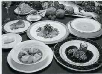
■エスカーレ ☎078-334-1785 (直) ■華蘭亭 ☎078-392-7180 (直) 17:00~20:30 (L.O.) 無休

北海道の大地の味覚を 味わおう ホテルモントレ神戸&アマリー ホテルモントレ神戸&アマリーでは、1/10(木)~3/10(日)まで、各レストランで冬の味覚・北海道フェアを開催中。 帆船をイメージしたホテルモントレ・アマリー1階のフレンチレストラン「エスカーレ」では、「特選メニュー「北の大地」が登場。サーモンやイクラ、たらは蟹など北海道の食材をふんだんに使用したフルコースが5000円(税・サ別)で楽しめる。また、北海道産のグラスワインもサービス。さらに平日に3900円以上のメニューを利用すると、食後にシェフのおまかせデザートが食べ放題。 モントレ神戸1階の和食レストラン「華蘭亭」では、すし食べ放題をメインにした深雪会席3500円(税・サ込)もあるから、こちらもおすすめ。順番に楽しんでみたい。 エスカーレ特選のメニュー 「北の大地」