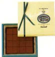
ゴンチャロフの生チョコレート(スイート) ¥1000 生チョコレート16個