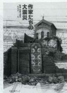
2000円十税 月刊神戸っ子