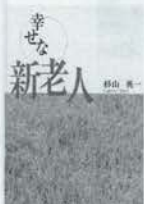
神戸新聞総合出版センター 1200円+税

老人は縁側で茶をすするべし? そんなの誰が決めたのだ。今どきの老人は「新」老人。仕事もすれば旅にも出るぞ。人生を満喫するぞ。人生経験を駆使し、この平和を謳歌するのだ。新老人は幸せ者