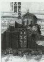
作家たちの大震災 阪神・淡路大震災1995.1.17 2000円+税