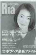
美・KOBEism RIA Vol.1~4 480円+税