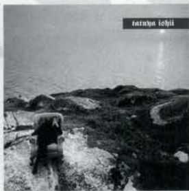
石井竜也「遠くへ…」 ¥1,500 sony Records タイトルどおりどこか遠くへ連れて行かれそうな壮大なメロウナンバー。彼のすばらしい世界をさまよってください。