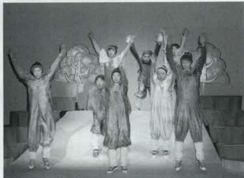
「風にのれ、プッピー」より

大きな山のせいで、半日しか日があたら ず米が実らない村「半日村」を舞台に、 ままならない暮らしを救いたい思いから 立ち上がる少年一平とそれを取り巻く百 姓たち、そのようすを終始見つめる神の 子を中心に繰り広げられる。斎藤隆介作 「半日村」をもとに、昨年「風にのれ、プ ッピー」で家族劇場公演史上初のオリジ ナル作品を手がけた劇団若手の清水章 代があらたに書き下ろした「Jamakko Yama」(じゃまっこ山)。2/3から、5会場 で公演予定。どうぞ期待。