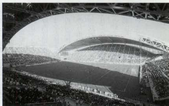
神戸ウイングスタジアムには30,813人が来場。(11月24日、ヴィッセル神戸VS横浜F・マリノス戦)