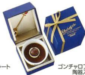
ゴンチャロフの生チョコレート 陶器入り(マロン) ¥1500 生チョコレート1個