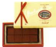
ゴンチャロフの生チョコレート(ブランデー) ¥500 生チョコレート8個