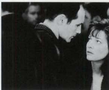
パトリス・シエロー監督作品。2001年ベルリン映画祭にて金熊賞受賞 ※チケットプレゼントあり

水曜日の昼下がり、女は男の部屋を訪ねる。言葉も交わさず、肉体だけの行為に浸る二人。そしてそれを次の週も次の週も繰り返す。身体だけの関係？だが、肉体のインティマシーにやがて異変がおこる。相手の過去と現在を求め、内面を探るとき、インティマシーは愛の親密へと昇華してしまうのだった。