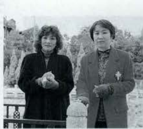
商品のハンドウォーマーを身につけて

ころ、商品化してほしいと望まれる。そこで介助の仕事は一時中断し、現在はハンドウォーマーに専念中。「何もかも手探り。特許を申請したり、宣伝サイトを立ち上げたり。でも、今できることは今しなくちやあって、2人で合言葉にして毎日を大切にしているんです」。