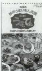
改訂版 神戸っ子大鑑 700円+税