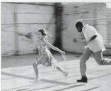
名作マルセイユの恋の監督ロベール・ネディキアンによる「愛の夢」 ※チケットプレゼントあり

港町マルセイユの一角で少しずつ、少しずつ、友情を、友情から恋を、恋から愛を育ててきたクリムとベベ。だが、黒い肌の青年ベベは人種差別主義者の警官に、レイプ犯として無実の罪で投獄されてしまう。白い肌の少女クリムは妊娠をしていた。産まれてくる子供を、自分たちの町マルセイユで育てたい。青年と少女の家族はそんな二人の願いを叶えてあげたいと望むようになる。そしてベベを救うために行動するクリムは…。