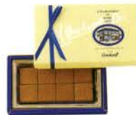
ゴンチャロフの生チョコレート(ミルク) ¥500 生チョコレート8個