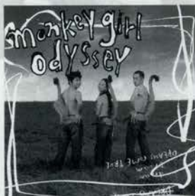
DREAMS COME TRUE [monkey girl odyssey] ¥3,199 東芝EMI 待望のNEWアルバム。今世紀初のオリジナルアルバムにふさわしいソウルフックでソウルな1枚。一家に1枚です。