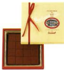
ゴンチャロフの生チョコレート(ブランデー) ¥1000 生チョコレート16個