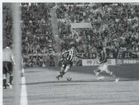
芝生も根付き、ピッチの状況も良好。あとは本戦を待つのみ。(11月24日、ヴィッセル神戸VS横浜F・マリノス戦)