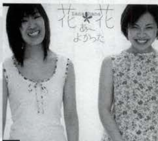
花*花「あ〜よかった」 ¥1,260 ワーナー・ミュ ージック・ジャパン 地元、兵庫県高砂市出身 のふたり。番組でもいま だにリクエストが絶えない 1曲。