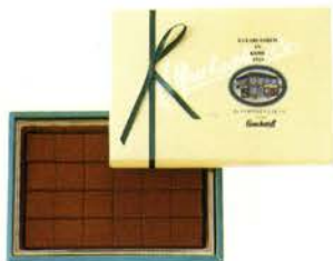
ゴンチャロフの生チョコレート(スイート) ¥1500 生チョコレート24個