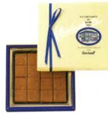
ゴンチャロフの生チョコレート(ミルク) ¥1000 生チョコレート16個

※これらの商品は、一部店舗での限定販売となります。詳しくは販売員までお問い合わせ下さいませ。要冷蔵のチョコレートです。また、一部お取り扱いのない商品もございますのでお尋ね下さい。