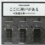
司馬遼太郎追想集 「ここに神戸がある」 1905円+税