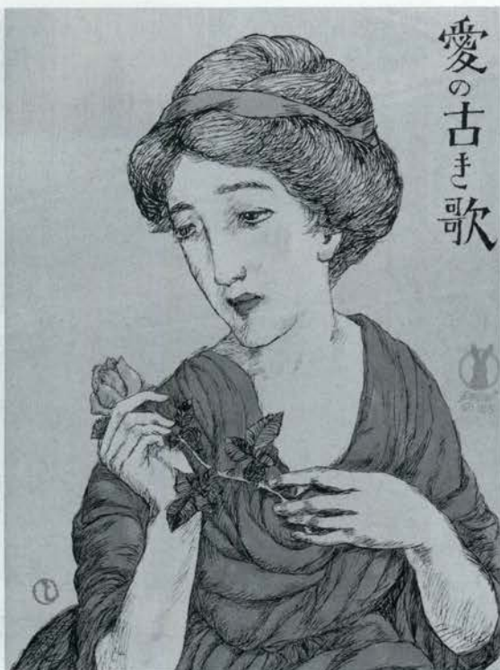
セノ才楽譜「愛の古き歌」夢二装画