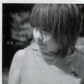
aiko [夏服] ¥3,059 ポニーキャニ オン 数あるaikoの作品のなかでもとくにキ ュートな彼女のジャク写真が印象的な 1枚。必聴です。