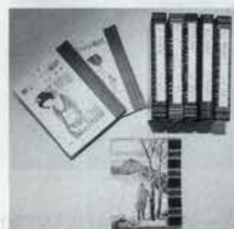
緑の笛豆本・第395集 1200円