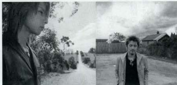
SOPHIA「Thankyou」 ¥1,260 トイズファクトリー ファンやスタッフに対してつねに感謝の気持ちを忘れない彼らの信念が込められた1枚。ぜひSOPHIAワールドを楽しんでください。