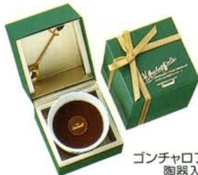
ゴンチャロフの生チョコレート 陶器入り(スイート) ¥1300 生チョコレート1個