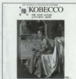
燦 神戸っ子 952円+税